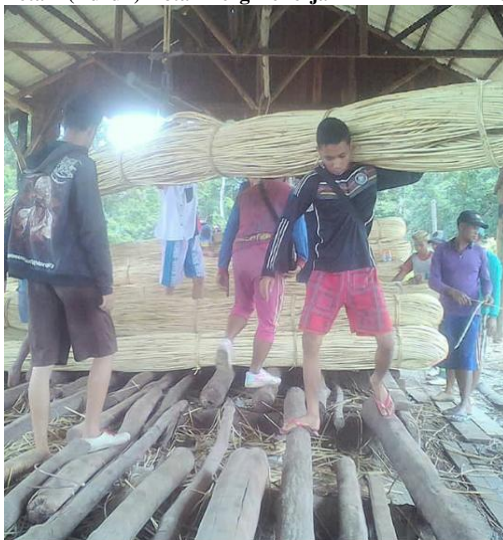
Petani (Buruh) Rotan Sedang Bekerja