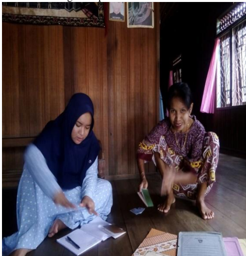
Wawancara dengan Responden