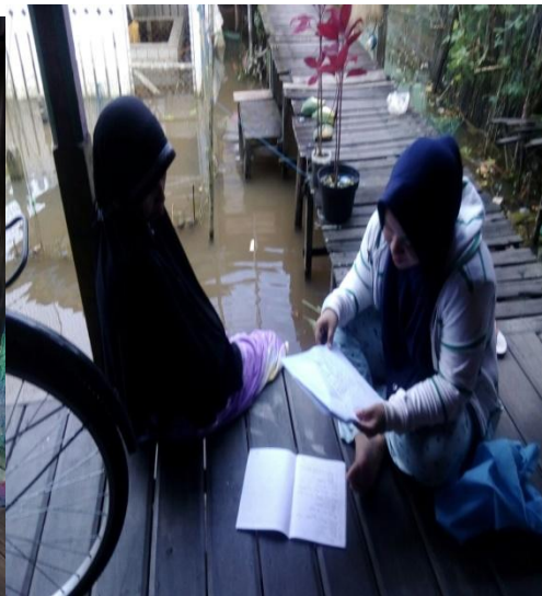
Wawancara dengan Responden