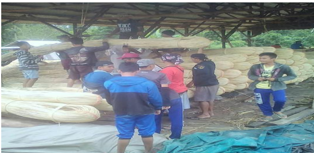
Petani (Buruh) Rotan Sedang Bekerja