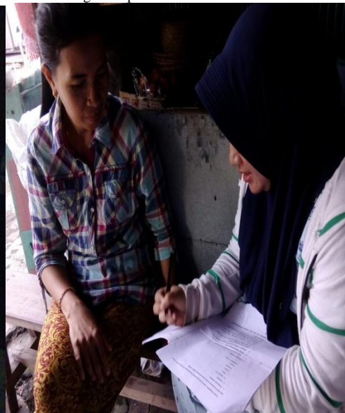
Wawancara dengan Responden