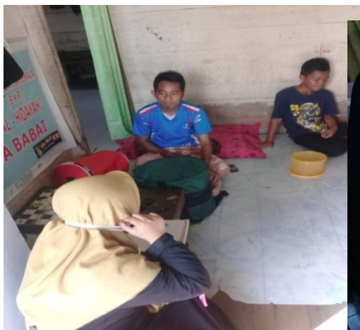
Wawancara dengan Ketua PHBI