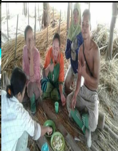
Petani Rotan SedangIstirahatBekerja