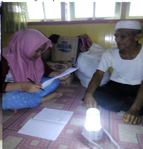
Wawancara dengan Informan