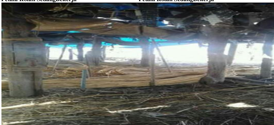
Petani Rotan SedangBekerja