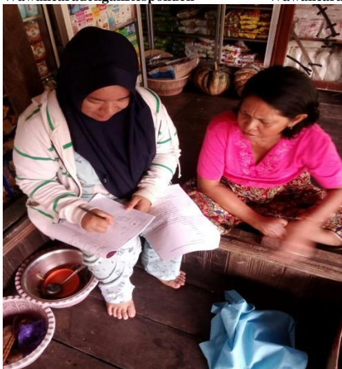
Wawancara dengan Responden