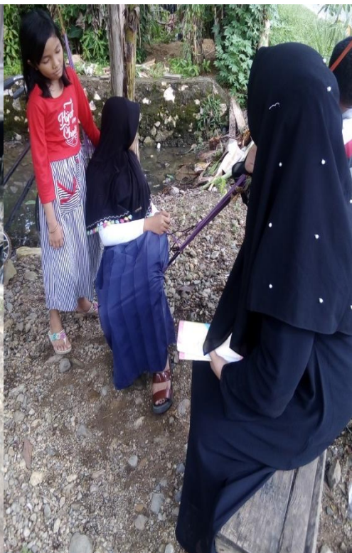
Wawancara dengan Anak Petani Rotan