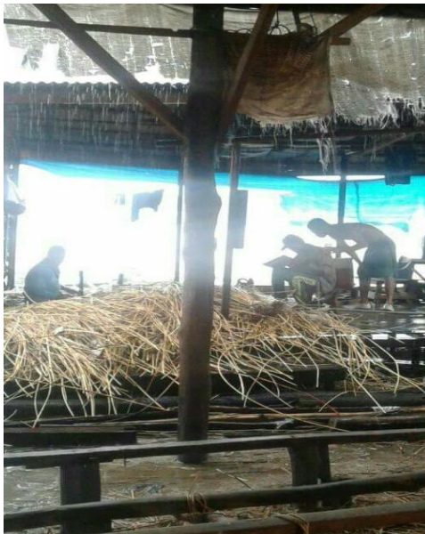
Petani Rotan SedangBekerja