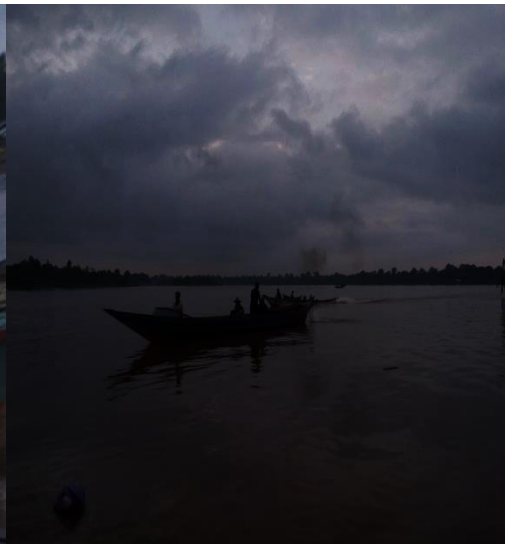
Petani (Buruh) Rotan Pergi Bekerja