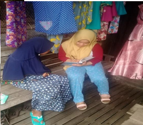
Wawancara dengan Responden