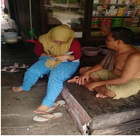
Wawancara dengan Responden