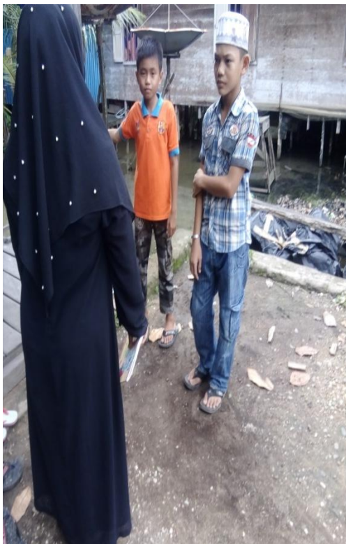
Wawancara dengan Anak Petani Rotan