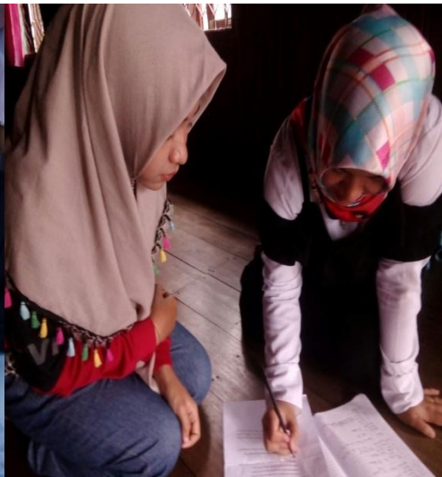
Wawancara dengan Responden