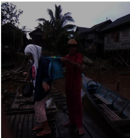
Petani (Buruh) Tani Roran Pergi Bekerja