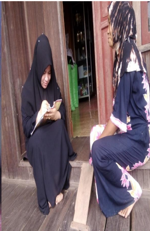
Wawancara dengan Responden