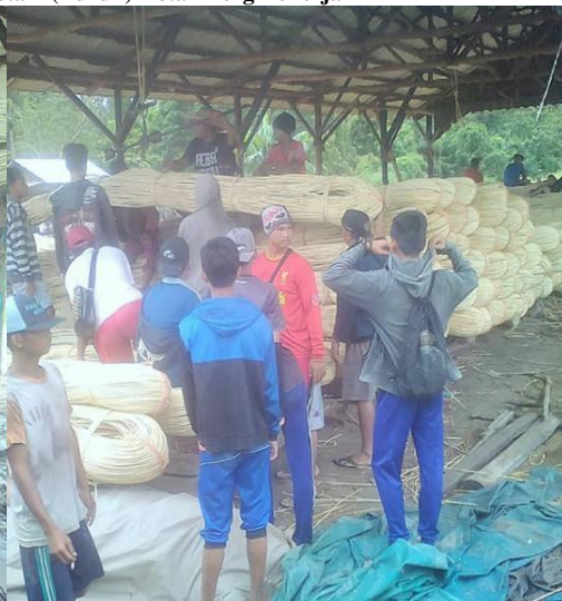
Petani (Buruh) Rotan Sedang Bekerja