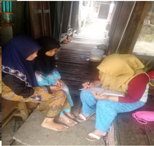
Wawancara dengan Responden