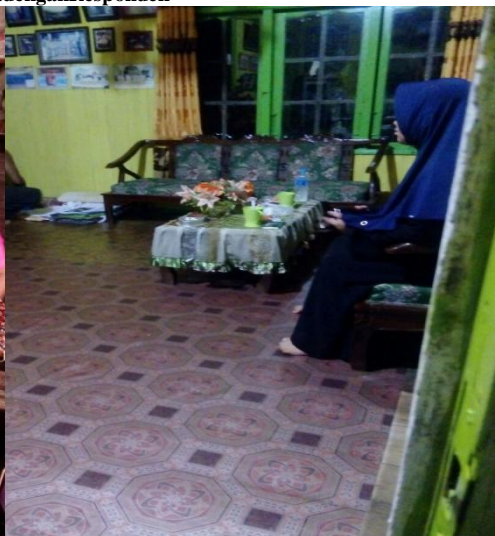
Meminta Izin Riset dengan Kepala Desa