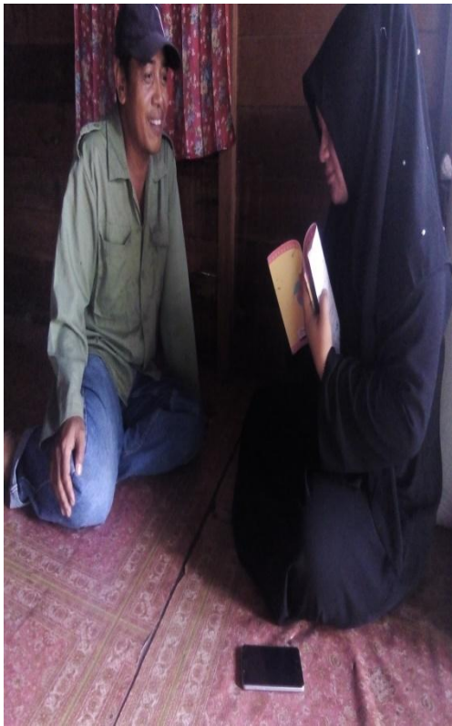
Wawancara dengan Responden