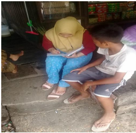
Wawancara dengan Responden