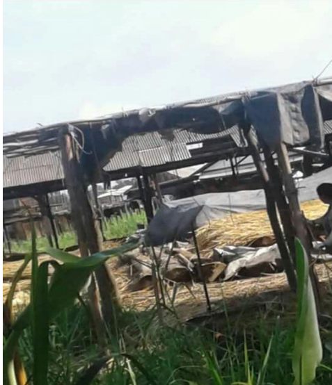
Petani Rotan SedangBekerja