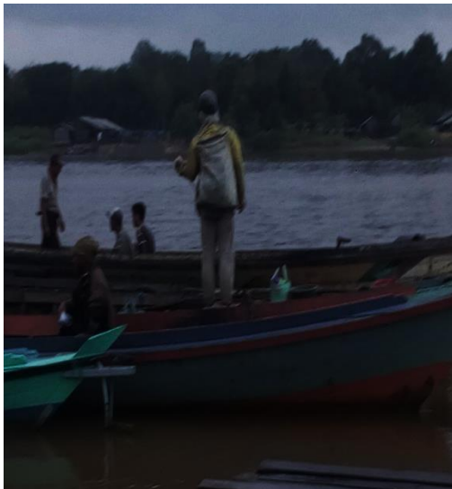
Petani (Buruh) Rotan Pergi Bekerja