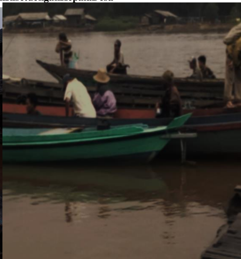
Petani (Buruh) Tani Roran Pergi Bekerja