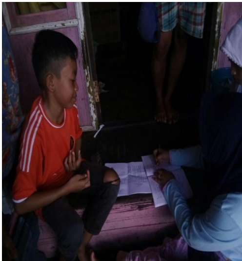
Wawancara dengan Responden