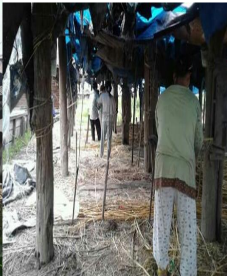
Petani Rotan SedangBekerja