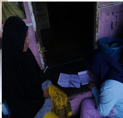
Wawancara dengan Responden