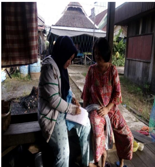
Wawancara dengan Responden