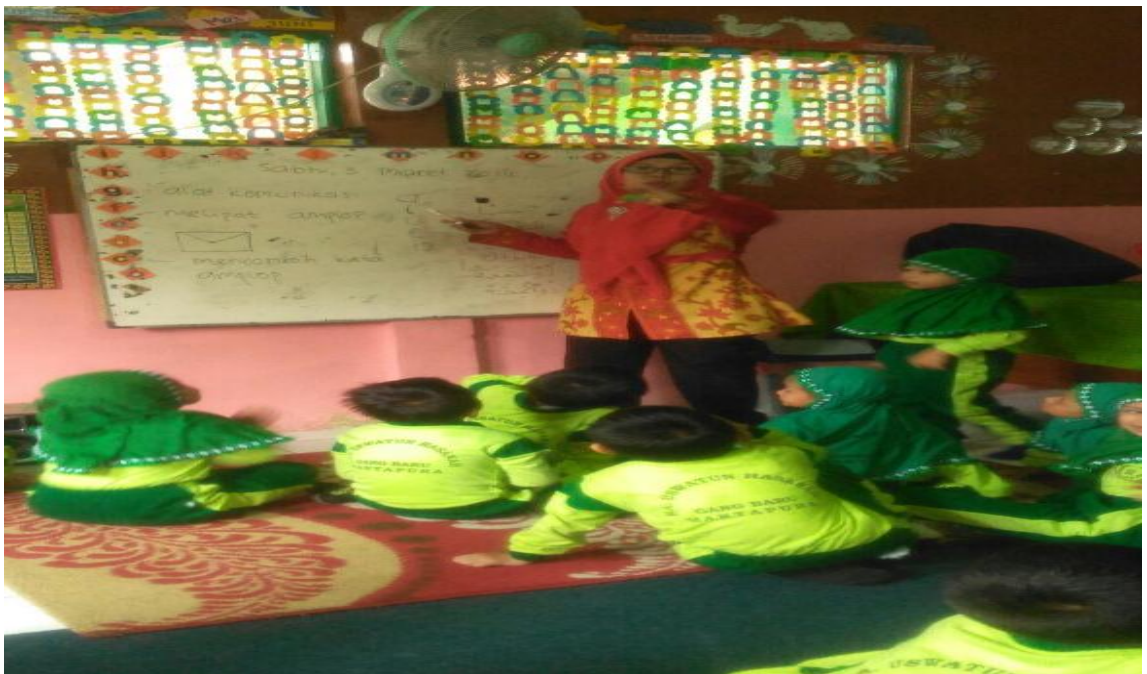
Gambar 5 kegiatan di kelas kontrol