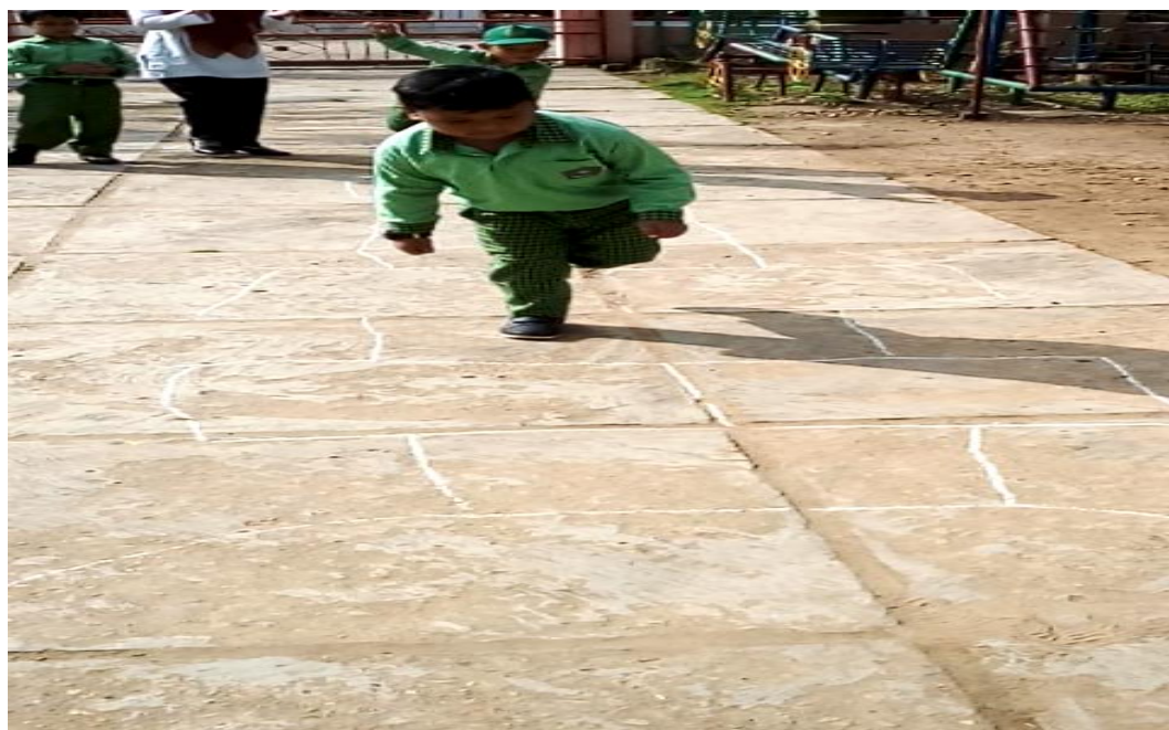
Gambar 4 Anak sedang bermain permainan tradisional Basamsaman ( Treatment kelas eksperimen)