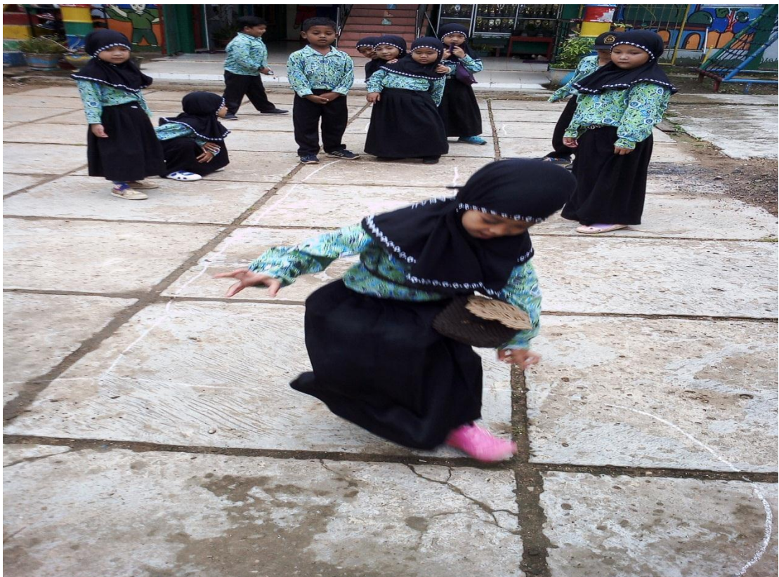
Gambar 7 Postest kelas kontrol