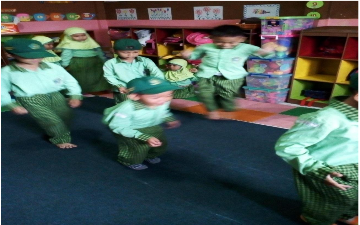
Gambar 10 (Lanjutan)