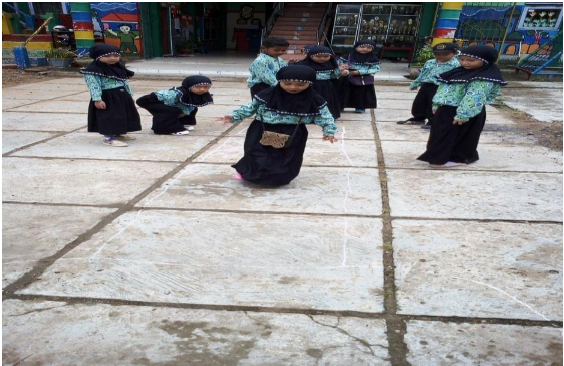
Gambar 6 Postest kelas eksperimen