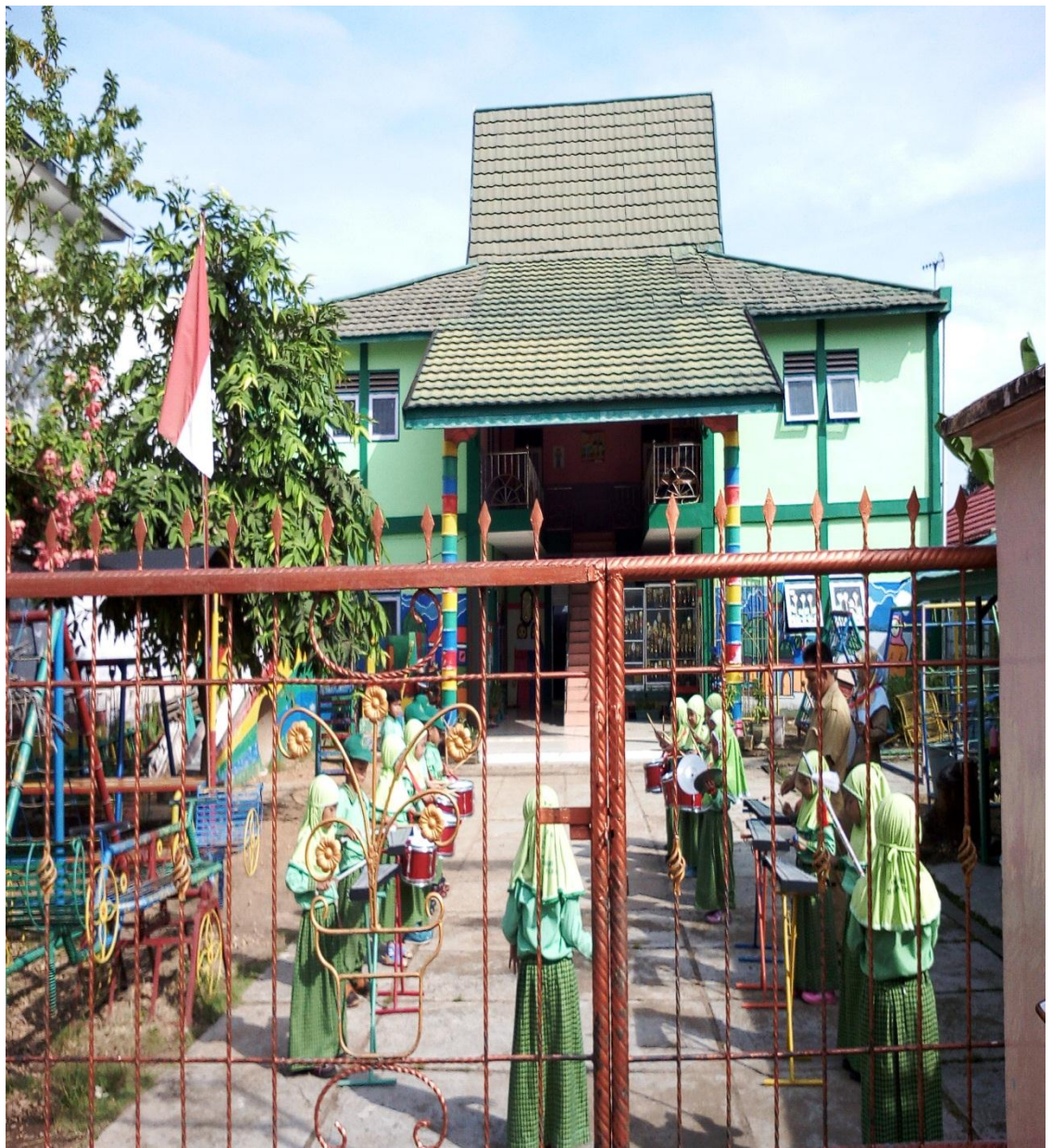
Gambar 1 RA Uswatun Hasanah Martapura