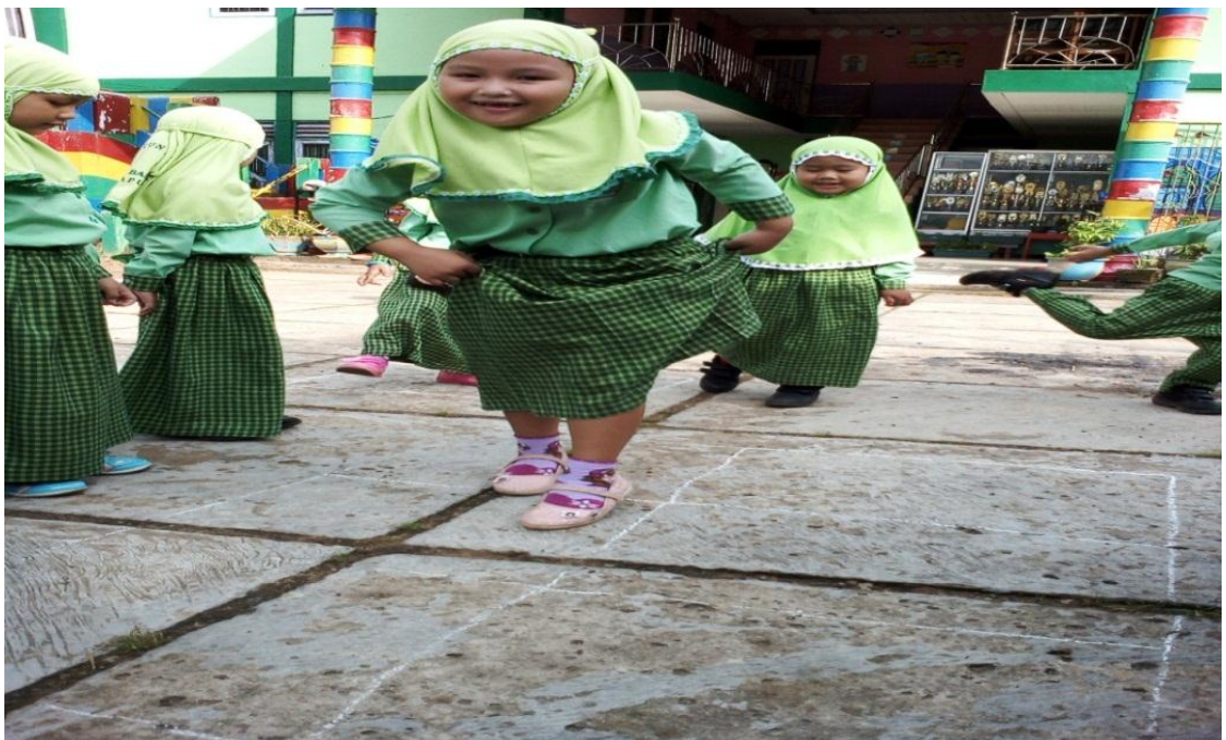
Gambar 2 kegiatan Pretest kelas eksperimen