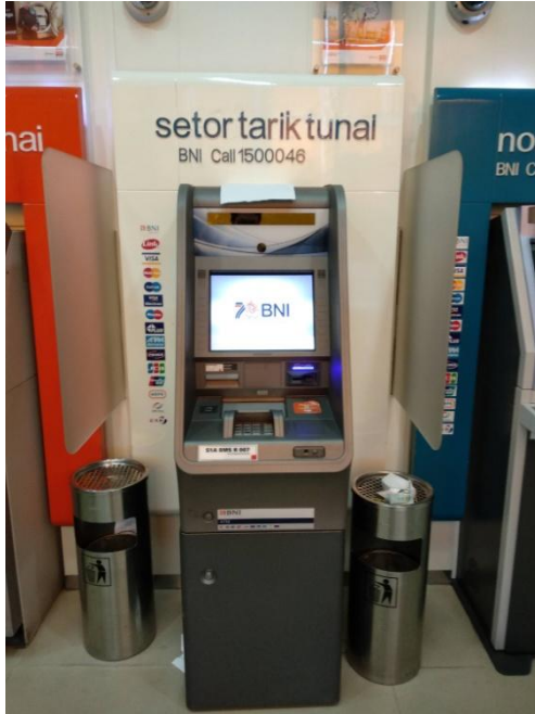
Foto Layanan Cash Deposit Machine