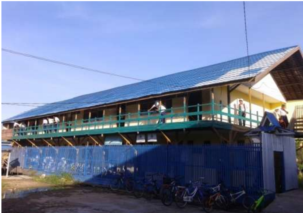
Madrasah Tsanawiyah Diniyah Babussalam terlihat dari luar