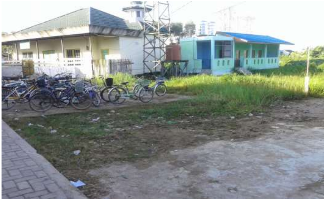
Foto kegiatan rutin yang dilakukan oleh siswa Madrasah Tsanawiyah Diniyah Babussalam setiap pagi hari