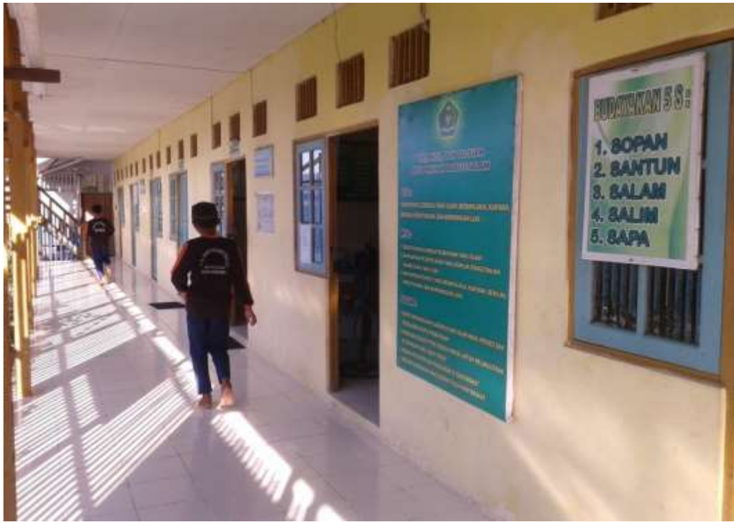
Madrasah Tsanawiyah Diniyah Babussalam terlihat dari samping kiri