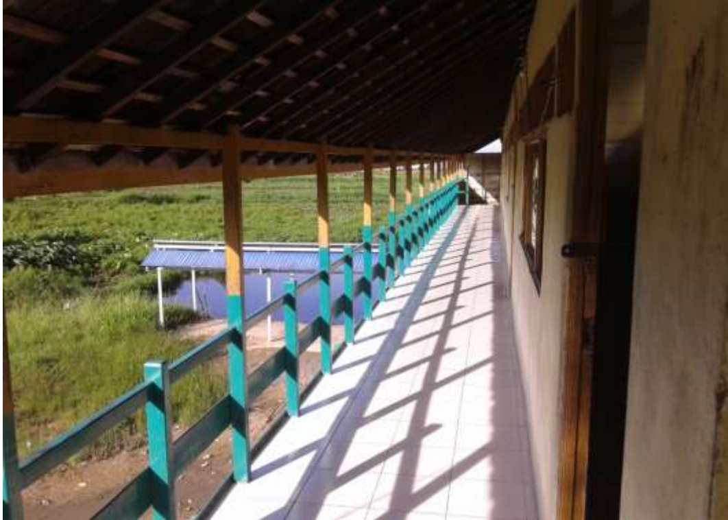
Madrasah Tsanawiyah Diniyah Babussalam lantai atas kelas siswa dari samping kiri