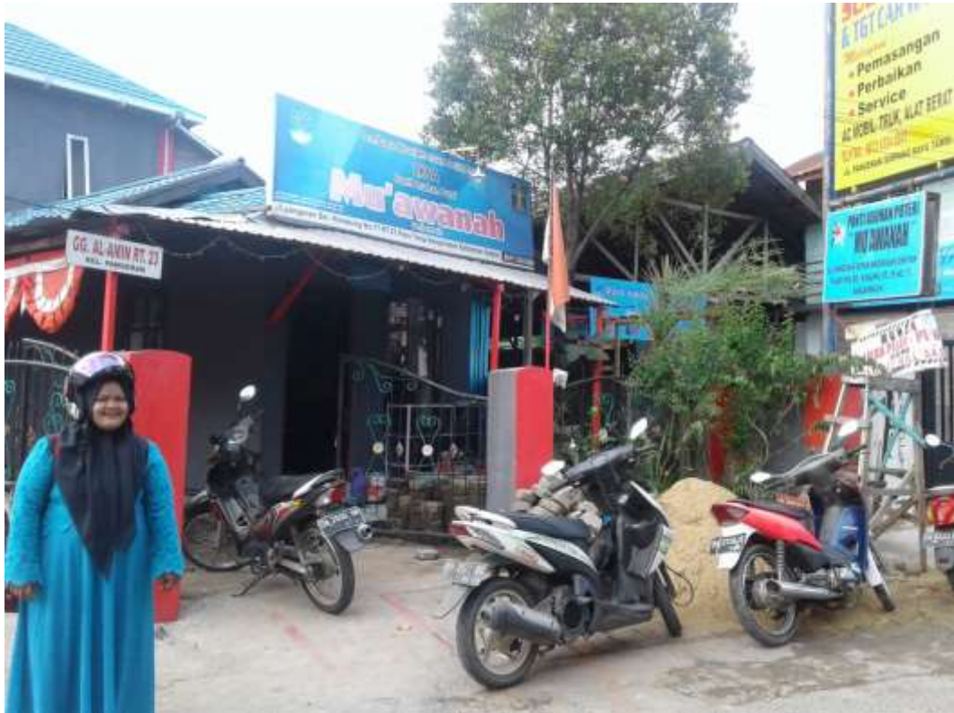
GAMBAR DARI SAMPING