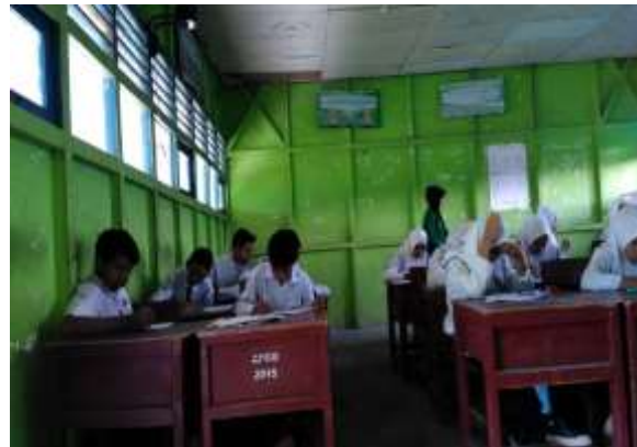
Pemberian Perlakuan (Bimbingan Kelompok)