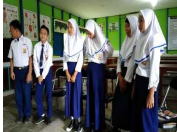
Pemberian Perlakuan (ceramah)