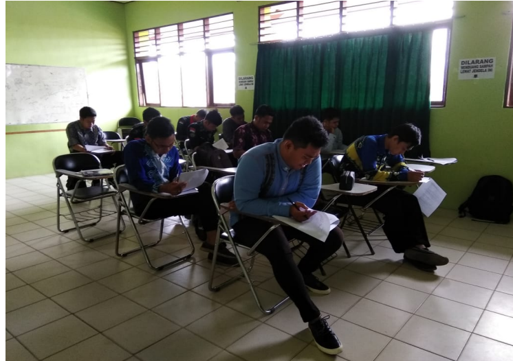
Foto Pembagian Skala EDPKK dikelas MPI A Angkatan 2016