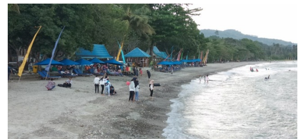
Keadaan Pantai Gedambaan pada Hari Minggu