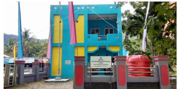
Kantor UPTD Pantai Gedambaan