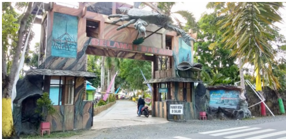
Pintu Gebang Masuk Pantai Gedambaan