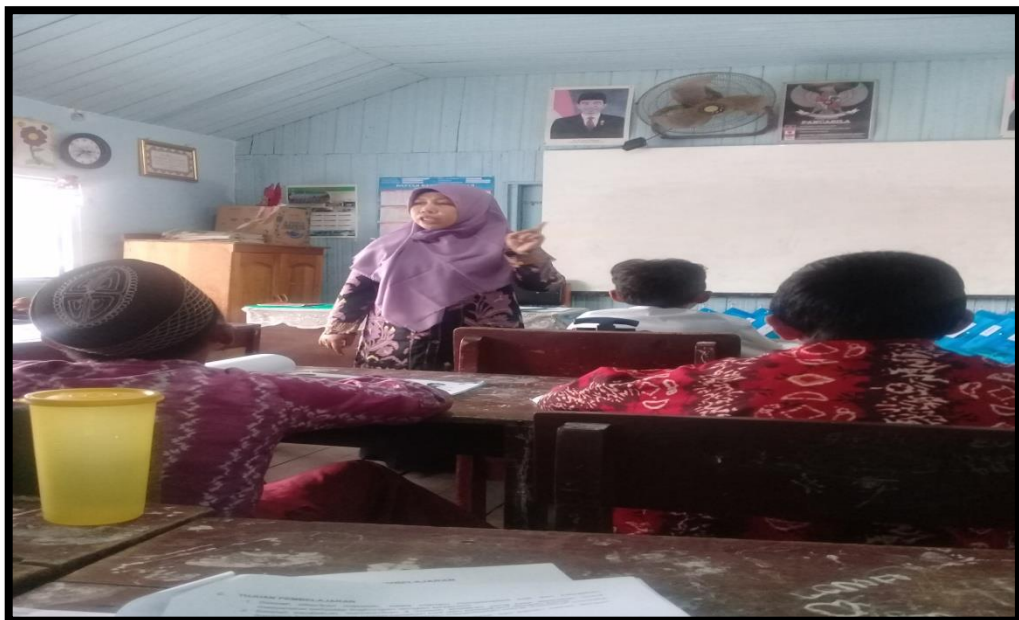
Guru Menjelaskan Materi Pelajaran