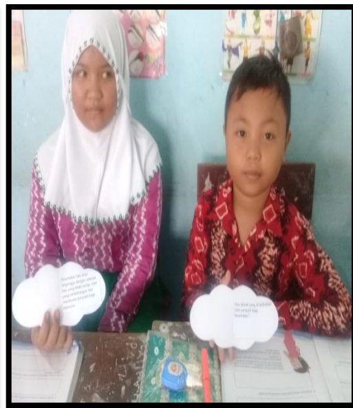
Peserta Didik Duduk bersama Pasangannya dan Mendiskusikan Kembali Isi Kartu