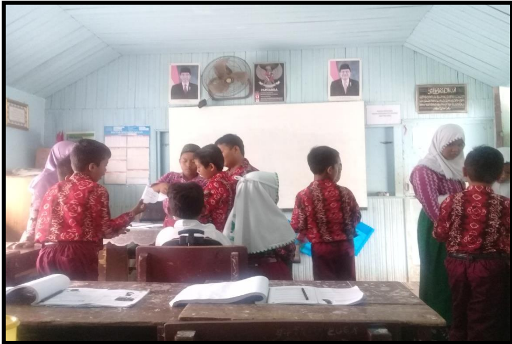
Peserta Didik Mencari Pasangan yang Sesuai dengan Kartu yang Dia Peroleh