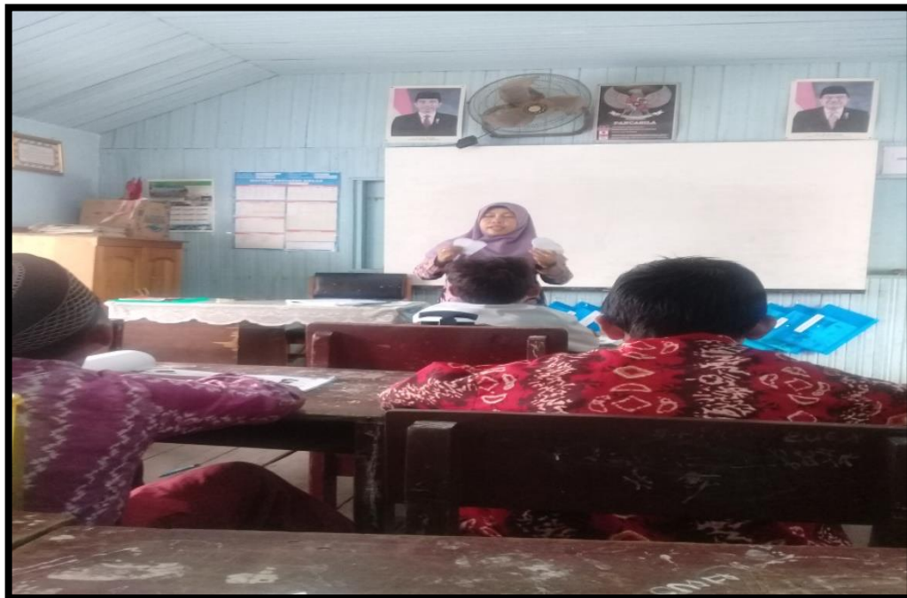
Guru Menjelaskan Langkah-Langkah Permainan Strategi Index Card Match