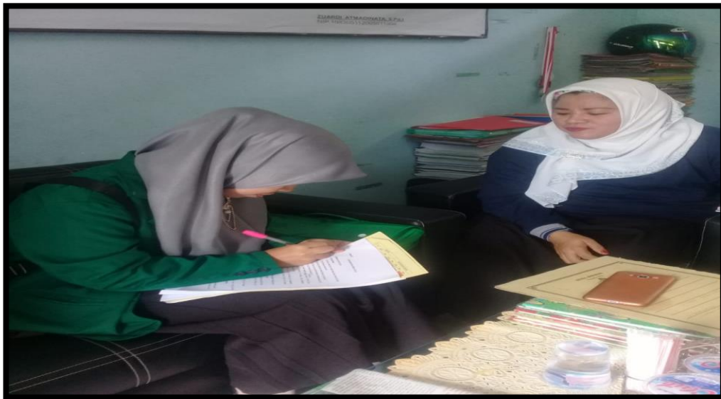
Wawancara dengan Kepala Sekolah MI Darul Ulum Pekauman Banjarmasin