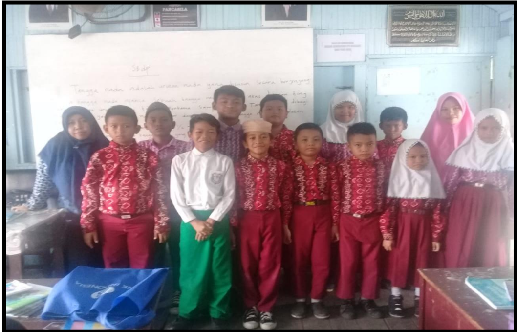
Foto bersama Guru dan Peserta Didik Kelas IV MI Darul Ulum Pekauman Banjarmasin