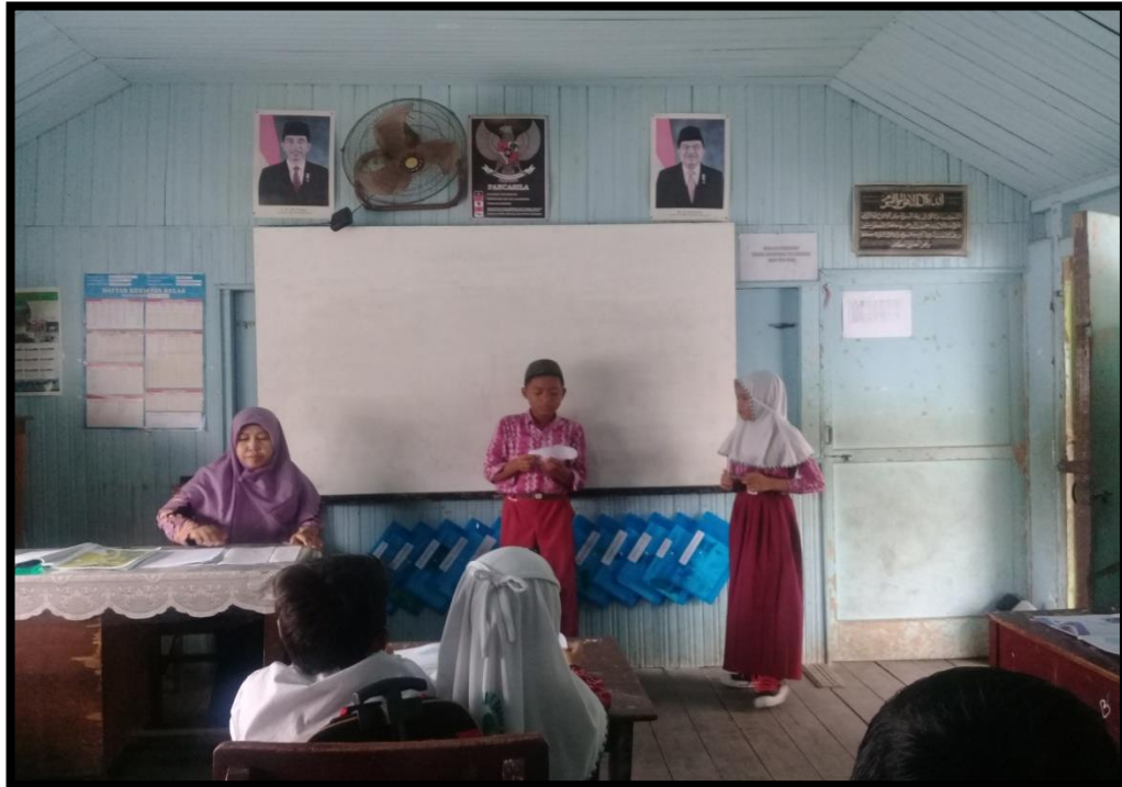
Peserta Didik Membacakan Pasangan Kartu Pertanyaan dan Jawaban di Depan Kelas