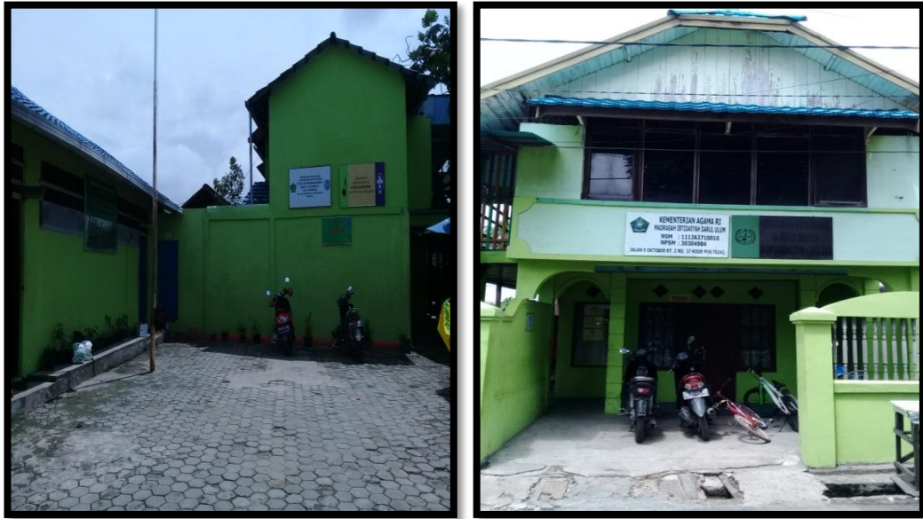
Halaman MI Darul Ulum Pekauman Banjarmasin