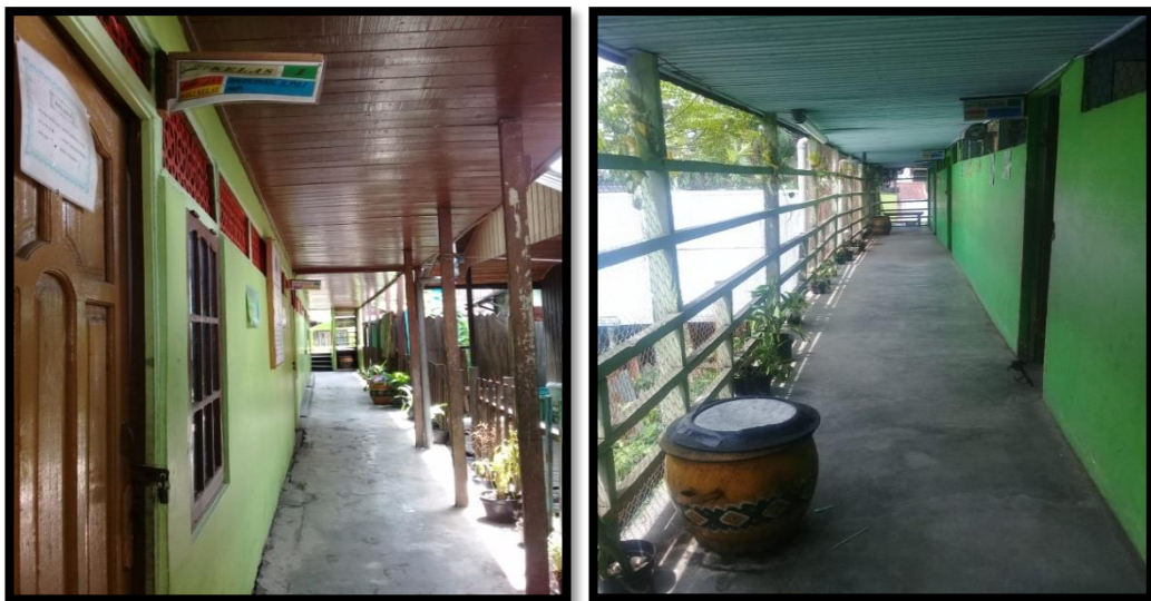
Ruang Kelas I-VI MI Darul Ulum Pekauman Banjarmasin