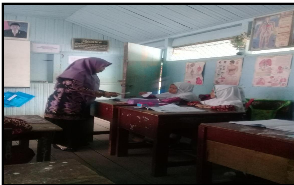
Guru Membagikan Kartu Soal dan Kartu Jawaban Secara Acak Kepada Peserta Didik