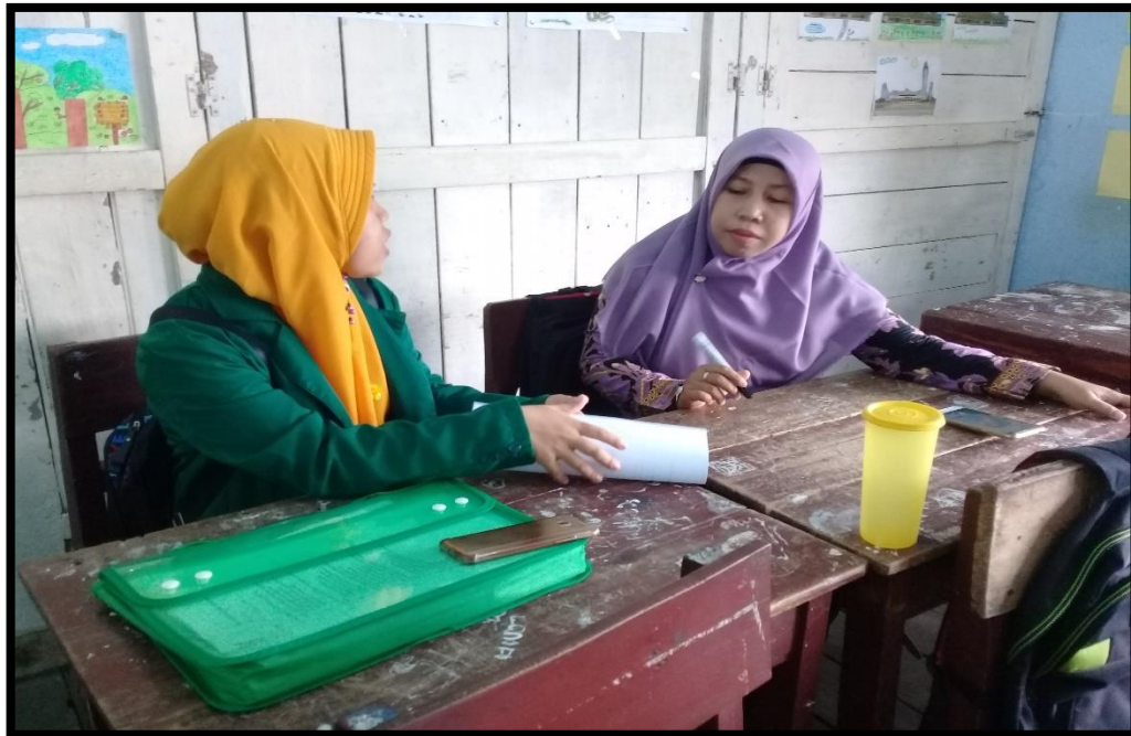
Wawancara dengan Guru Kelas IV MI Darul Ulum Pekauman Banjarmasin