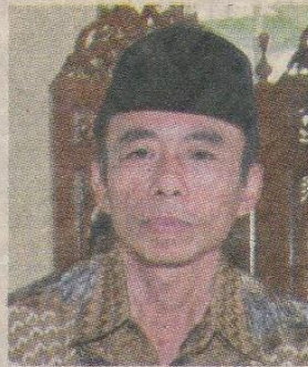
Oleh: Murjani Sani

Belum lagi bila dihubungkan dengan ibadah haji/umrah. Semua jemaah berebut dan berlomba salat jemaah di Masjid al-Haram, nilai pahalanya 100.000 kali dibanding di masjid lain. Di Madinah, salat arba'in berjemaah dengan nilai sama dengan