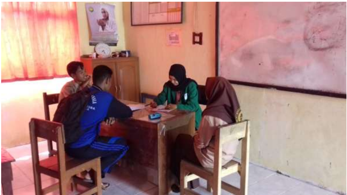
Wawancara dengan siswa siswi kelas X IIK.