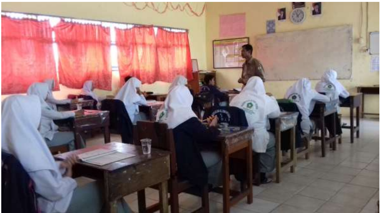
Proses Belajar Mengajar Alquran Hadits kelas XI IIK di Madrasah Aliyah Negeri 5 Barito Kuala.