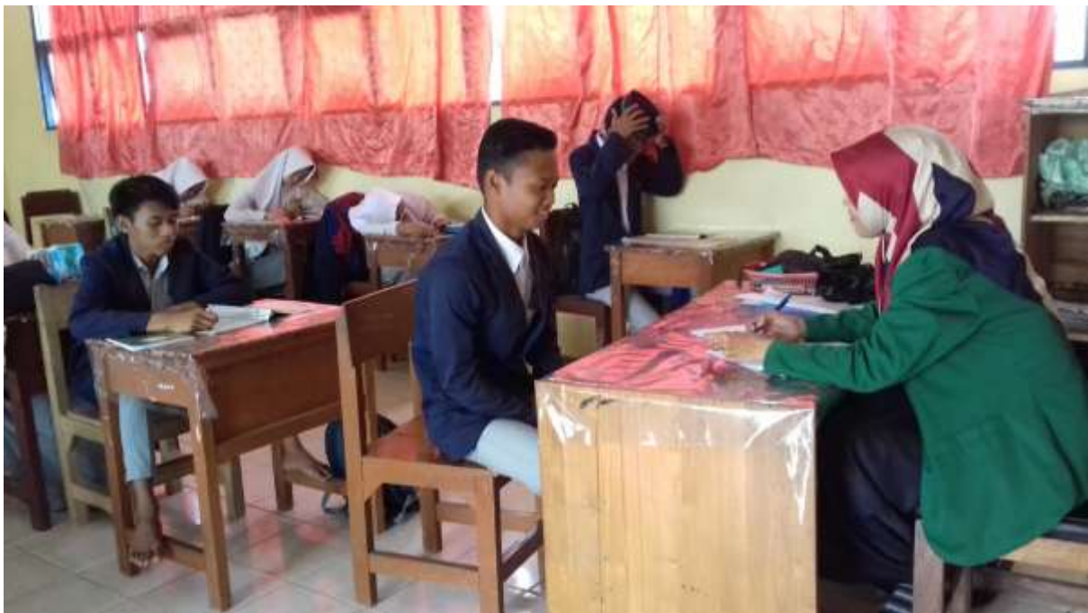
Wawancara dengan siswa kelas XI IIK