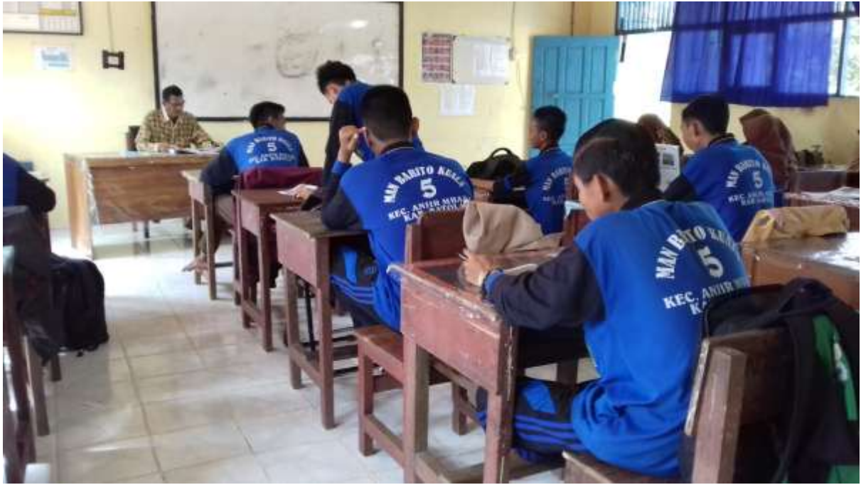
Proses Belajar Mengajar Alquran Hadits kelas X IIK di Madrasah Aliyah Negeri 5 Barito Kuala.