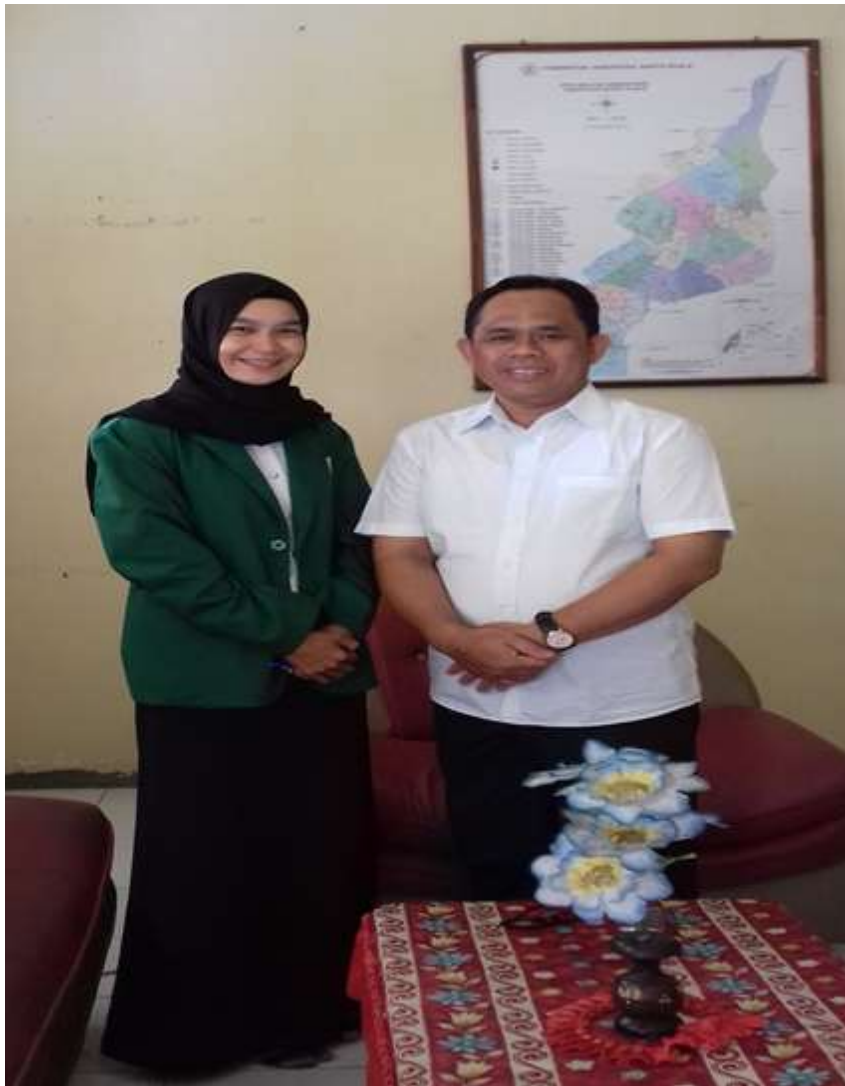
Foto Bersama Kepala Sekolah Madrasah Aliyah Negeri 5 Barito Kuala