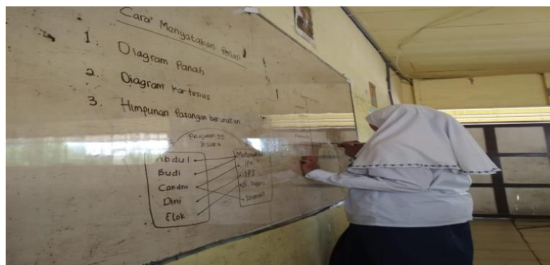
Gambar XI. Siswa mengerjakan soal di papan tulis