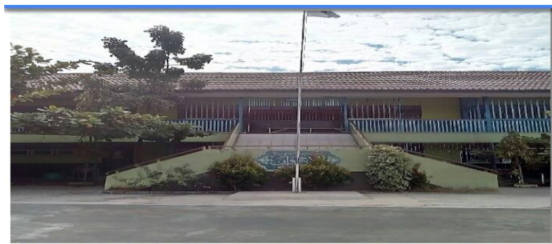
Gambar VI. Bagian Depan MTs. Al-Ikhwan