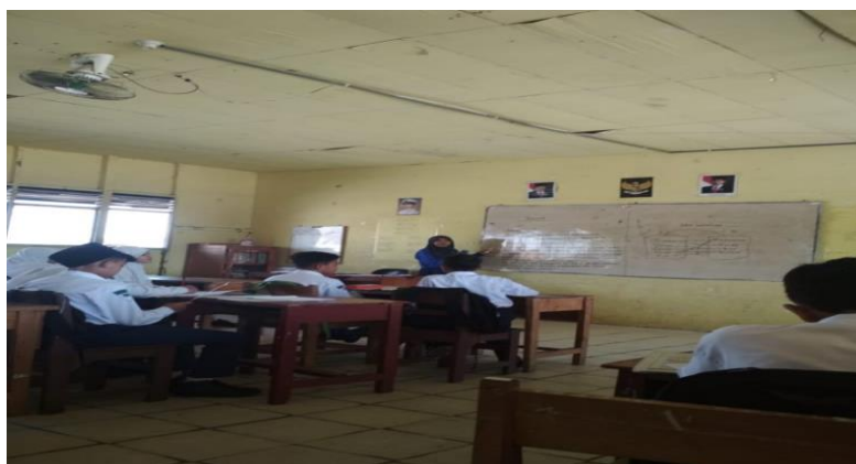
Gambar X. Guru menyajikan materi dipapan tulis

Guru menjelaskan materi tentang relasi kepada siswa, kemudian guru memberikan contoh soal yang dikerjakan secara bersama-sama. Guru memberikan kesempatan kepada siswa untuk mencatat hal-hal yang penting dari penjelasan guru tersebut.