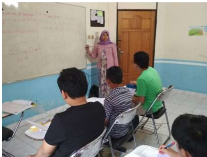
Gambar 4. 11. Teknik Pembelajaran Tatap Muka yang Berlangsung di Dalam Kelas

disampaikan pada hari tersebut. Pembelajaran tatap muka yang dilaksanakan dalam satu semester biasanya sebanyak 16 kali.