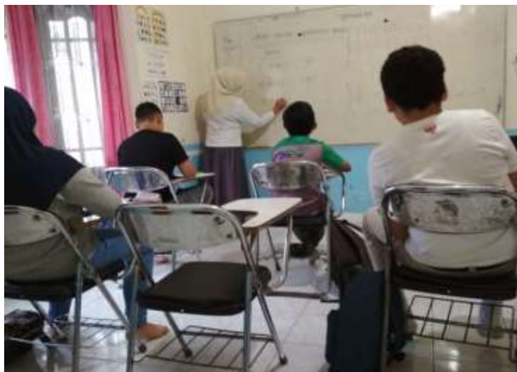
Gambar 4. 4. Siswa Saat Mengerjakan Tugas yang di Berikan Oleh Guru

Guru pun melakukan kegiatan apersepsi dengan mengarahkan siswa kepada materi yang akan dipelajari yaitu FPB dan KPK dengan menjelaskan tentang menentukan FPB dan KPK dua bilangan dan menentukan FPB dan KPK tiga bilangan. Guru pun selalu tidak lupa selalu mengingatkan kembali konsep operasi hitung campuran bilangan bulat yang sudah dipelajari minggu lalu.