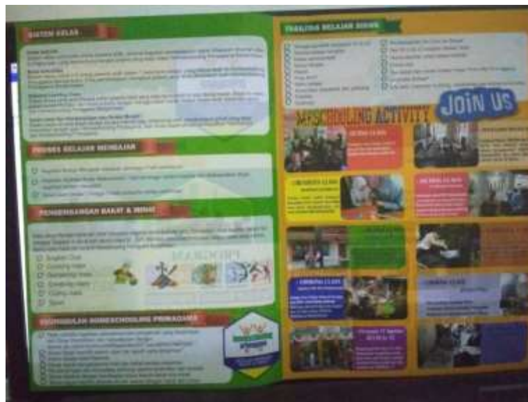
Gambar 4. 3. Brosur Pendaftaran Homeschooling Primagama (HSPG) Banjarmasin