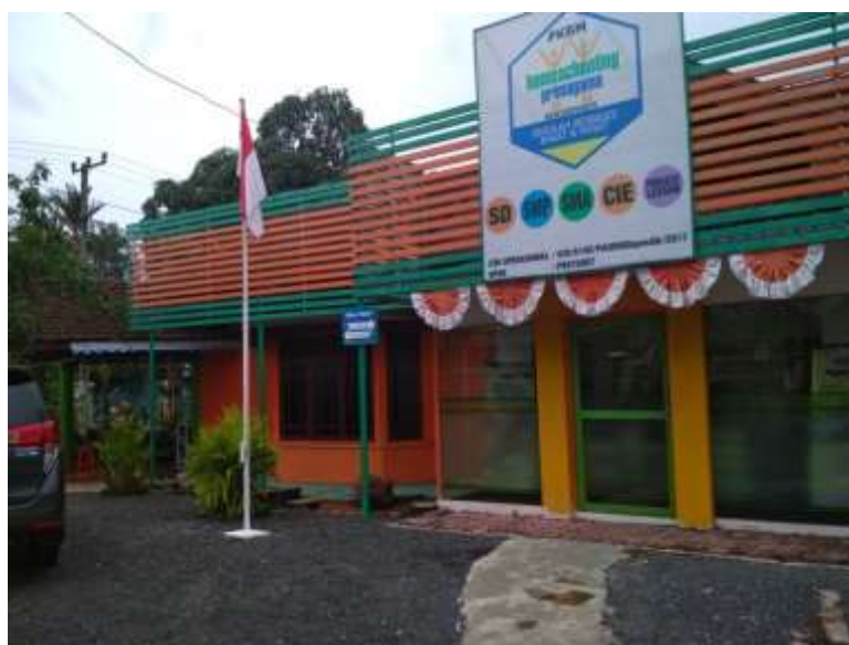
Gambar 4. 1. Homeschooling Primagama (HSPG) Banjarmasin

Yogyakarta. Awal mula berdirinya homeschooling itu adalah pertama, anak-anak merasa tidak nyaman dengan kurikulum nasional dimana belajarnya sampai sore kemudian ditambah dengan adanya PR. Kemudian dari adanya kurikulum nasional tadi banyak anak-anak yang diistilahkan dalam tanda yaitu kutip mogok sekolah, disisi lain orang tua tetap ingin anak nya sekolah dan bagaimana caranya anak-anak tersebut merasa nyaman. Pada akhirnya di Yogyakarta muncullah ide untuk melaksanakan yang namanya homeschooling .