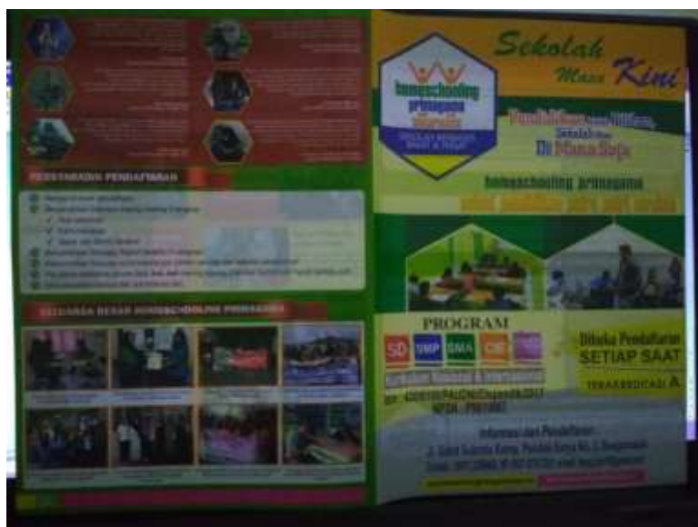
Gambar 4. 2. Brosur Pendaftaran Homeschooling Primagama (HSPG) Banjarmasin