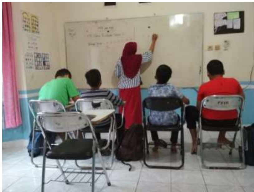
Gambar 4. 7. Guru Menuliskan Materi di Papan Tulis

Guru memotivasi siswa, menarik perhatian siswa agar mengikuti proses pembelajaran dengan baik, siswa memperhatikan motivasi yang dilakukan oleh guru. Guru menyampaikan tujuan dan manfaat pembelajaran, siswa mendengarkan dan memperhatikan apa yang disampaikan oleh guru dan mengikuti dengan seksama segala sesuatu yang disampaikan. Melakukan apersepsi dengan mengajukan pertanyaan untuk mengarahkan siswa kepada materi yang akan dipelajari kemudian mengingatkan kembali konsep perkalian bilangan bulat.