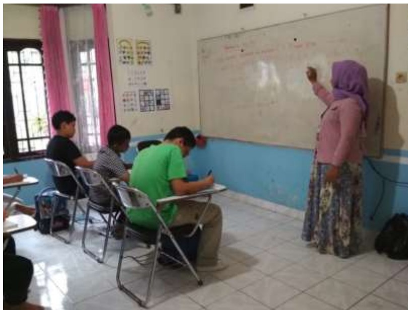
Gambar 4. 2. Guru Saat Menjelaskan Materi Pelajaran