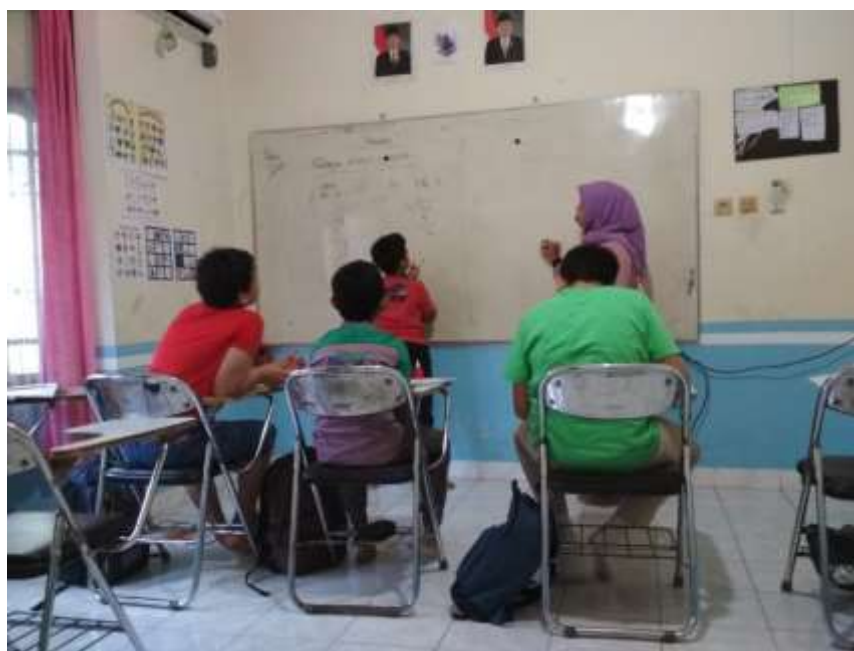
Gambar 4. 8. Saat Salah Satu Siswa Menjawab Soal yang di Berikan oleh Guru di Papan Tulis

Peserta didik lain dan guru memberikan tanggapan dan menganalisis hasil presentasi meliputi tanya jawab untuk mengonfirmasi, memberikan tambahan informasi, melengkapi informasi ataupun tanggapan lainnya.