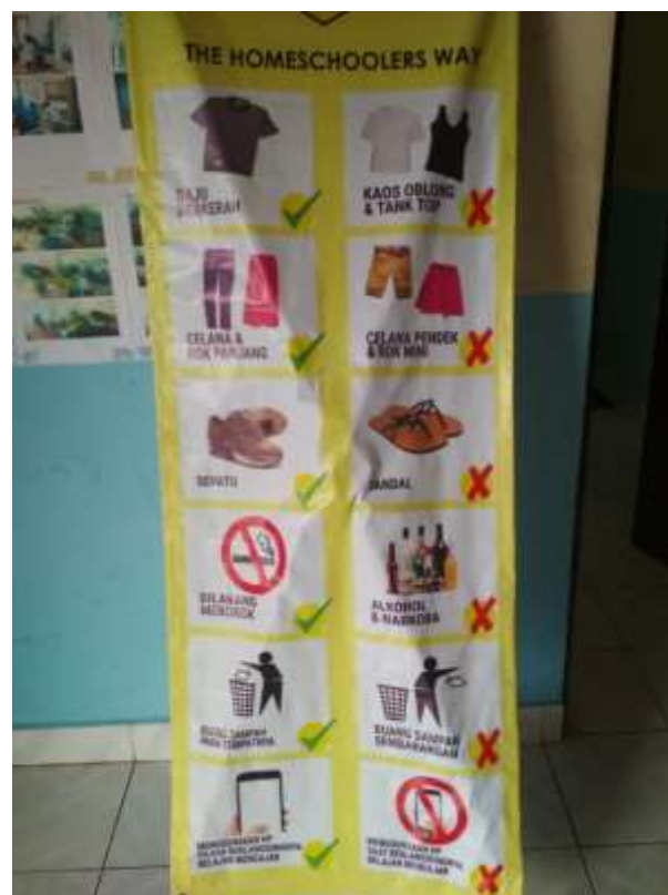
Gambar 4. 3. Aturan yang ada di Homeschooling Primagama (HSPG) Banjarmasin