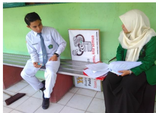
Wawancara dengan Siswa kelas XI