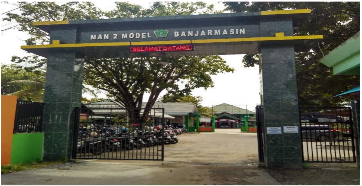
Pintu Gerbang MAN 2 Model Banjarmasin