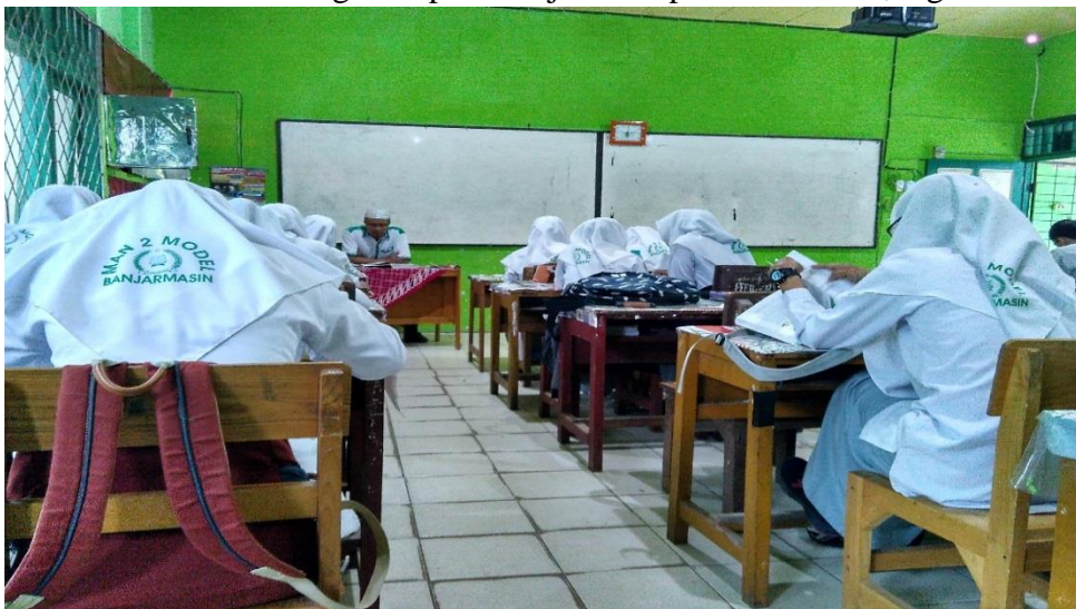
Observasi Kegiatan pembelajaran Bapak Bahrani, M.Ag