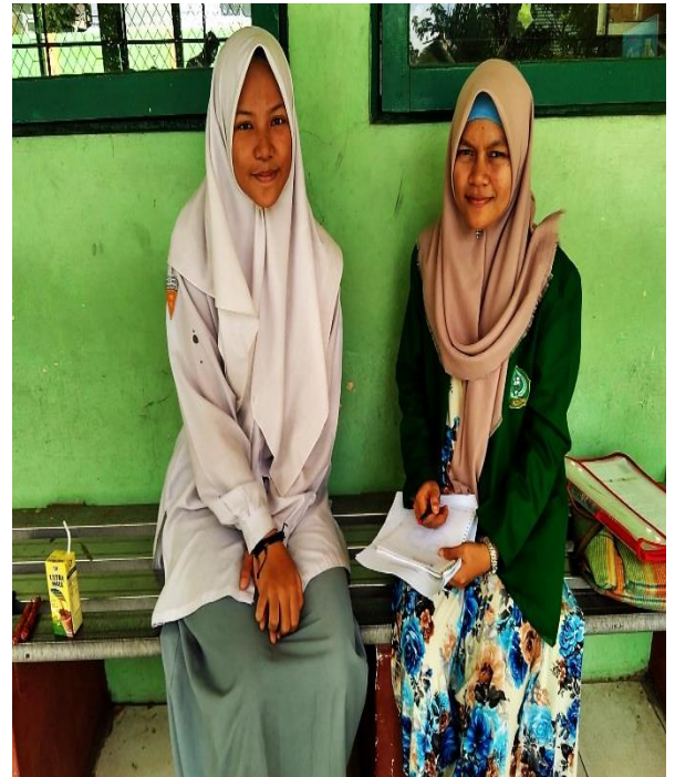
Wawancara dengan Siswi Kelas XI