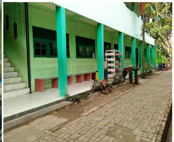
Ruang Kelas MAN 2 Model