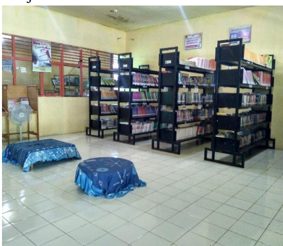
Perpustakaan MAN 2 Model Banjarmasin