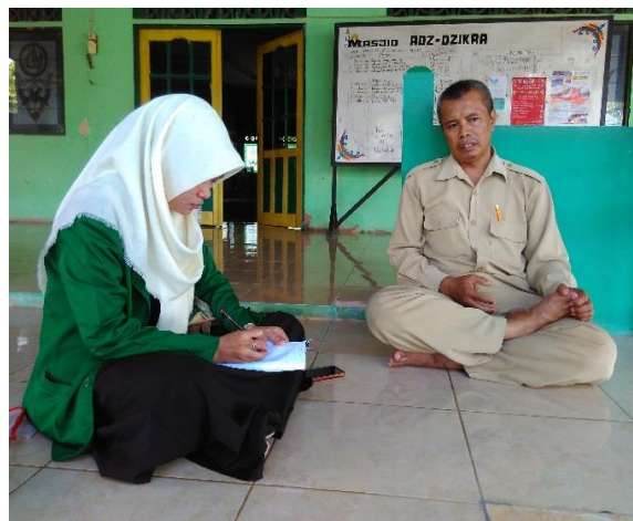
Wawancara dengan Bapak