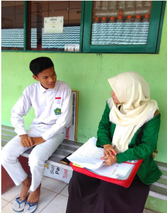
Wawancara dengan siswa kelas XI