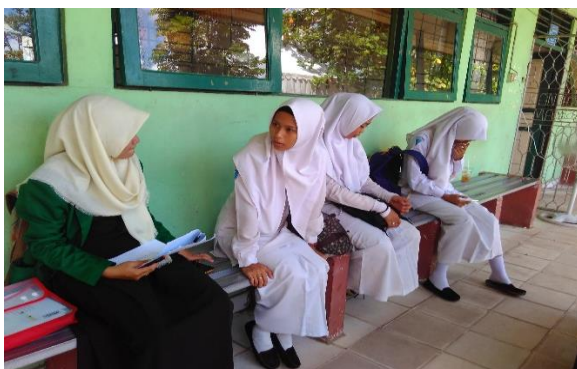
Wawancara dengan Siswi Kelas XII