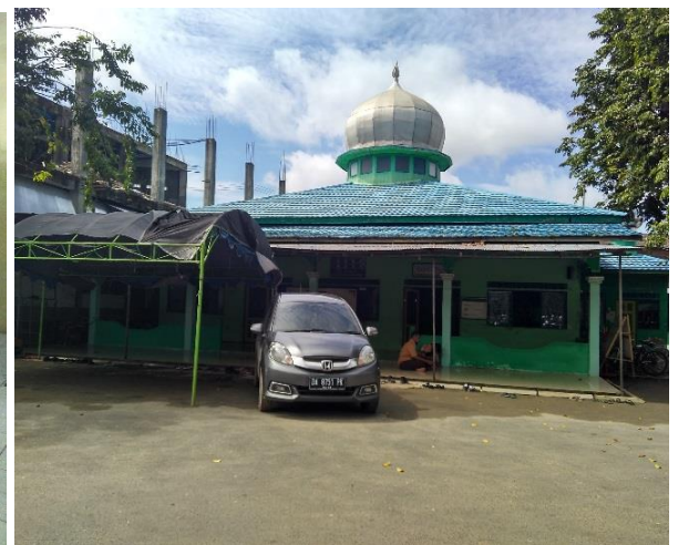
Masjid Adz Dzikra