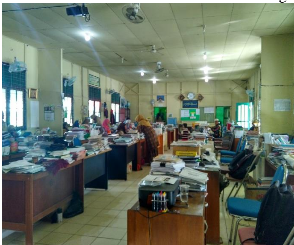
Ruang Guru MAN 2 Model Banjarmasin Banjarmasin