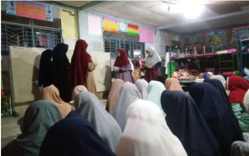
تنفيذ تعليم في عملية المجادلة