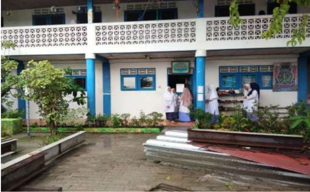
مسكن اللغة بمعهد الفلاح للبنات

حال مسكن اللغة في معهد الفلاح للبنات بنجر بارو