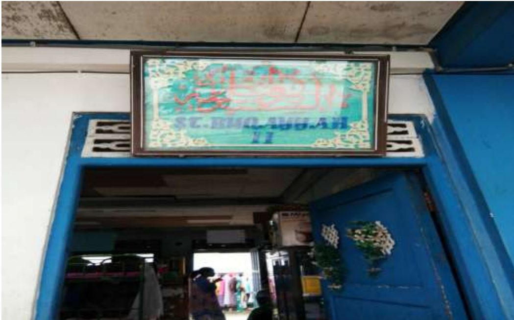
مسكن اللغة بمعهد الفلاح للبنات