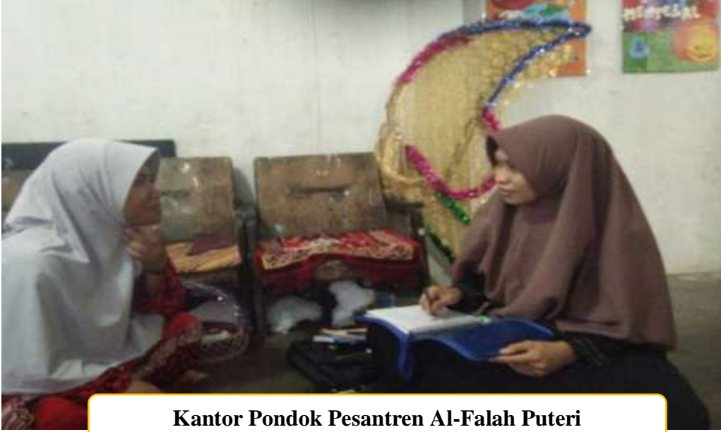
Kantor Pondok Pesantren Al-Falah Puteri