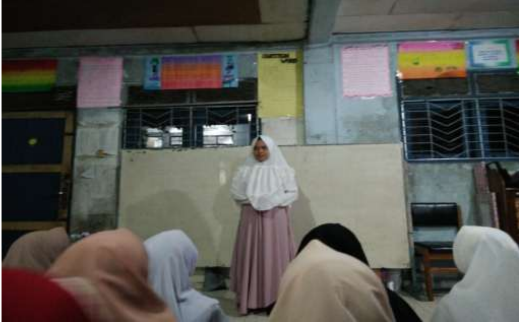
تنفيذ تعليم في عملية المحاضرة