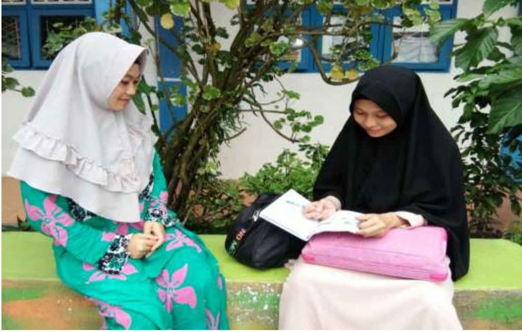
المقابلة مع معلمة هردينتي