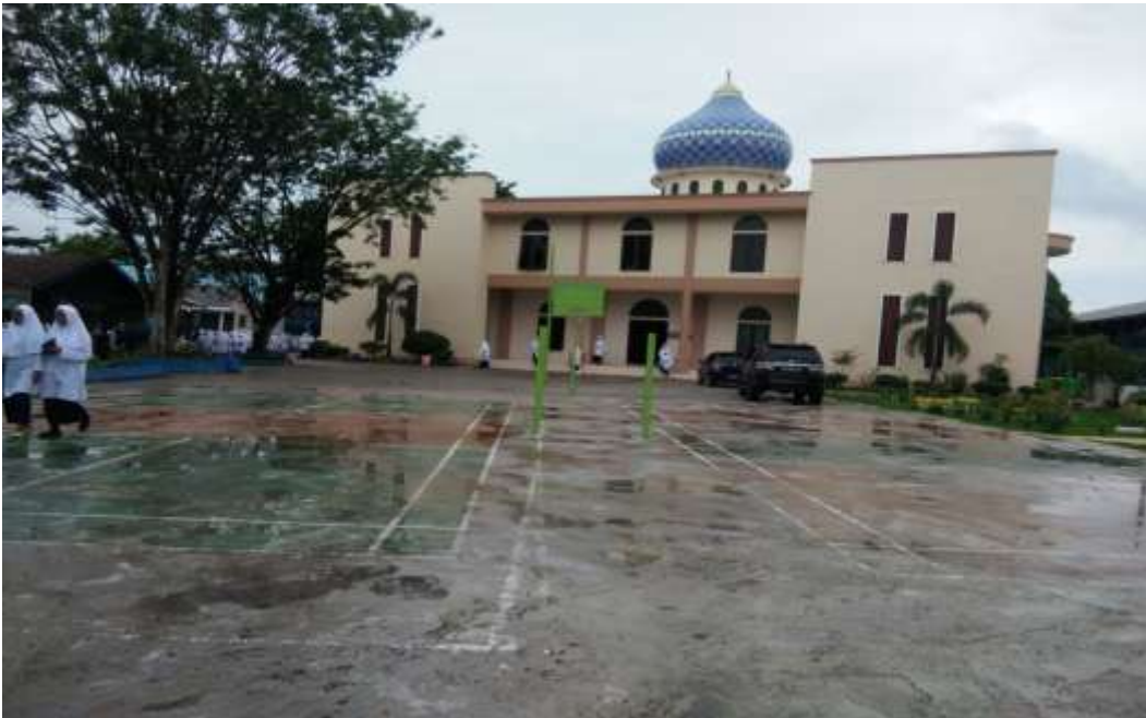
مصلى معهد الفلاح للبنات