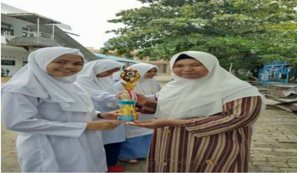
بطلة في عملية المحاضرة