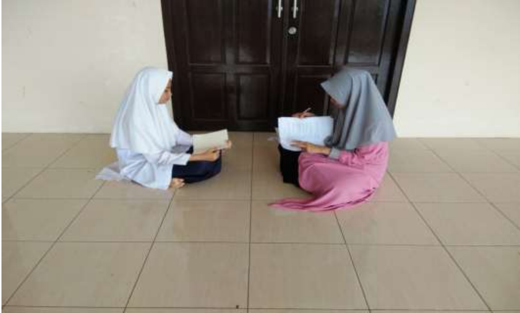
المقابلة مع معلمة نور إسبة دينة