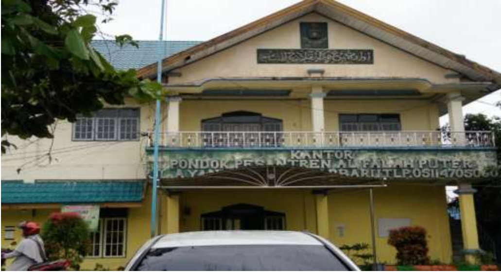
مكتب معهد الفلاح للبنات