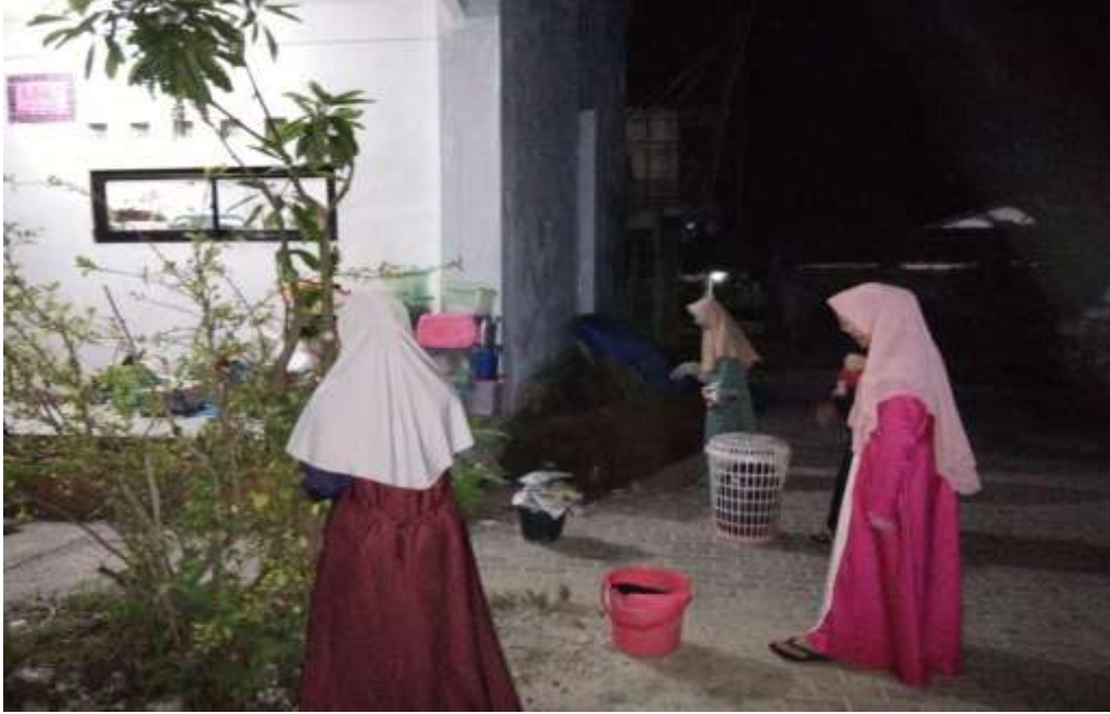
تنفيذ تعليم في مادة المحادثة (طريقة مجنونة)