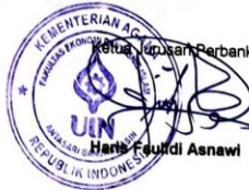
Herta Fauzidi Asnawi

Catatan: Diharap pelaksanaan seminar tepat waktu untuk menghindari tertundanya seminar-seminar berikutnya.