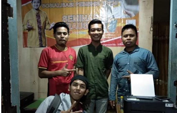
Setelah Wawancara Informan, Oktober 2018