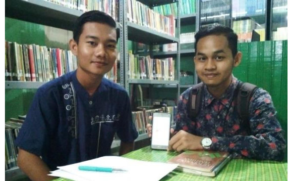
Setelah Wawancara Informan, Desember 2018