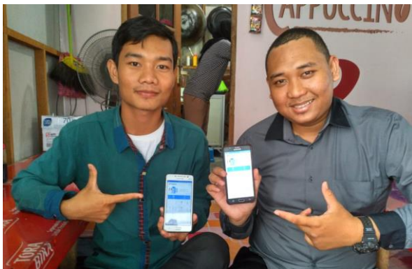
Setelah Wawancara Informan, Desember 2018