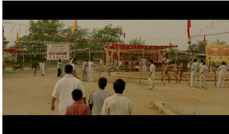
Gambar 21 adegan lapangan gulat yang sepi