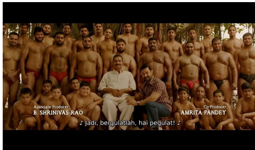
Gambar 22 tampilan para pegulat