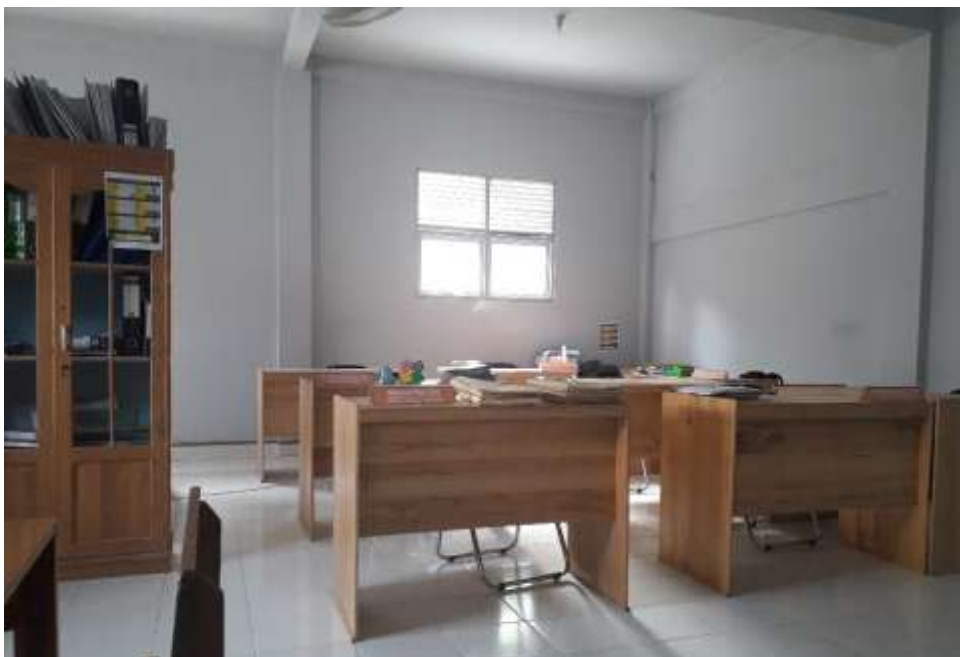
Kantor Dewan Guru MTs Daarul Ihsan