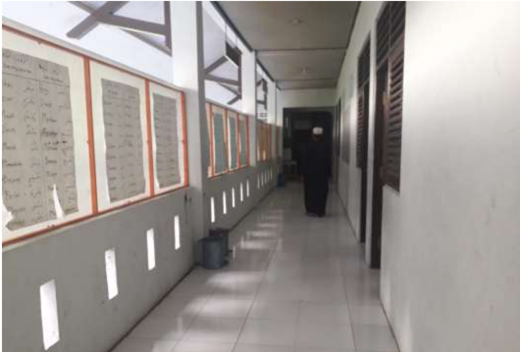
Asrama Santri MTs Daarul Ihsan