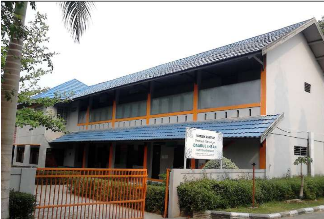
MTs Daarul Ihsan Islamic Boarding School Banjarbaru