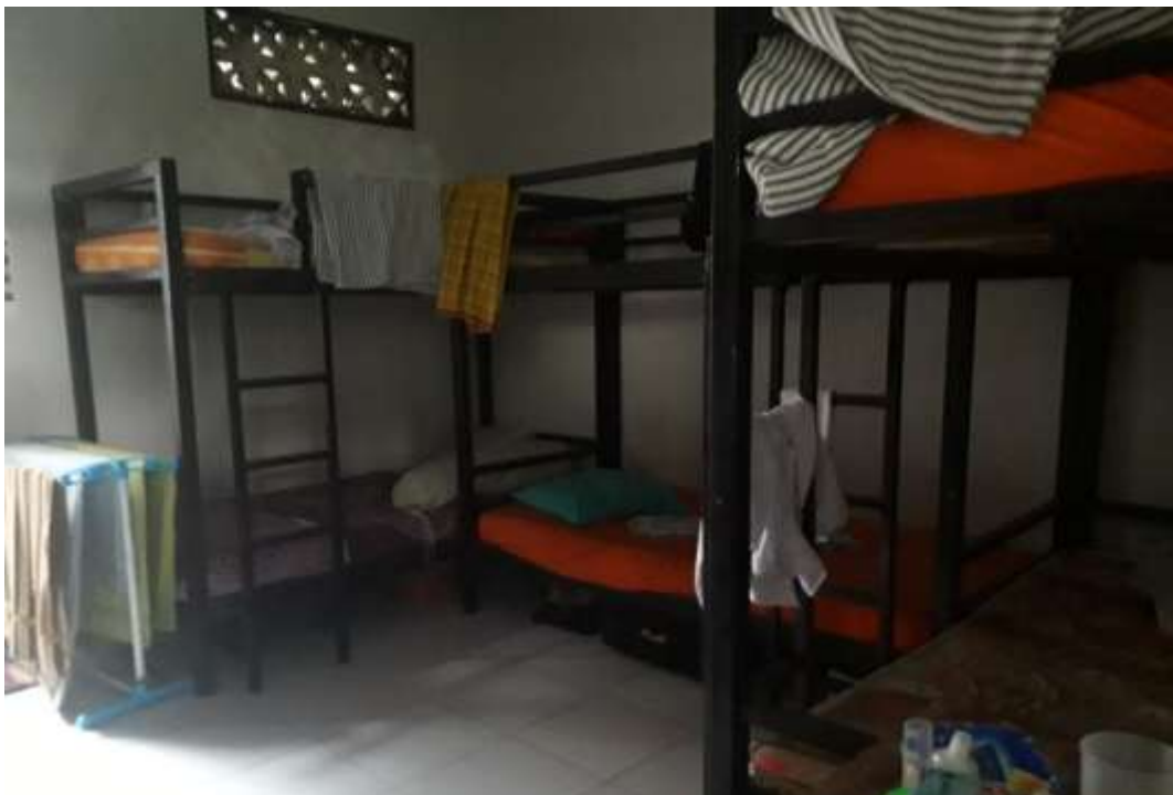
Kamar Tidur Santri