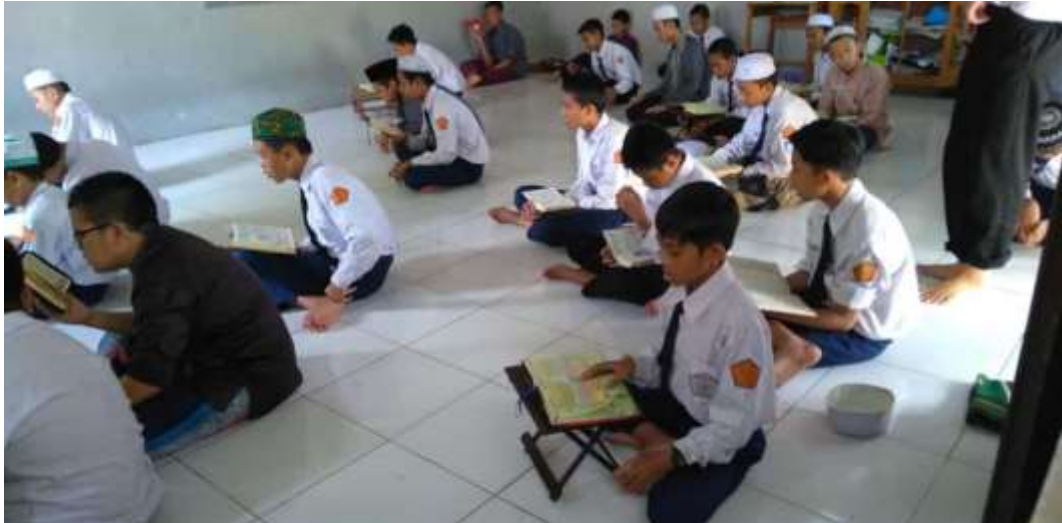
Muraja'ah Hafalan Sebelum Melaksanakan Ujian Akhir Sekolah (UAS)