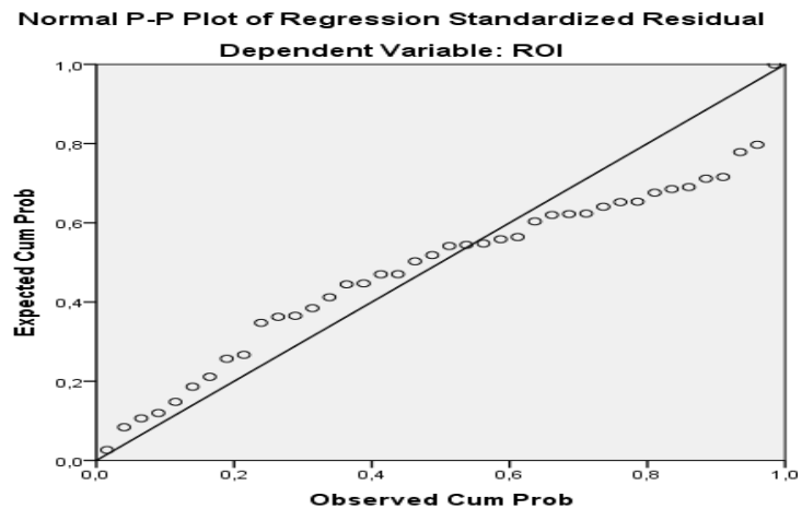
Gambar 4.2 Normal Probability Plot Antara Net Profit Margin dan Total Asset Turnover Terhadap Return On Investment

Berdasarkan hasil normalitas P-P Plot pada gambar diatas, residual penyebaran data belum terlalu berbentuk garis normal (garis lurus).