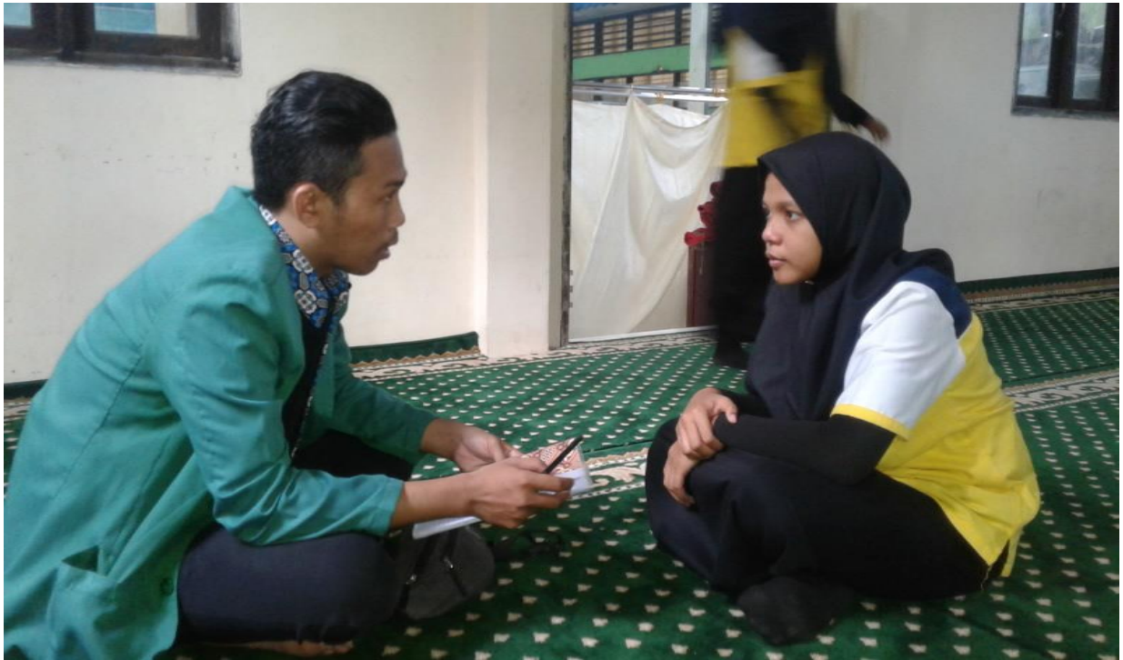
Wawancara dengan anak berkebutuhan khusus kelas X Multimedia A