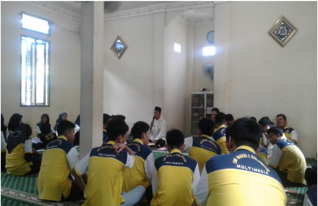
Kegiatan Pembelajaran Di Mushalla