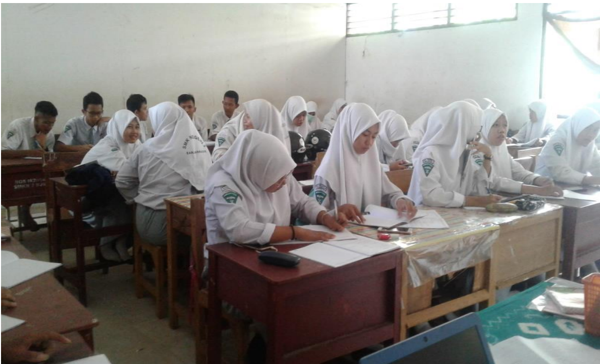
kegiatan pembelajaran di Kelas X Pekerjaan Sosial C