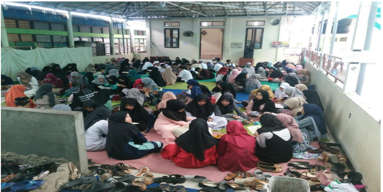
Kegiatan Pesantren Ramadhan 2019 Di Mushalla