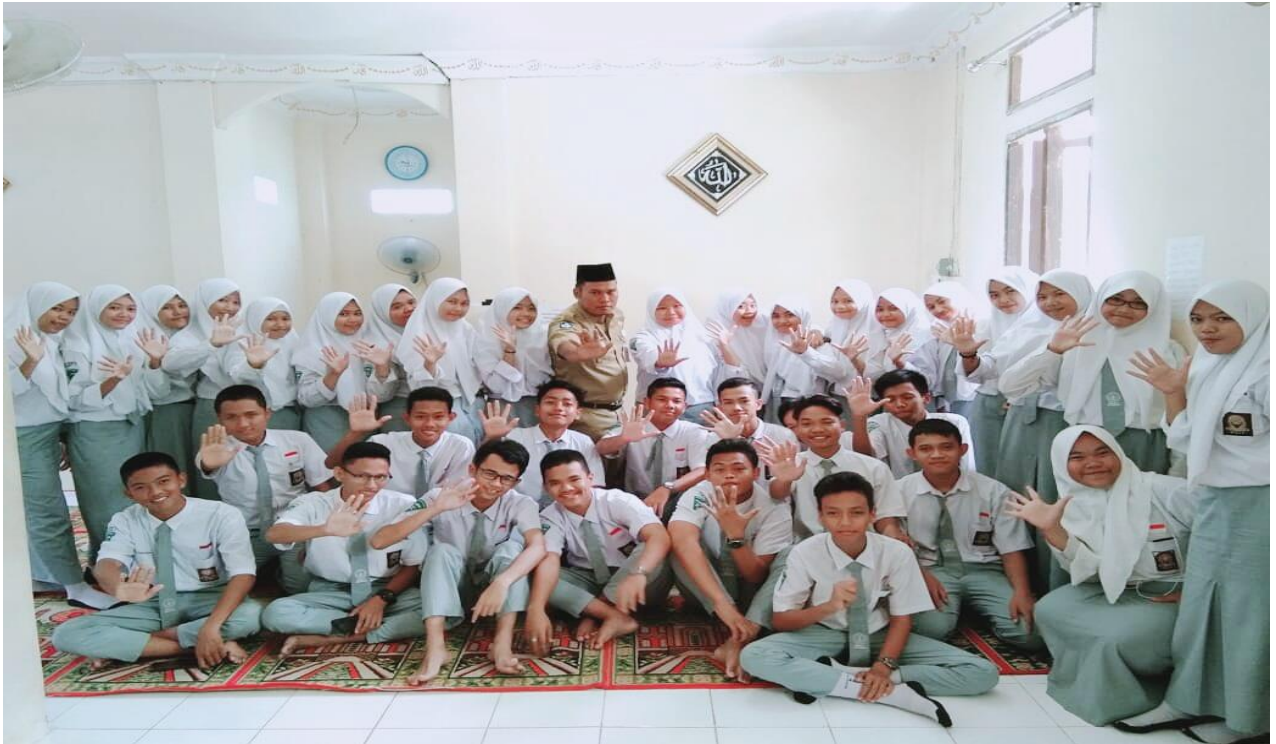
Foto Bersama Kelas Pelayanan Sosial C Dengan Guru Pendidikan Agama Islam Setelah Pembelajaran