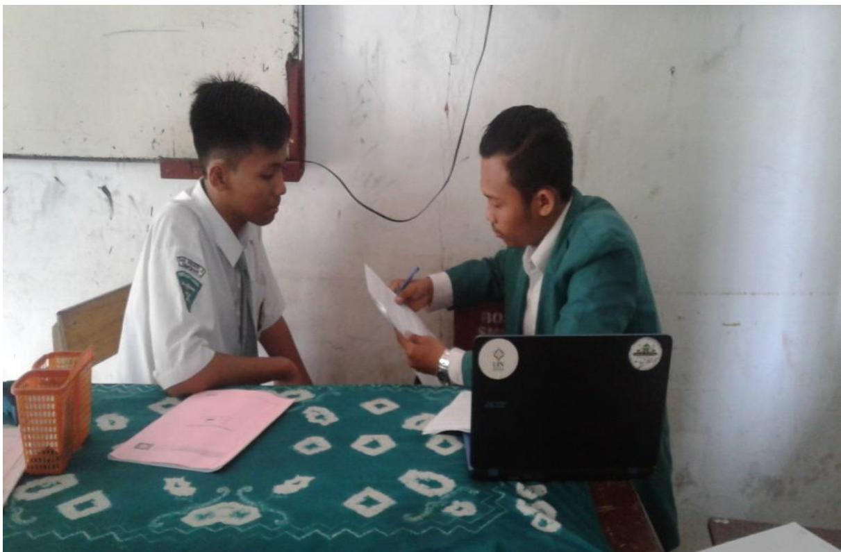
Wawancara dengan anak berkebutuhan khusus kelas X Pelayanan Sosial C