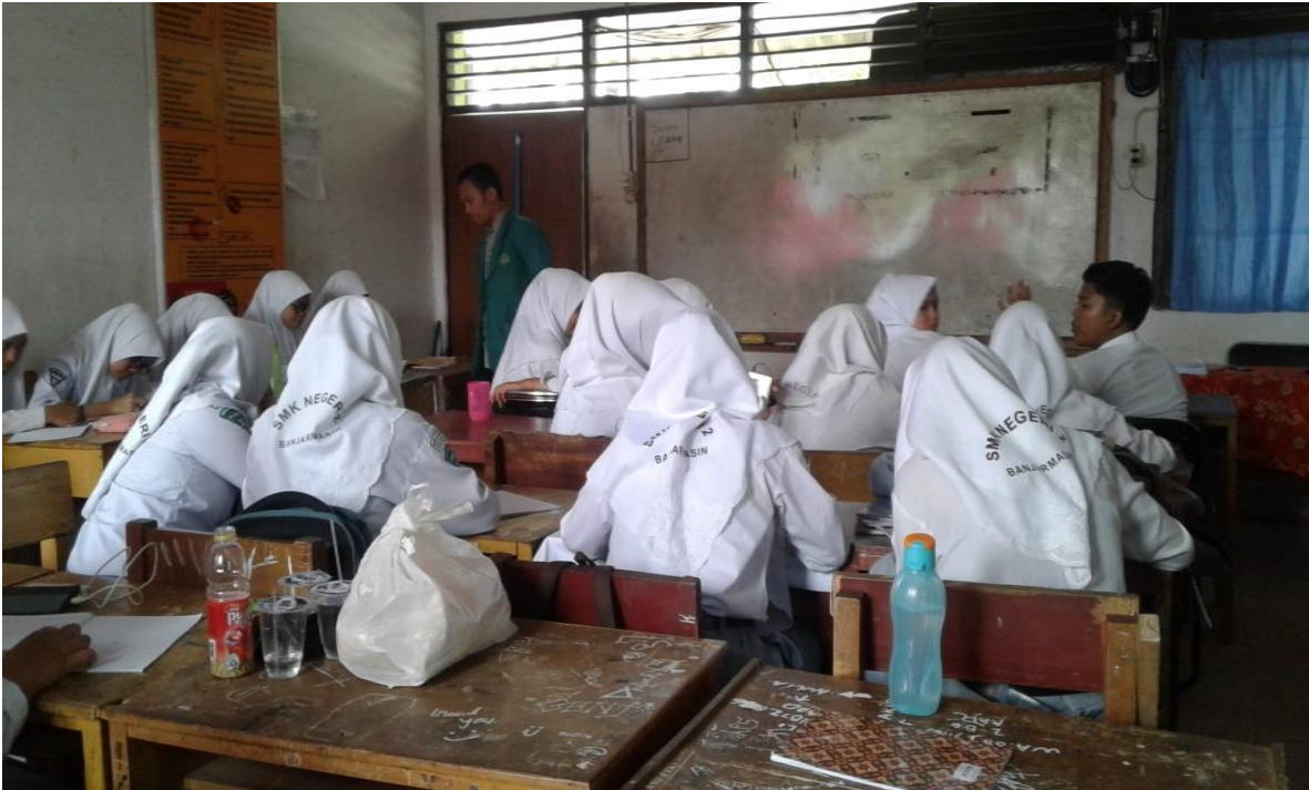
Kegiatan pembelajaran di Kelas X Pekerjaan Sosial A