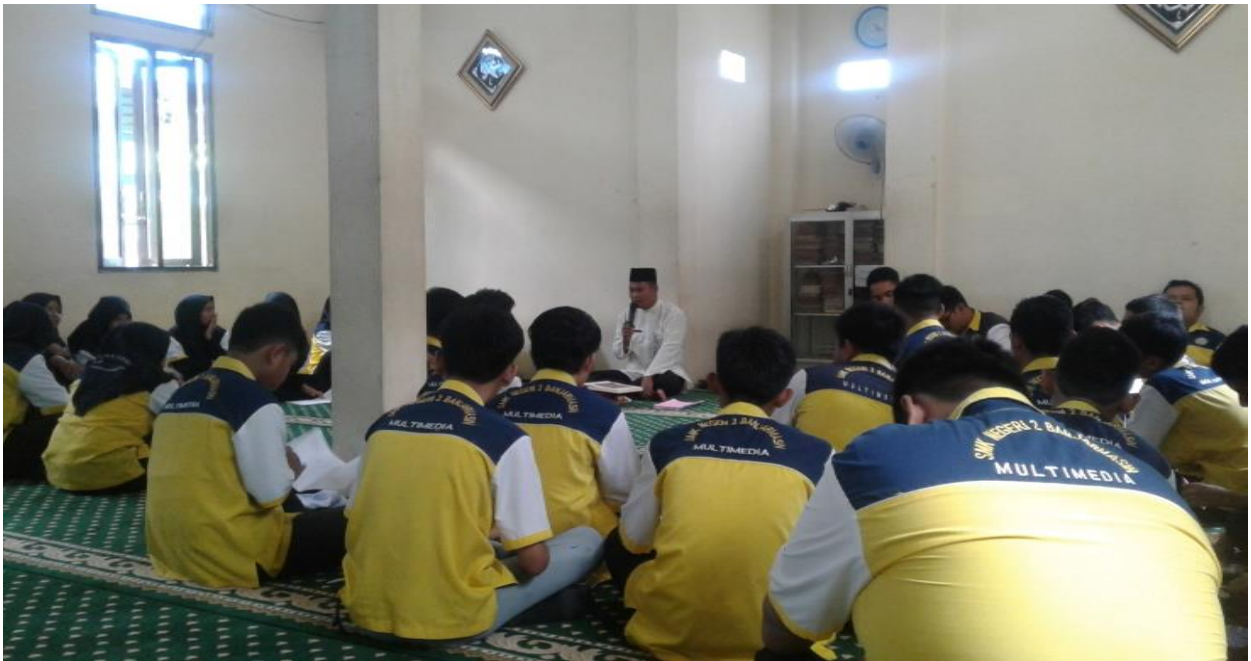
Kegiatan Pembelajaran Di Mushalla