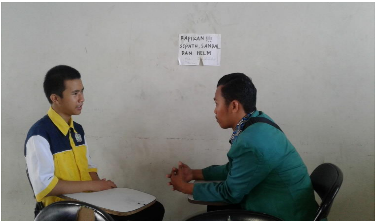
Wawancara dengan anak berkebutuhan khusus kelas X Multimedia A