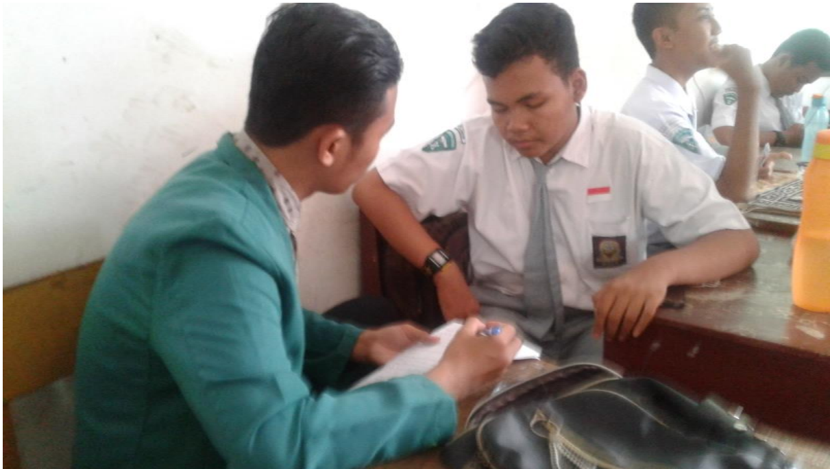
Wawancara dengan anak berkebutuhan khusus kelas X Pelayanan Sosial A