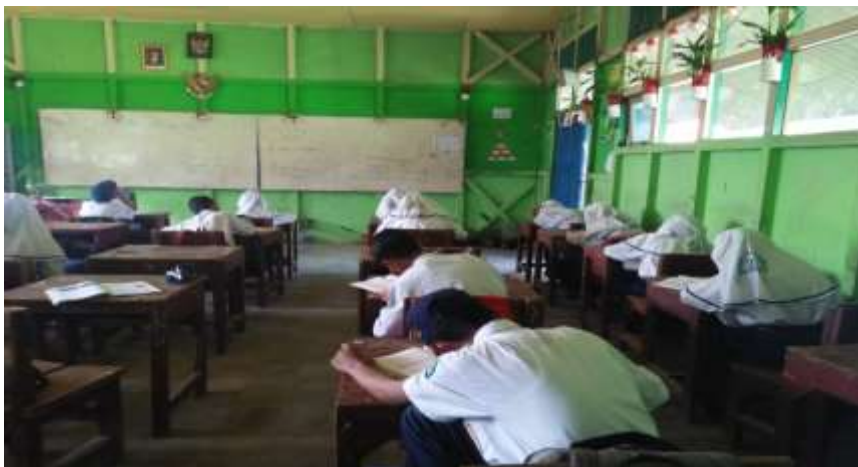
Gambar VI. Suasana saat pembelajaran berlangsung