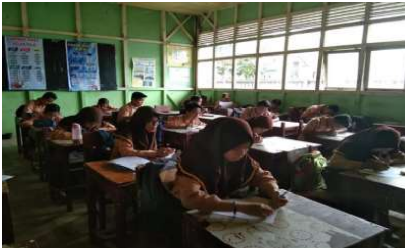
Gambar IX. Siswa sedang menjawab soal postes (Kontrol)