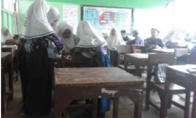
Gambar VIII. Siswa sedang menjawab soal postes (Kelas Eksprimen)