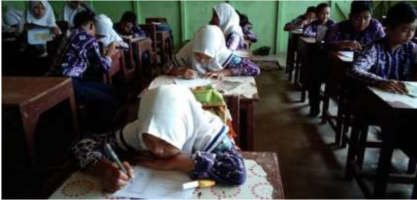
Gambar V. Siswa sedang menjawab soal instrumen berupa angket (Kelas Kontrol)