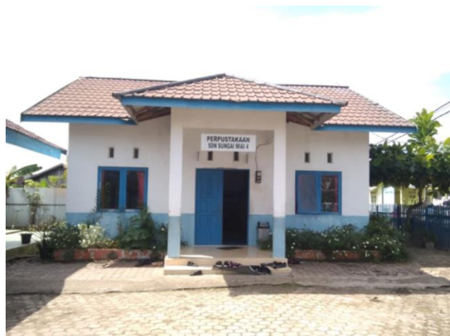
Gambar 2.1 Perpustakaan SDN Sungai Miai 4 Banjarmasin

Perpustakaan SDN Sungai Miai 4 Banjarmasin terletak di Jalan Antasari Kecil Timur Dalam RT. 20 di SDN Sungai Miai Banjarmasin, Ibu Hj. Nurul Ilmiah, S.pd adalah kepala sekolah dari SDN Sungai Miai 4 Banjarmasin sekaligus penanggungjawab dari Perpustakaan SDN Sungai Miai 4 Banjarmasin dan Bapak Candra Kusuma, A. Ma adalah pengelola perpustakaan SDN Sungai Miai 4 Banjarmasin Sejak tahun 2014 hingga sekarang. Letak perpustakaan SDN Sungai Miai 4 Banjarmasin berbentuk segiempat dengan panjang sekitar 8 meter dan lebar 8 meter, dengan batas lingkungan bagian utara berbatasan dengan lapangan sekolah dan parkir sepeda motor guru, bagian timur berbatasan dengan ruang kelas dan kantor guru, dan bagian barat berbatasan dengan parkir sepeda siswa SDN Sungai Miai Banjarmasin.