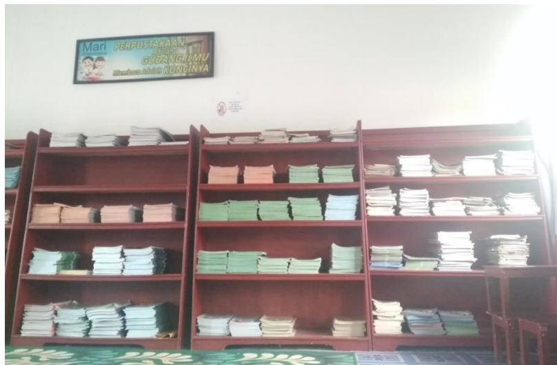
Gambae 2.3 Rak koleksi buku pelajaran

Dikarenakan keadaan rak yang memberikan jarak antar raknya tidak sesuai dengan tinggi buku, buku-buku di Perpustakaan ini kebanyakan ditata di rak dengan posisi mendatar. Dan total rak yang ada di Perpustakaan SDN Sungai Miai 4 Banjarmasin adalah delapan rak dengan pembagian empat rak digunakan untuk koleksi buku pembelajaran, satu rak untuk koleksi referensi dan agama islam, dan tiga rak berisi buku fiksi/buku cerita.