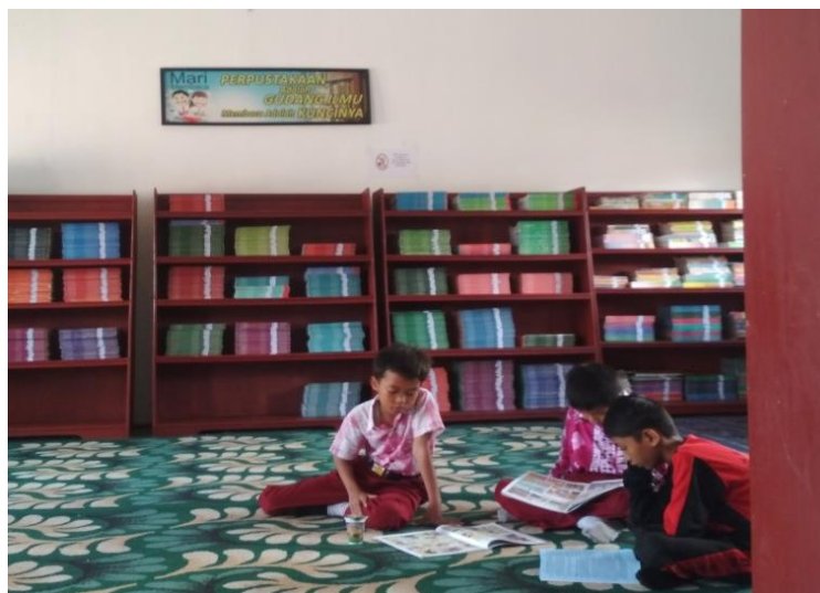
Gambar 2.4 Layanan Baca

Di Perpustakaan SDN Sungai Miai 4 Banjarmasin ini terdapat beberapa meja kecil yang disediakan bagi siswa yang ingin membaca buku dengan berumpu pada meja. Namun ada pula yang tidak menggunakan meja. Setiap kunjungan di perpustakaan, siswa dianjurkan mengisi buku daftar pengunjung. Setiap harinya, juga ada jadwal kunjungan ke perpustakaan bergiliran setiap kelas yang diatur oleh guru kelas di sdn Sungai Miai 4 Banjarmasin.