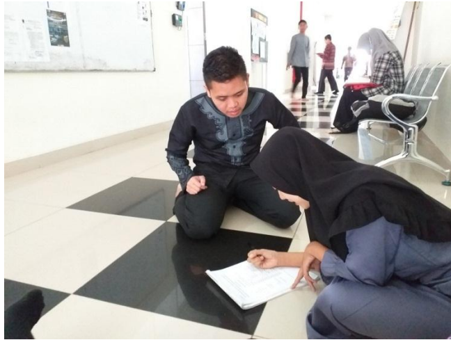
Sumber: Hasil Penelitian, 2019 (Menyebarkan Angket)