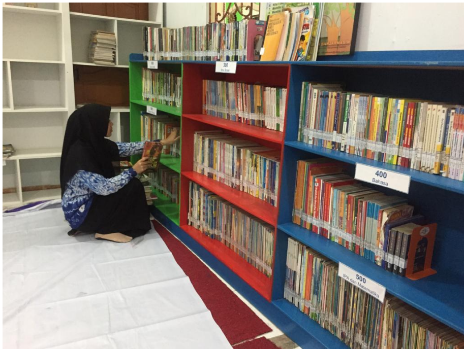
Kegiatan shelving bahan koleksi perpustakaan SDIT Ukuwah Banjarmasin