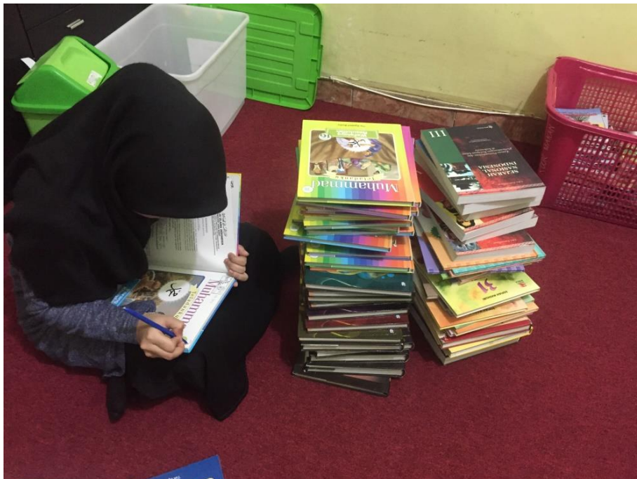
Kegiatan mengklasifikasi pada buku yang baru