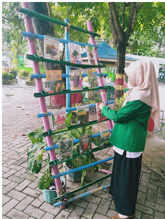
Meletakkan buku ke bambu baca