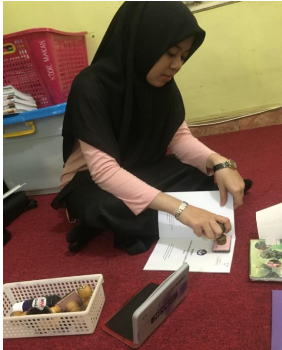
Kegiatan pemberian stempel kepemilikan perpustakaan SDIT Ukuwah