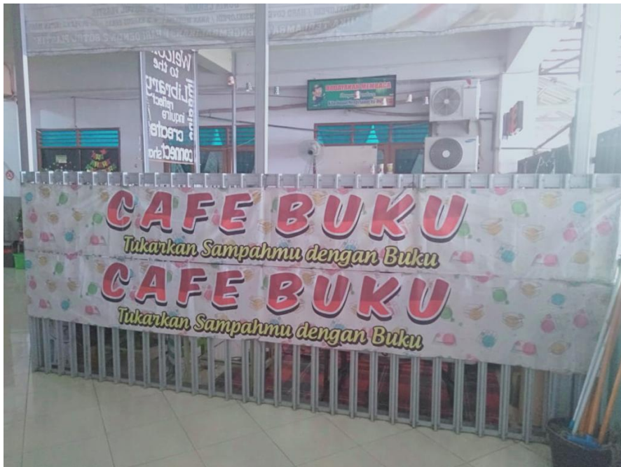
Cafe buku perpustakaan SDIT Ukhuwah Banjarmasin