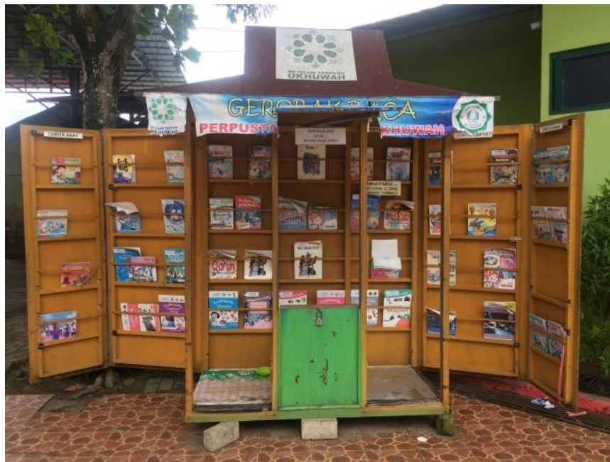
Gerobak baca perpustakaan SDIT Ukhuwah Banjarmasin