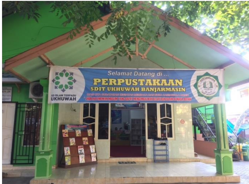
Gedung dan pintu masuk perpustakaan SDIT Ukhuwah Banjarmasin