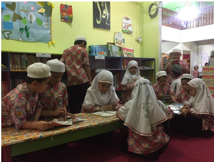
Kegiatan siswa/i membaca di perpustakaan SDIT Ukhuwah Banjarmasin