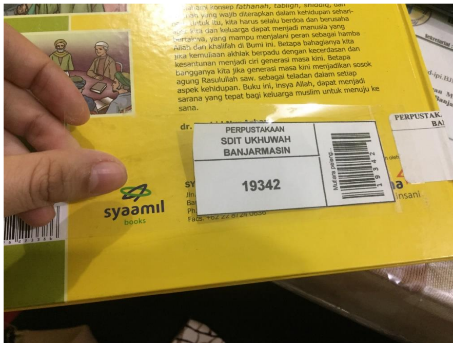
Kegiatan penempelan barcode pada buku