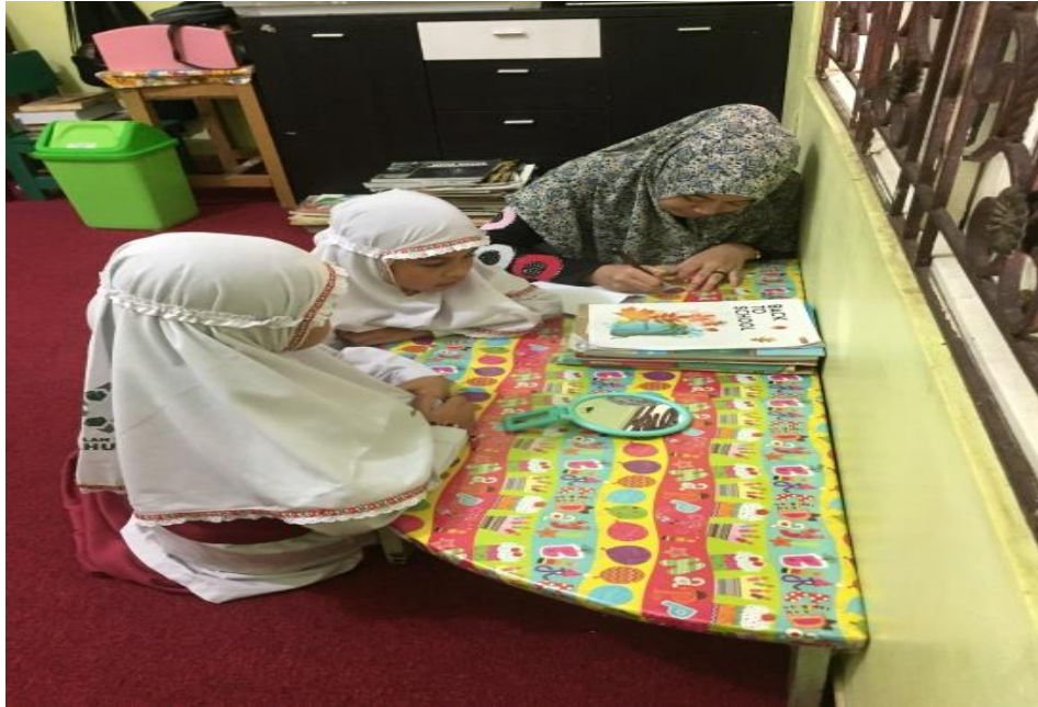
Wawancara bersama siswa SDIT Ukuwah Banjarmasin