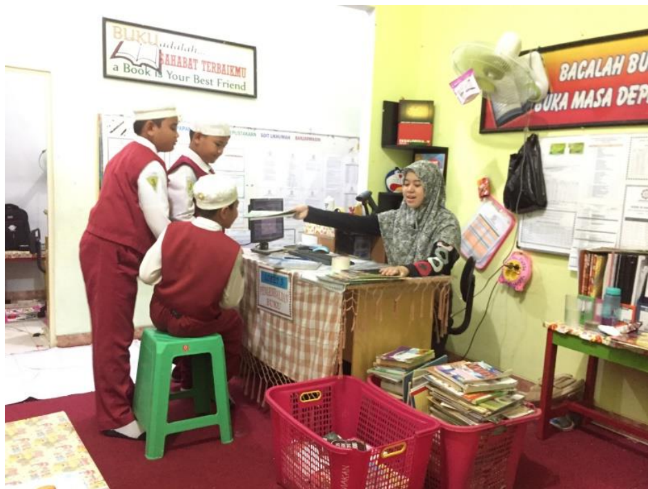
melayani pengembalian buku di perpustakaan SDIT Ukhuwah Banjarmasin