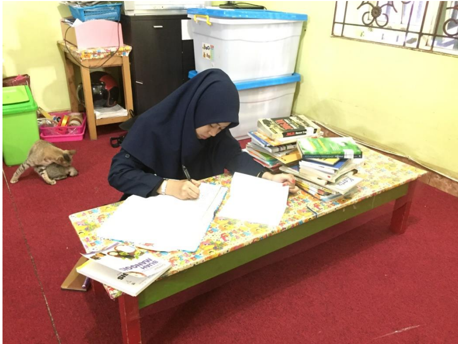
Kegiatan menginventaris jenis koleksi referensi dan umum