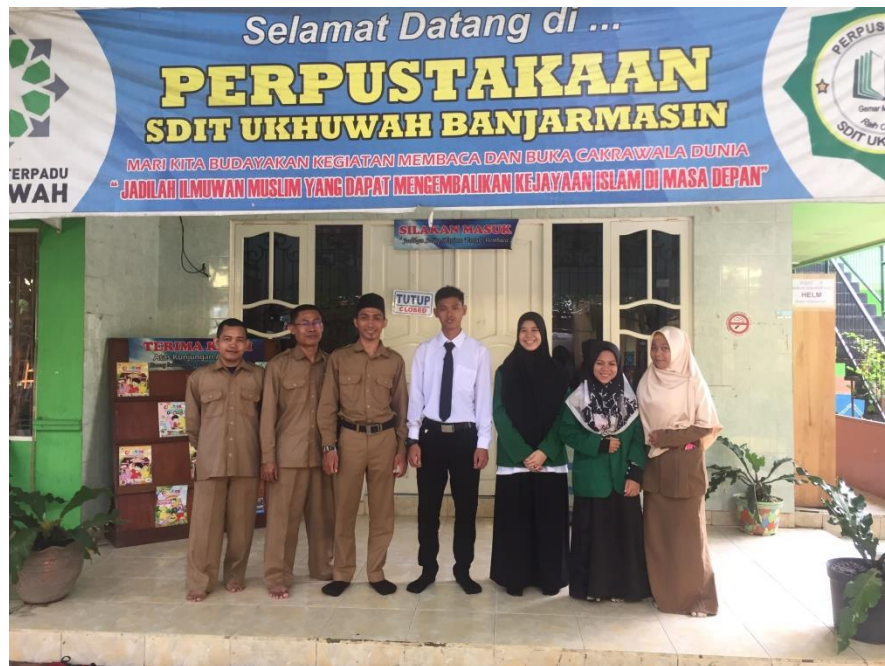
Foto bersama kepala perpustakaan dan pengelola perpustakaan