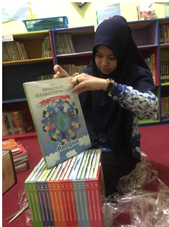
Kegiatan pelepasan sampul plastik pada buku yang baru datang