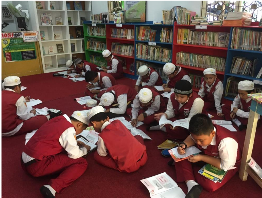
Kegiatan belajar di perpustakaan dengan memanfaatkan koleksi disana