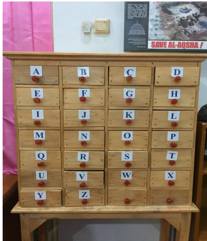
Lemari katalog perpustakaan SDIT Ukhuwah Banjarmasin