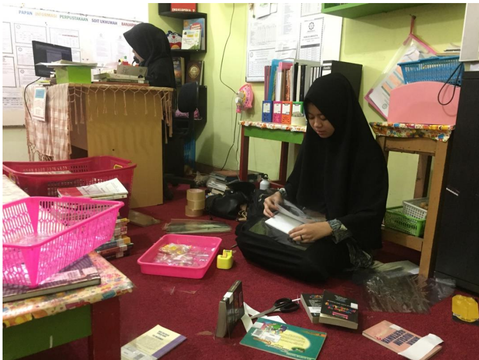
Kegiatan menyampul buku yang baru sebelum dilayankan