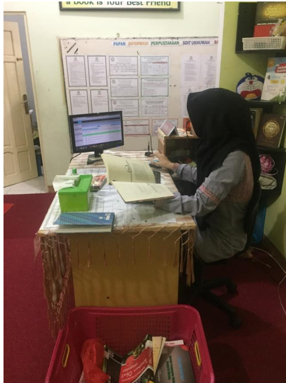
Kegiatan menginput data jenis koleksi umum dan referensi