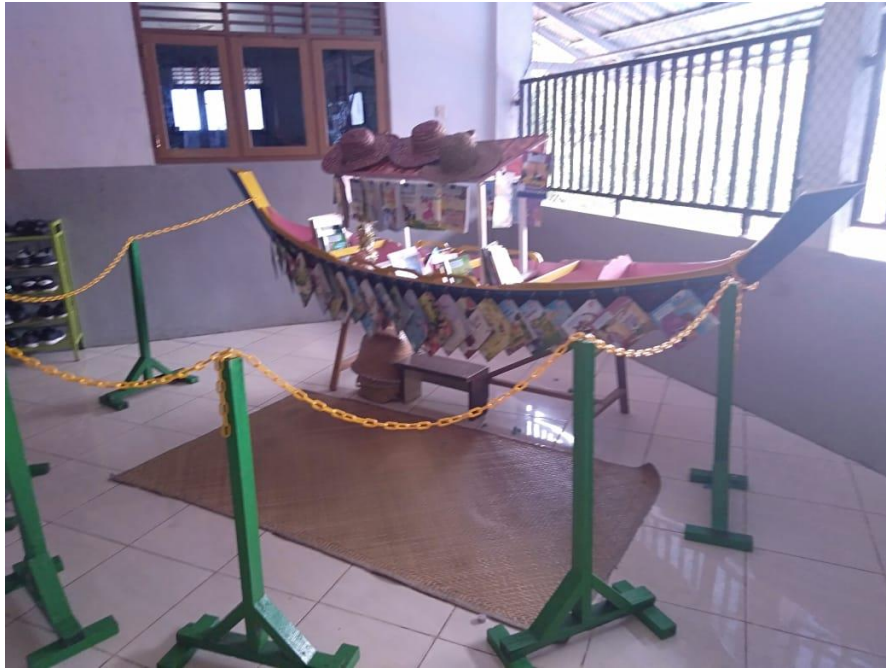
Jukung baca perpustakaan SDIT Ukhuwah Banjarmasin