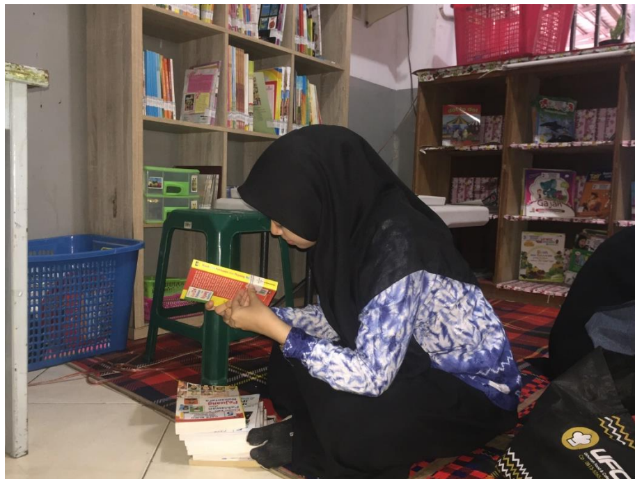
Kegiatan pemasangan call number pada punggung buku