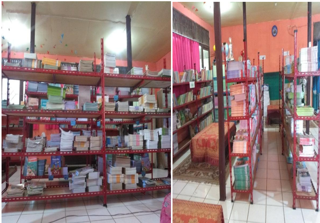
Kondisi Rak Koleksi Sirkulasi