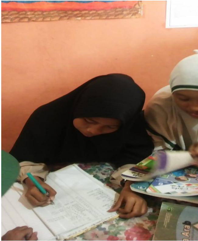
Kegiatan Layanan Peminjaman Dan Pengembalian