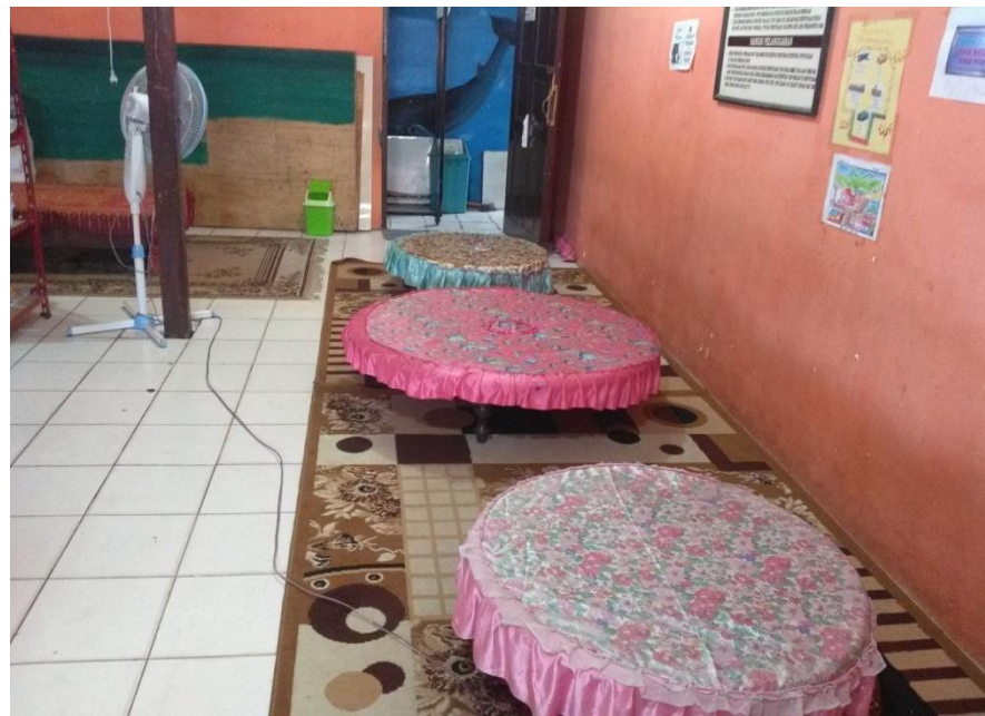
Meja Bundar Untuk Siswa-Siswi Membaca