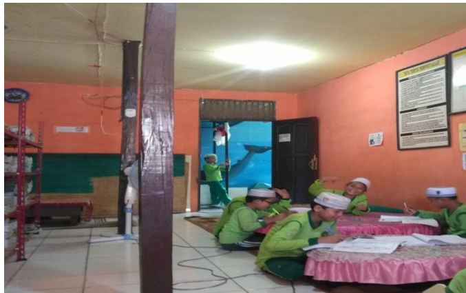
Kegiatan Saat Siswa-Siswi Mengerjakan Tugas di Perpustakaan