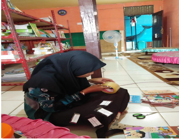
Kegiatan Pelebelan Punggung Buku