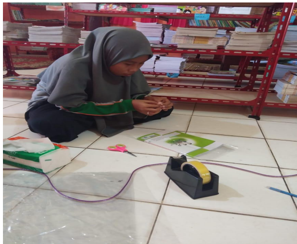
Kegiatan Penyampulan Buku