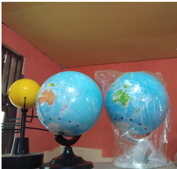
Koleksi Referensi Seri Monograf Perpustakaan Min 4 Banjar