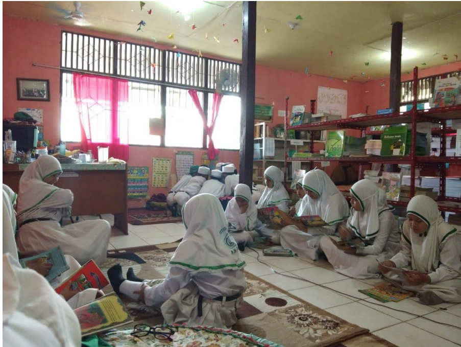
Kegiatan Saat Jadwal Membaca Bagi Siswa-Siswi