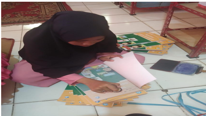
Kegiatan Pemberian Stempel Inventaris