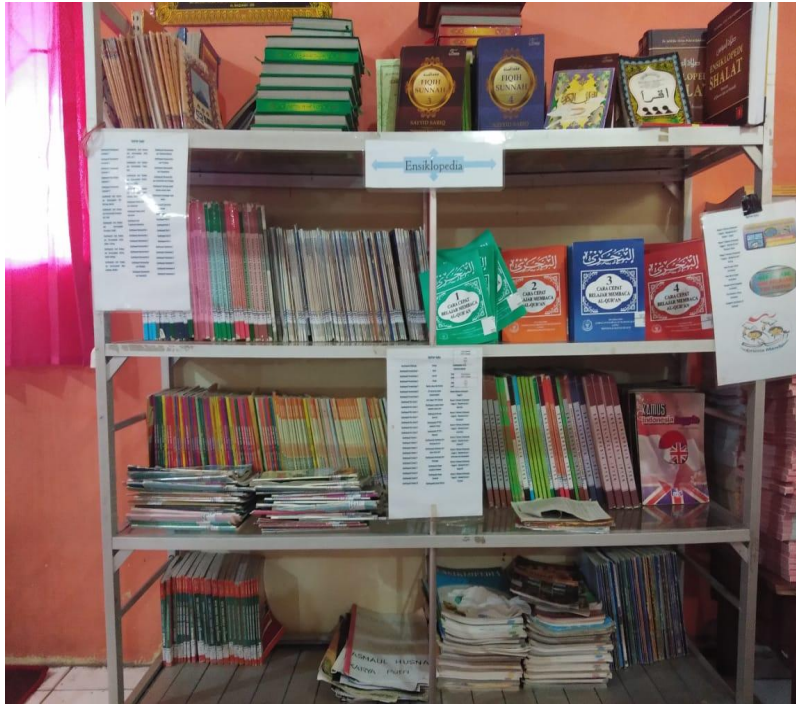
Kondisi Rak Koleksi Referensi