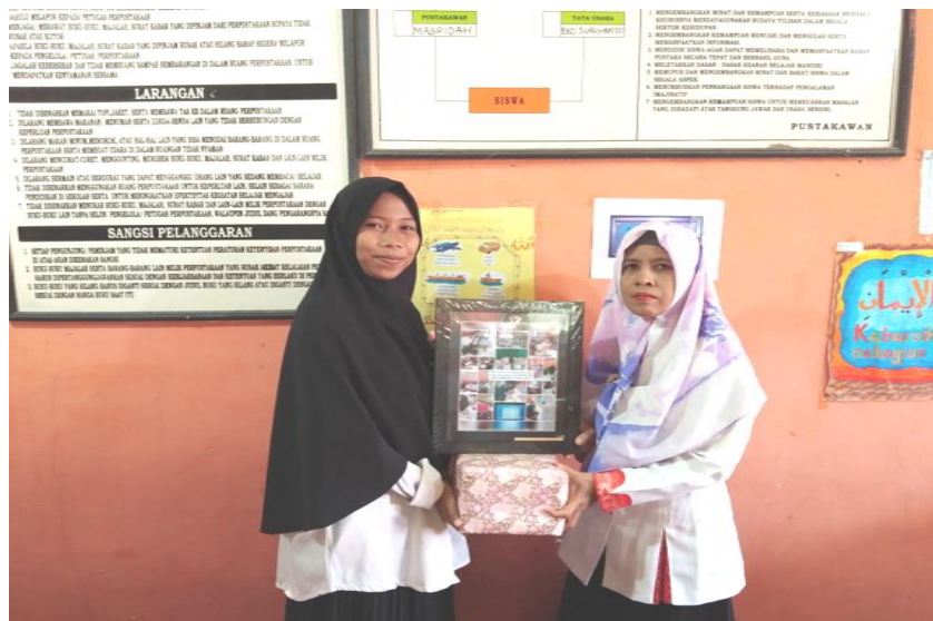
Foto Bersama Pengelola Perpustakaan Serta Pemberian Kenang-Kenangan