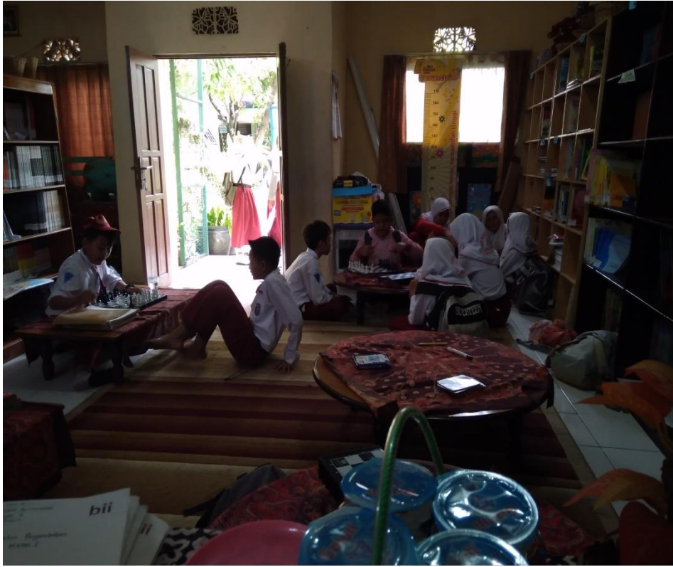
Koleksi Bahan Pustaka