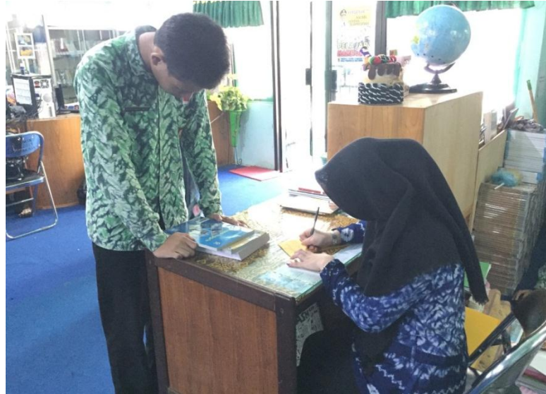
Kegiatan peminjaman buku oleh siswa di meja layanan sirkulasi