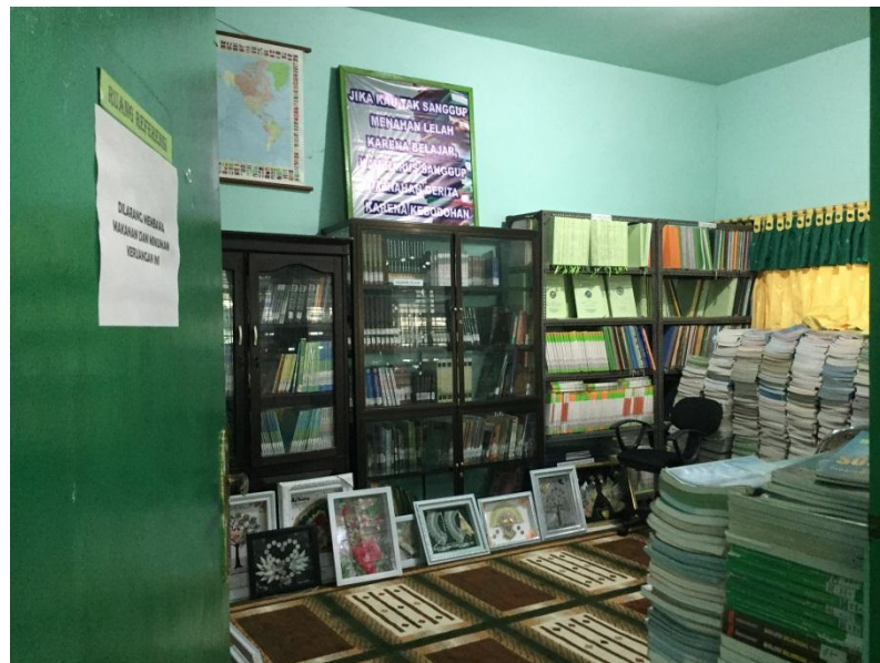
Ruang layanan referensi berisi koleksi referensi yang salah satunya yaitu hasil Karya Tulis Ilmiah oleh siswa-siswi kelas XII sebagai salah satu syarat mereka untuk mengikuti Ujian Nasional.