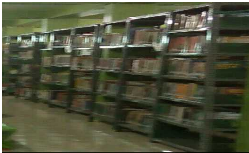
Gambar 4.4 Foto Rak Koleksi Perpustakaan Fakultas Tarbiyah dan Keguruan UIN Antasari Banjarmasin

Dalam kaitan dengan penataan ruangan, keamanan bahan pustaka bisa dikelompokkan dalam dua bagian. Pertama faktor keamanan bahan pustaka akibat kerusakan secara ilmiah dan kedua faktor kerusakan akibat manusia (Darmono, 2001:202).