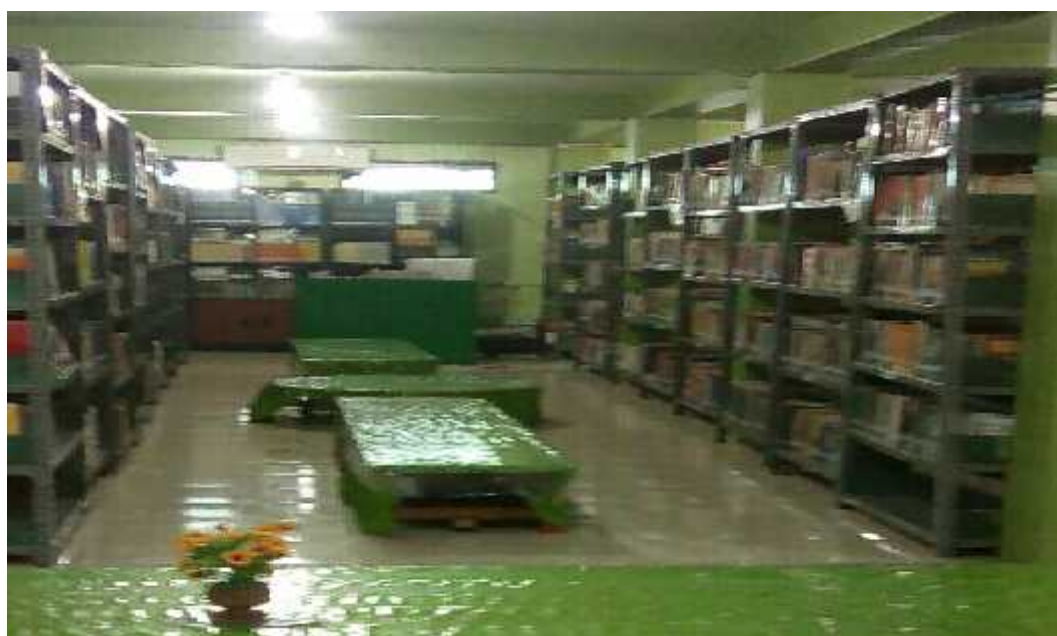
Gambar 4.2 Foto Tata Baur di Perpustakaan Fakultas Tarbiyah dan Keguruan UIN Antasari Banjarmasin

Dalam sistem ini penempatan koleksi dicampur dengan meja bacaan agar pembaca lebih mudah mengambil dan mengembalikan koleksi sendiri (Rahayu Ningsih, 1990:22). Berdasarkan pengamatan secara langsung perpustakaan Fakultas Tarbiyah dan Keguruan UIN Antasari Bajarmasin penempatan koleksi dicampur dengan meja baca pengunjung. Pada sistem tata baur di peprustakaan