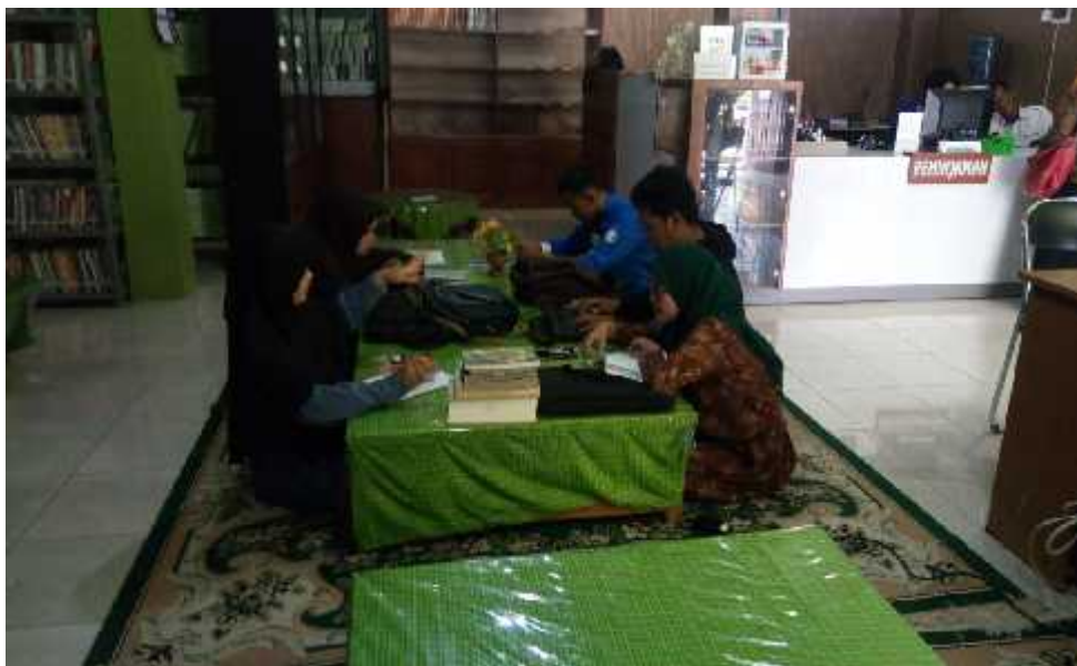
Gambar 4.3 Foto Meja Baca Perpustakaan Fakultas Tarbiyah dan Keguruan UIN Antasari Banjarmasin

Berdasarkan pengamatan penataan ruangan perpustakaan perpustakaan Fakultas Tarbiyah dan Keguruan UIN Antasari Banjarmasin sudah cukup memenuhi konsep yaitu menarik, bersih dan tertata dengan rapi. Salah satunya dengan penataan bunga-bunga hias pada meja baca, meja sirkulasi maupun disamping rak bahan koleksi di perpustakaan. Namun jika ada hiasan dinding atau lukisan akan lebih menarik pengunjung perpustakaan untuk datang ke perpustakaan.