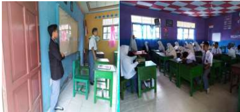
Gambar 5 Kegiatan Muhadharah Mingguan Kelas X a dan X b