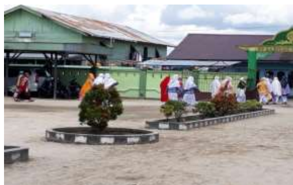
Gambar 15. Siswi Madrasah Aliyah Sabilal Muhtadin Selesai Melaksanakan Kegiatan