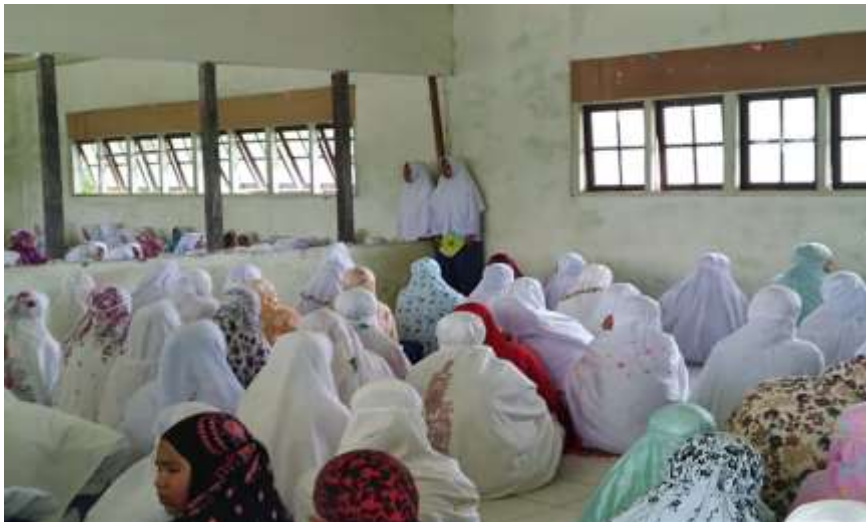
Gambar 4 Kegiatan Muhadharah Putri Madrasah Aliyah Sabilal Muhtadin