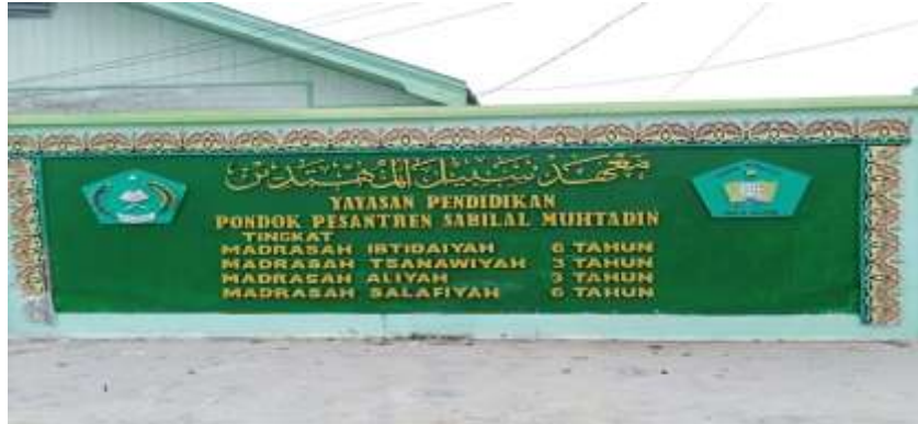
Gambar 13. Dinding gerbang sekolah Madrasah Aliyah Sabilal Muhtadin