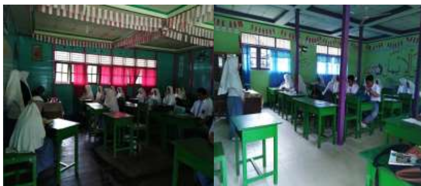
Gambar 7 Kegiatan Muhadharah Mingguan Kelas XII a dan XII b