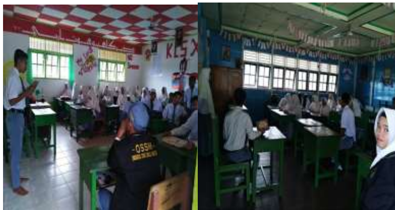
Gambar 6 Kegiatan Muhadharah Mingguan Kelas XI a dan XI b