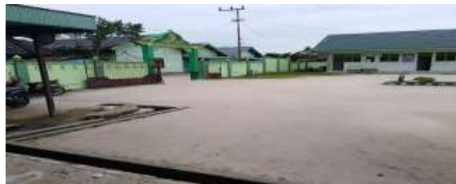
Gambar 14. Gerbang Sekolah Madrasah Aliyah Sabilal Muhtadin