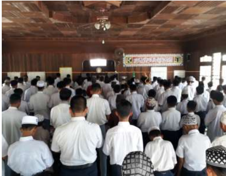
Gambar 1 Kegiatan Salat Zuhur Berjamaah Putra Madrasah Aliyah Sabilal Muhtadin