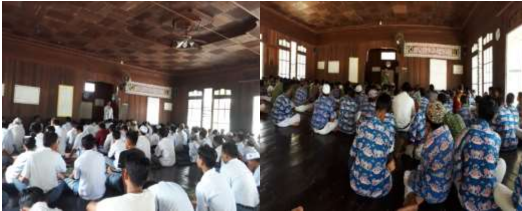
Gambar 3 Kegiatan Muhadharah Putra Madrasah Aliyah Sabilal Muhtadin