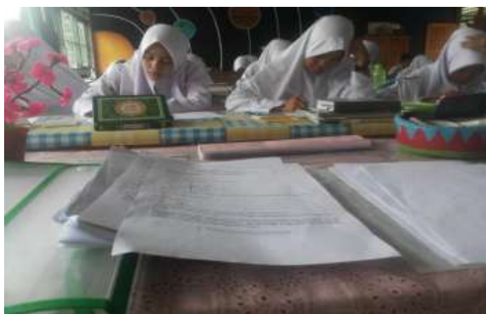
Gambar IX. Suasana siswa di kelas eksperimen pada saat mengerjakan soal posttest

Suasana siswa di kelas ketika mengerjakan tes akhir ( posttest ) dapat dilihat pada gambar di bawah ini.