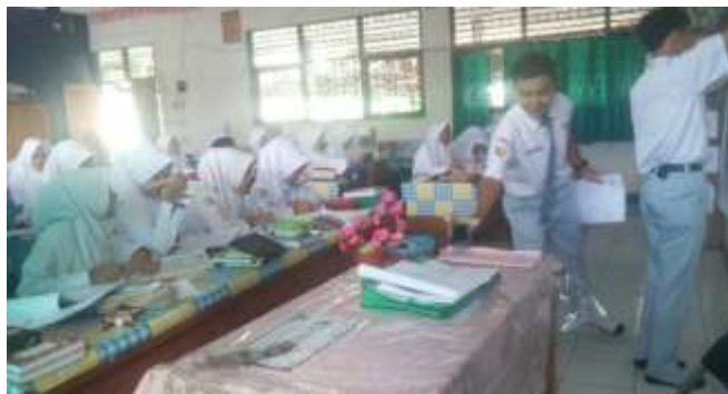
Gambar VII. Proses pembelajaran menggunakan model pembelajaran Self Motivated Learning (SML) pada saat diskusi bersama