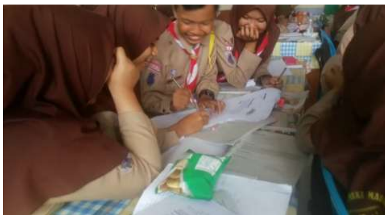
Gambar VIII. Suasana pembelajaran di kelas eksperimen pada saat diskusi perkelompok.

ke depan menuliskan sekaligus menjelaskan hasil diskusi mereka. Jadi, peran guru pada saat diskusi hanya sebatas penunjang. Pada saat mengerjakan dan menyampaikan hasil diskusi guru memberikan kebebasan kepada setiap kelompok dengan caranya masing-masing untuk berdiskusi bersama temannya. Guru juga memberikan kesempatan kepada setiap kelompok untuk menanyakan hal-hal yang belum dipahaminya kepada kelompok penyaji. Tujuan guru melakukan hal ini agar menumbuhkan motivasi belajar pada setiap individu siswa.