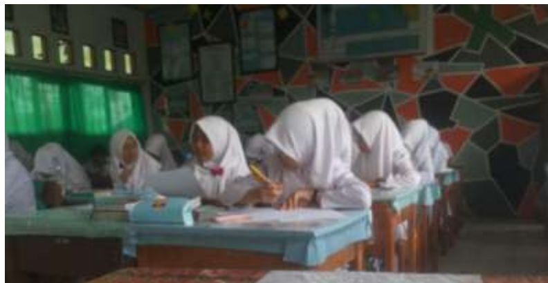
Gambar X. Proses pembelajaran di kelas kontrol