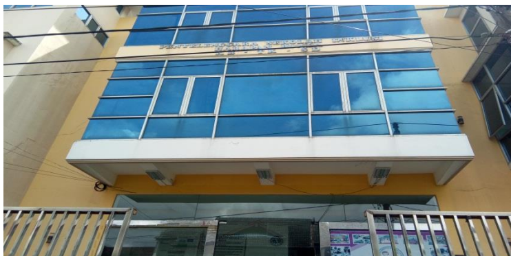
Gambar I. Gedung Sekolah SD Inklusif Harapan Bunda Banjarmasin

Dasar Inklusif Harapan Bunda mulai beroperasi pada tahun 2008/2009 yang mempunyai murid sebanyak 6 orang diantaranya 5 orang perempuan dan 1 orang laki-laki. Dalam penyelenggaraannya sekolah visi, misi, dan tujuan agar menghasilkan siswa-siswa yang bermutu dan berkualitas.