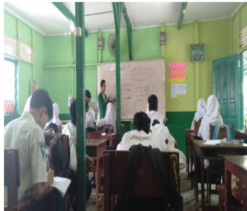
Interview with English Teacher in SMK Bina Banua Banjarmasin