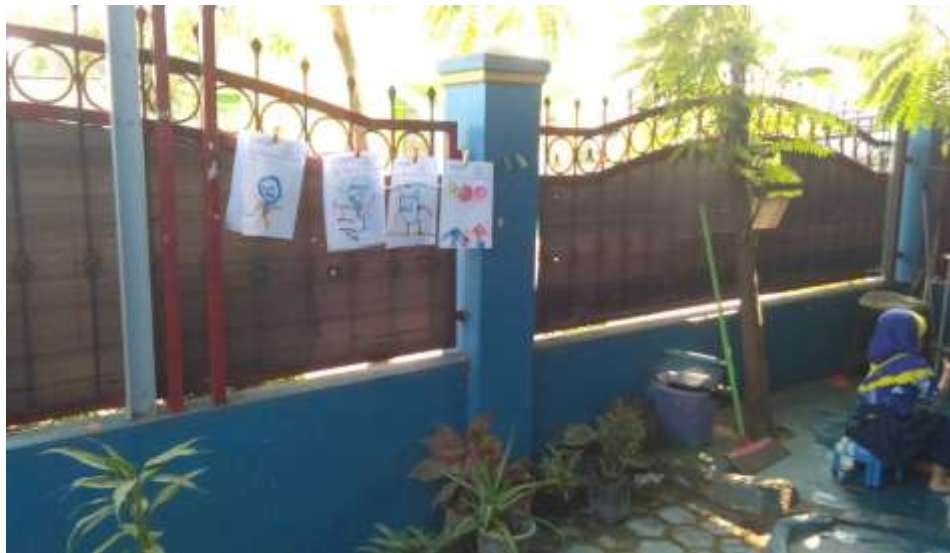
Gambar VI (CDF9) :

Setelah selesai guru mengambil hasil anak dan menggantungkannya di tempat yang sudah disediakan agar hasil anak cepat kering dan tidak tercoret-coret (CL4.P19).