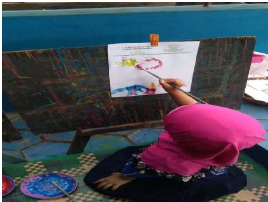
Gambar V (CDF8) : Anak sedang melukis gambar polisi dan rumah polisi

2. Selasa, 10 September 2019 pukul 09:00-10:00