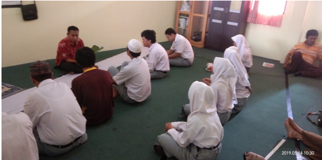
Gambar 6: Visi misi Sekolah SMALBS B/C Dharma Wanita Persatuan Provinsi Kalimantan Selatan