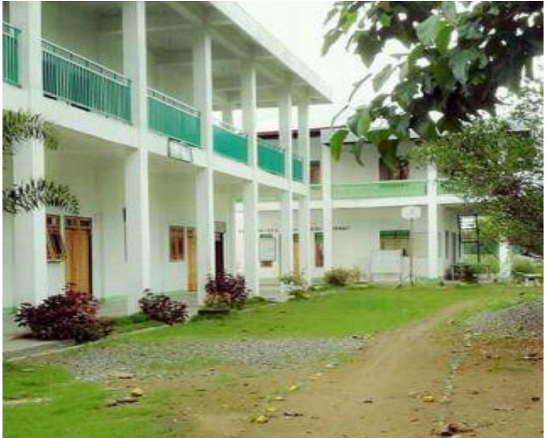
GAMBAR SEKOLAH MAS AL-HIKMAH TABUDARAT HILIR