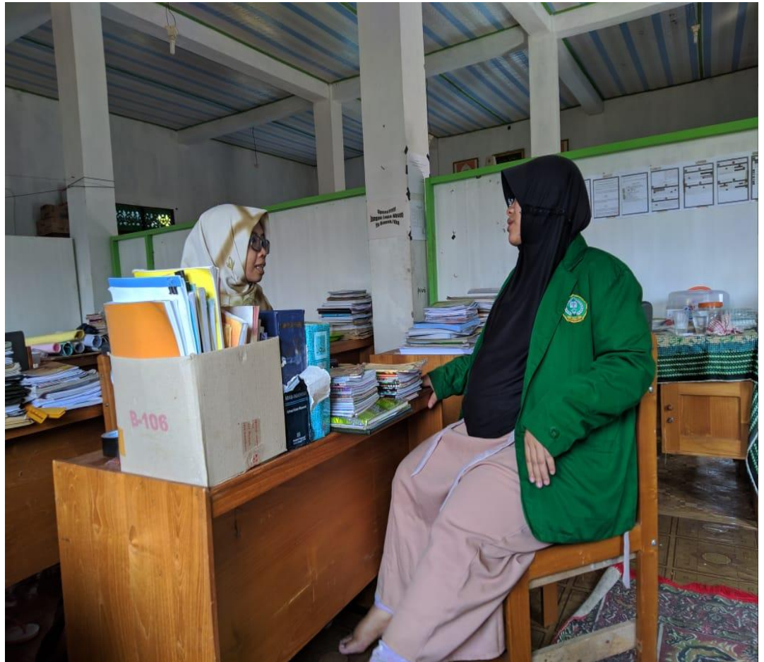
Wawancara dengan Guru Mata Pelajaran Bahasa Arab