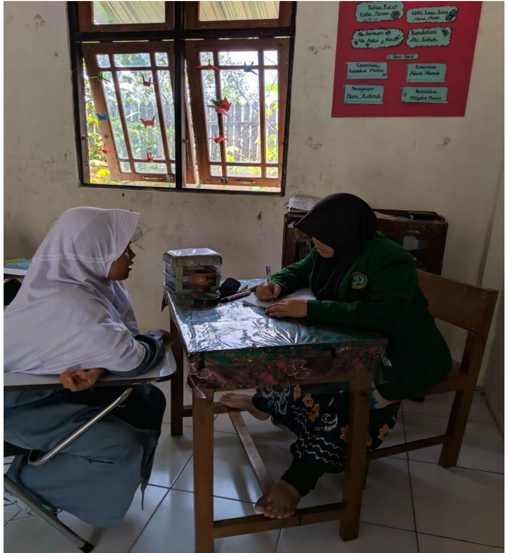
Wawancara dengan Siswa Kelas XI MAS Al-Hikmah Tabudarat Hilir