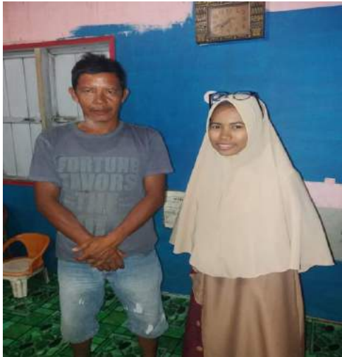
Foto dengan Ketua RT 04