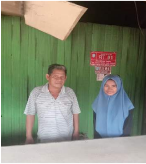
Foto dengan Ketua RT 01