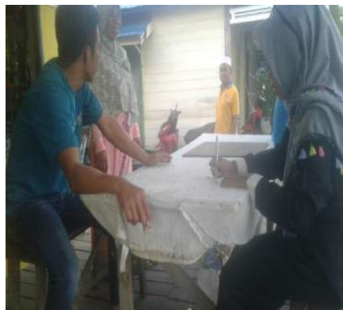
Foto dengan Ketua RT 11