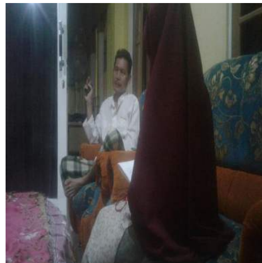
Foto dengan Bapak Kepala Desa