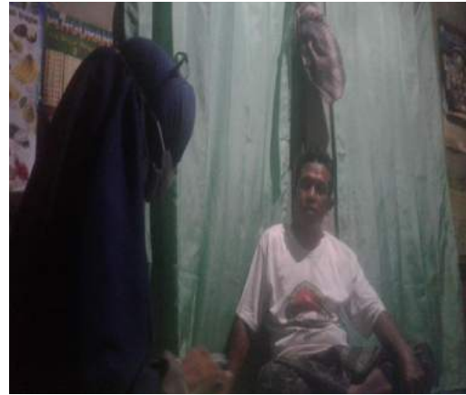
Foto dengan Ketua RT 09