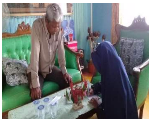
Foto dengan Ketua RT 03