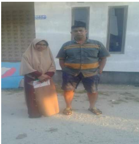
Foto dengan Ketua RT 10