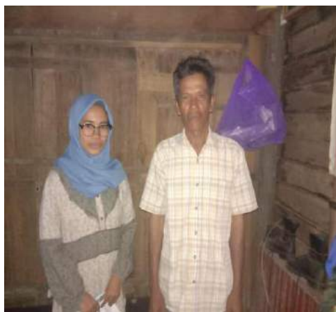
Foto dengan Ketua RT 02