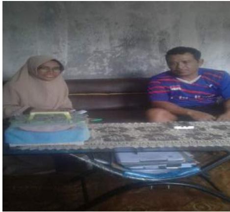
Foto dengan Ketua RT 12