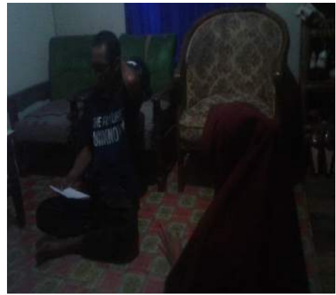
Foto dengan Ketua RT 13