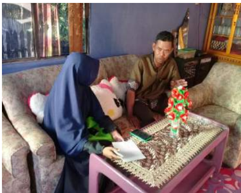
Foto Ketua RT 06