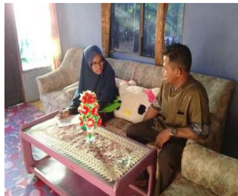
Foto dengan Ketua RT 07