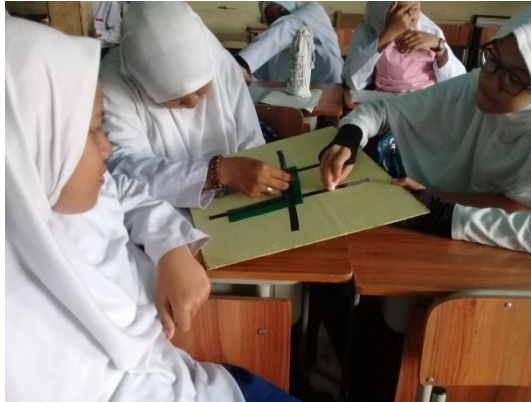
Gambar XVI Siswa Mendemonstrasikan Alat Peraga

Partner menjawab soal yang sudah dibagikan dan pelatih bertugas mengecek jawaban, setiap soal yang benar pelatih memberi kupon. Setelah selesai mengecek, maka pasangan itu berganti peran siswa yang menjadi pelatih maka bertukar peranan menjadi partner dan sebaliknya. Guru membagi soal kedua yang terdapat pada RPP kepada partner, partner menjawab soal yang sudah dibagikan dan pelatih bertugas mengecek jawaban, setiap soal yang benar pelatih memberi kupon.