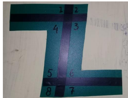
Gambar XI Tampilan model Z