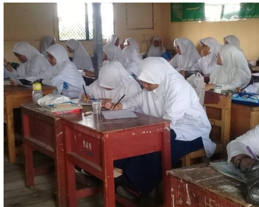
Gambar XVII Siswa Mengerjakan Soal

Partner menjawab soal yang sudah dibagikan dan pelatih bertugas mengecek jawaban, setiap soal yang benar pelatih memberi kupon. Setelah selesai mengecek, maka pasangan itu berganti peran siswa yang menjadi pelatih maka bertukar peranan menjadi partner dan sebaliknya. Guru membagi soal kedua yang terdapat pada RPP kepada partner, partner menjawab soal yang sudah dibagikan dan pelatih bertugas mengecek jawaban, setiap soal yang benar pelatih memberi kupon.