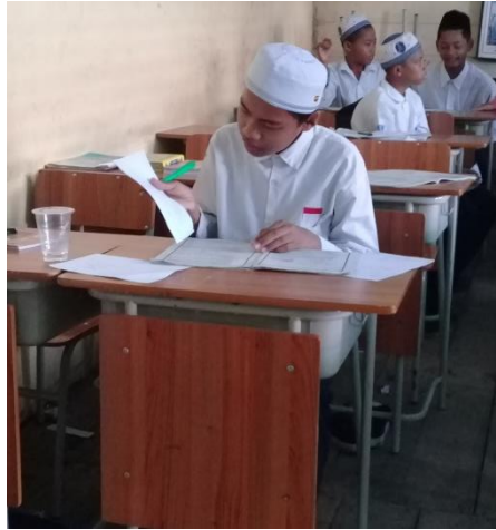
Gambar XVIII Siswa Mengerjakan Soal Tes Akhir