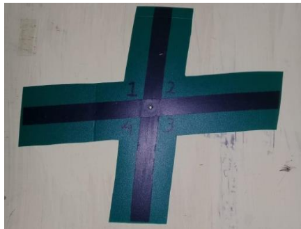
Gambar X Tampilan Model X