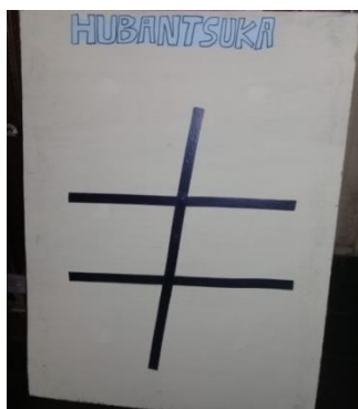
Gambar IX Tampilan papan