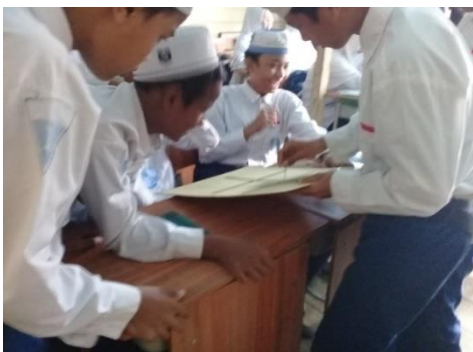
Gambar XIV Siswa Mendemonstrasikan Alat Peraga

Guru menjelaskan materi pelajaran tentang hubungan antar sudut dan mendemonstrasikan alat peraga hubantsuka. Kemudian guru membagi siswa kedalam 7 tim, setiap tim terbagi menjadi 4 orang. Dalam satu tim terdapat dua pasangan setiap pasangan dalam satu tim ada yang berperan menjadi pelatih dan ada yang menjadi patner. Guru membagi soal pertama yang terdapat pada RPP kepada partner.