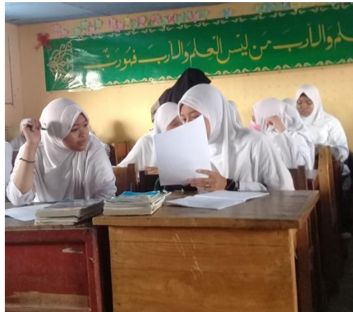
Gambar XV Siswa Mengerjakan Soal

Partner menjawab soal yang sudah dibagikan dan pelatih bertugas mengecek jawaban, setiap soal yang benar pelatih memberi kupon. Setelah selesai mengecek, maka pasangan itu berganti peran siswa yang menjadi pelatih maka bertukar peranan menjadi partner dan sebaliknya. Guru membagi soal kedua yang terdapat pada RPP kepada partner, partner menjawab soal yang sudah dibagikan dan pelatih bertugas mengecek jawaban, setiap soal yang benar pelatih memberi kupon.