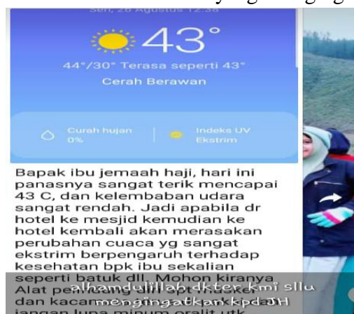
GAMBAR 4.13 Dokter yang Mengingatkan Kepada Jemaah

Pada gambar 4.13 perhatian dokter petugas haji kepada jemaah dalam bentuk pesan yang di sampaikan melalui media online (whatsapp) grup.