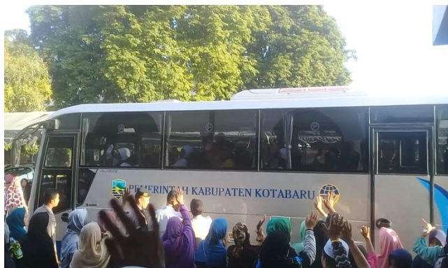
GAMBAR 4.10 Perjalanan Menuju Embarkasi Banjarmasin

Pada gambar 4.10Keberangkatan jemaah haji Kotabaru menuju pelabuhan ferry Tanjung Serdang lebih dahulu baru Sungai Danau untuk istirahat dan menuju Embarkasi Banjarmasin.