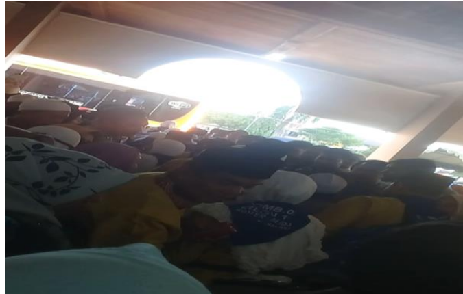
GAMBAR 4.9 Jemaah Calon Haji Menaiki Bus

Pada gambar 4.9 jemaah haji menaiki bus yang sudah di sediakan melalui jalur pintu yang ditentukan sesuai dengan kelompok masing-masing.