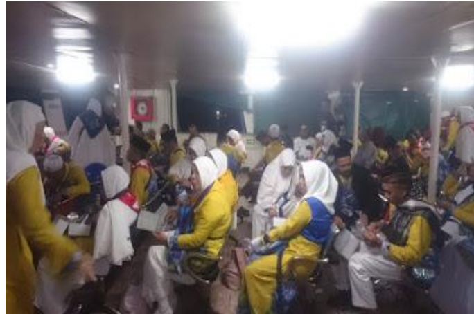
GAMBAR 4.11 Jemaah Berada di Kapal Ferry

Pada gambar 4.11 jemaah sedang duduk di dalam kapal ferry yang berada di lantai 2 kapal, dengan jarak tempuh yang lumayan lama jemaah menyantap makanan yang sudah di sediakan pada saat menaiki bus.