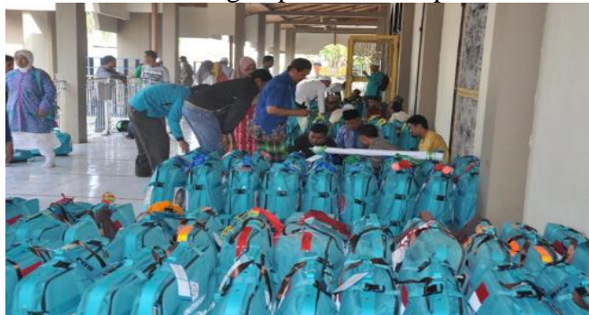
GAMBAR 4.6 Pengumpulan Tas Koper Besar

Pada gambar 4.6 pengumpulan tas koper besar jemaah kepada ketua kelompok masing-masing (ketua regu) untuk di cek kembali.