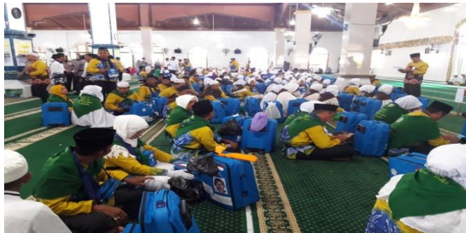
GAMBAR 4.7 Jemaah Memasuki Masjid Raya Husnul Khatimah

Pada Gambar 4.7 jemaah masuk ke dalam masjid untuk menunggu jemaah lain datang dan Acara pelepasan, sembari menunggu jemaah menggunakan waktu yang ada untuk sholat dan membaca buku yang dikalungkan jemaah haji.