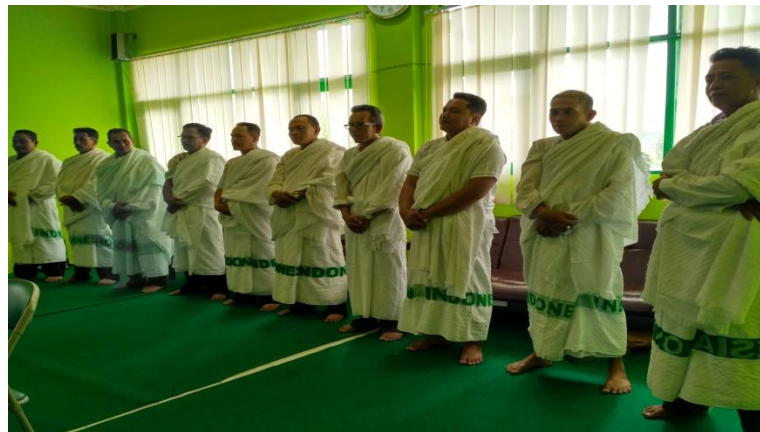
GAMBAR 4.4 Kegiatan Manasik Haji

Pada gambar 4.4 kegiatan manasik khusus ketua-ketua selama 10 hari sebelum manasik masal bersama jemaah haji dilaksanakan.