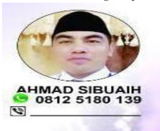
GAMBAR 4.3 Tim Petugas Haji Daerah (TPHD)