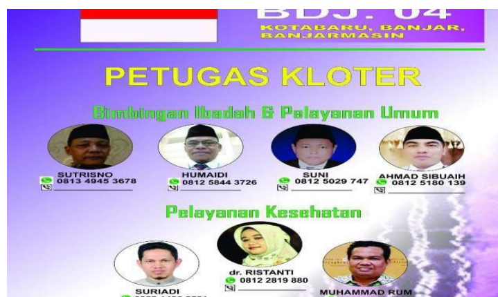
GAMBAR 4.12 Struktur Ketua Kloter

Setiap menjalankan atau mengadakan kegiatan pemerintah beserta Kementerian Agama Kabupaten Kotabaru memilih Tim Petugas Haji Daerah (TPDH), Ketua Rombongan dan Ketua Regu membantu jemaah calon haji selama berada di perjalanan. Pengorganisasian digunakan untuk mengelompokkan orang-orang sesuai dengan tugasnya masing-masing guna mengelola program kerja sehingga mendapatkan hasil yang memuaskan sesuai dengan tujuan yang di rencanakan.