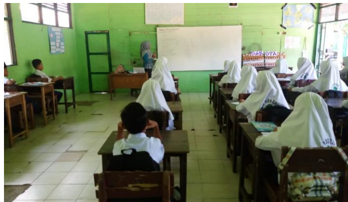
Gambar XII. Menjelaskan Materi FPB