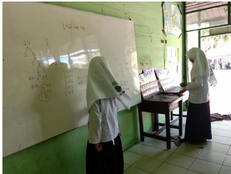
Gambar X. Perwakilan Siswa Menyelesaikan Soal KPK