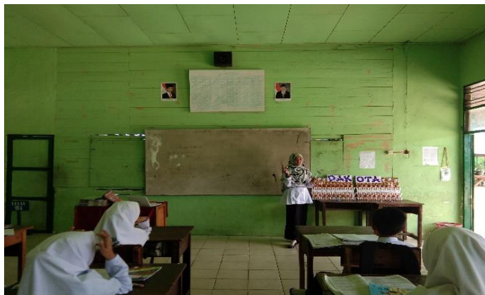
Gambar VIII. Menjelaskan Cara Penggunaan Dakota

Hal ini berarti ketiga warga tersebut akan ronda bersama-sama selama 12 hari. Jadi, mereka akan meronda bersama-sama pada tanggal 17 Oktober + 12 hari = 29 Oktober 2004.