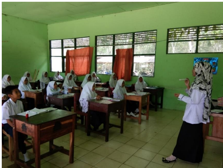
Gambar VII. Pemberian Materi Pada Pertemuan Pertama

Guru terlebih dahulu menyiapkan RPP dan alat peraga dakota yang akan digunakan pada proses pembelajaran. RPP dibuat agar peneliti memiliki gambaran bagaimana pembelajaran yang dilakukan di kelas dan alat peraga dakota berguna untuk mempermudah para siswa belajar pada saat pembelajaran berlangsung. Pada penyajiakn materi ini, guru memulai dengan mengemukakan beberapa pertanyaan kepada siswa tentang materi yang akan dipelajari berdasarkan pengalaman belajarnya.