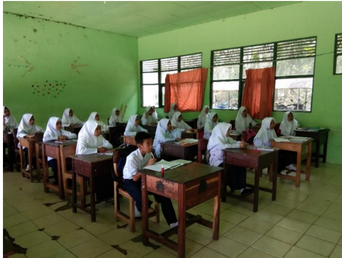
Gambar XI. Penyajian Materi Pada Pertemuan Ketiga