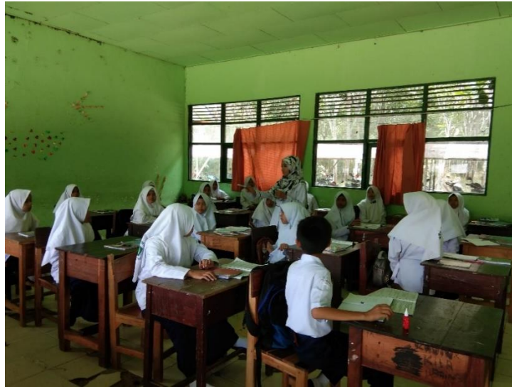
Gambar IX. Siswa Mengajukan Pertanyaan