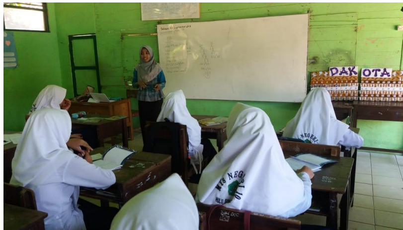
Gambar XIII. Mengajukan Pertanyaan Kepada Siswa