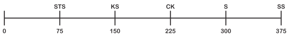
(Gambar 3.1 Tingkat Kesesuaian per Butir Pernyataan) (Sumber: Sugiyono, 2018)

Jumlah skor ideal untuk satu butir pernyataan: 5 \times 75 = 375 (seandainya semua menjawab SS). Secara umum dapat digambarkan sebagai berikut.