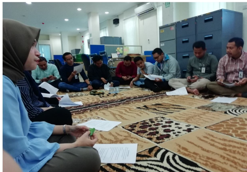
Penyebaran Angket Kepada Karyawan