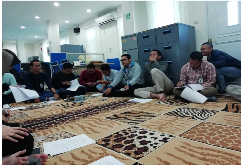
Pengisian Angket Oleh Karyawan