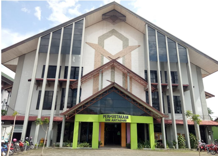
Gambar 1 Perpustakaan UIN Antasari Banjarmasin