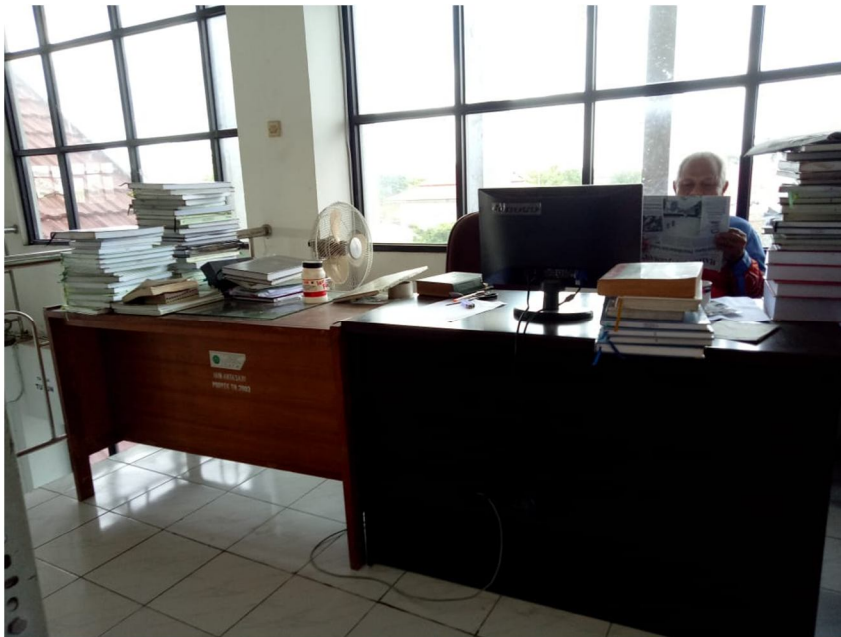
Gambar 7 Komputer di ruang pelayanan referensi lantai 3