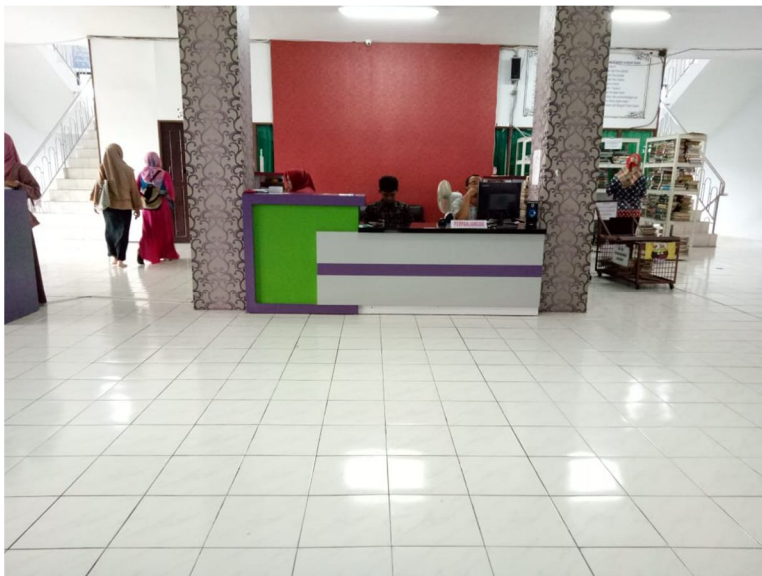
Gambar 2 Komputer di ruang pelayanan peminjaman buku dan pendaftaran anggota perpustakaan