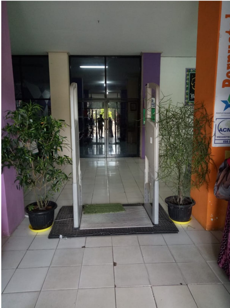
Gambar 9 Security Gate