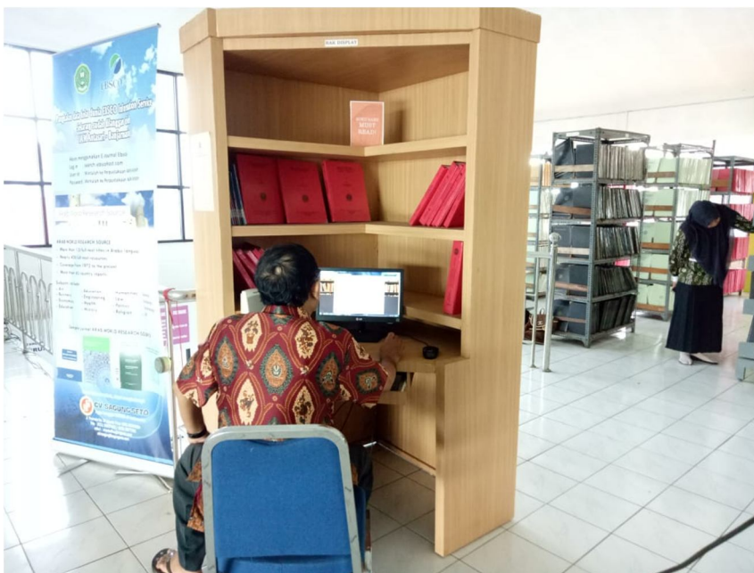
Gambar 6 Komputer di lantai 3 untuk melihat katalog karya ilmiah dan ensiklopedia