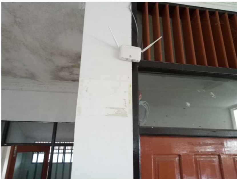
Gambar 8 Modem Wifi untuk jaringan internet