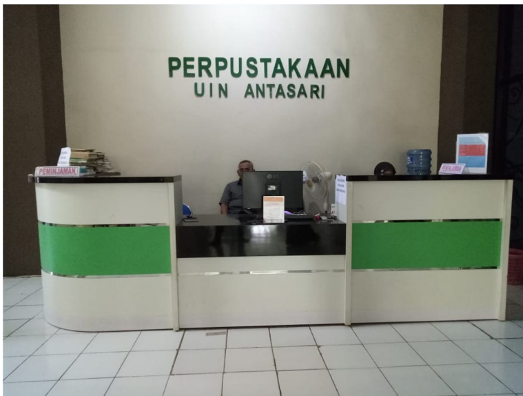
Gambar 4 Komputer di ruang Pengembalian Buku dan Informasi