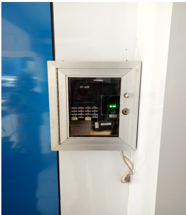
Gambar 11 Finger Print