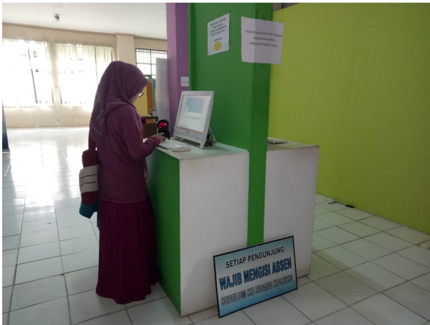
Gambar 5 Komputer di lantai 1 untuk registrasi masuk anggota perpustakaan