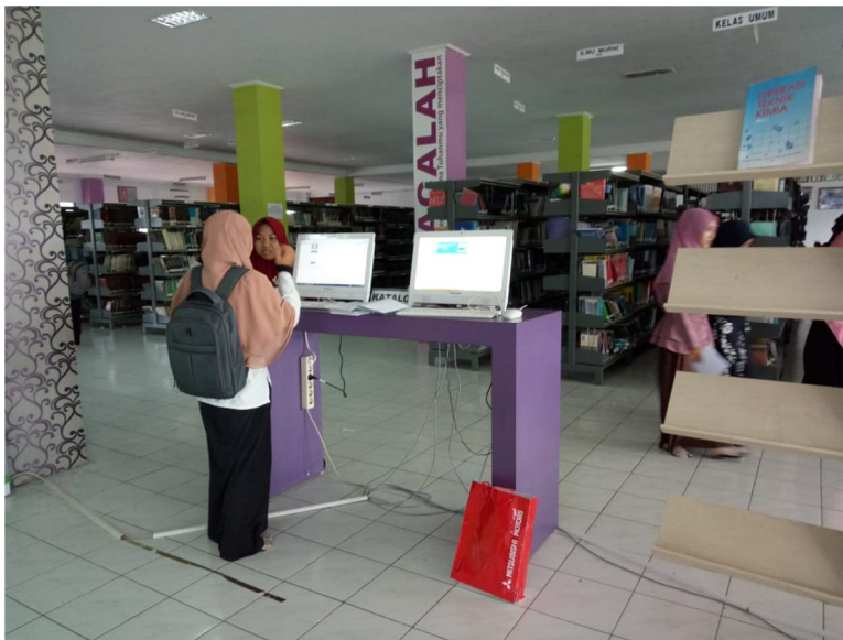
Gambar 3 Komputer yang digunakan untuk melihat katalog buku-buku di Perpustakaan UIN Antasari Banjarmasin