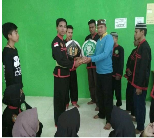
Foto-Foto Kegiatan di Perguruan Laskar Ikhwan Ash-Shafa