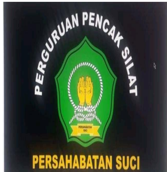
Bendera Perguruan Laskar Ikhwan Ash-Shafa