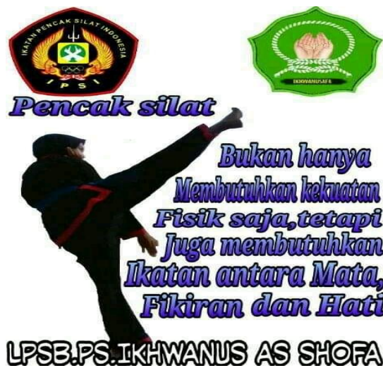
Kerja Sama Laskar Ikhwan Ash-Shafa dengan IPSI