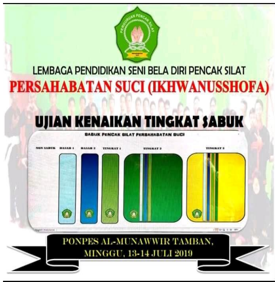
Tingkatan Sabuk Laskar Ikhwan Ash-Shafa