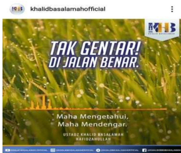
Gambar 4.3 Potongan Gambar dari Instagram @khalidbasalamahofficial

Artinya : “Apakah mereka mengira, bahwa Kami tidak mendengar rahasia dan bisikan-bisikan mereka ? Sebenarnya (Kami mendengar), dan utusan-utusan (malaikat-malaikat) Kami selalu mencatat di sisi mereka.” (QS. Az-Zukhruf : 80) 1