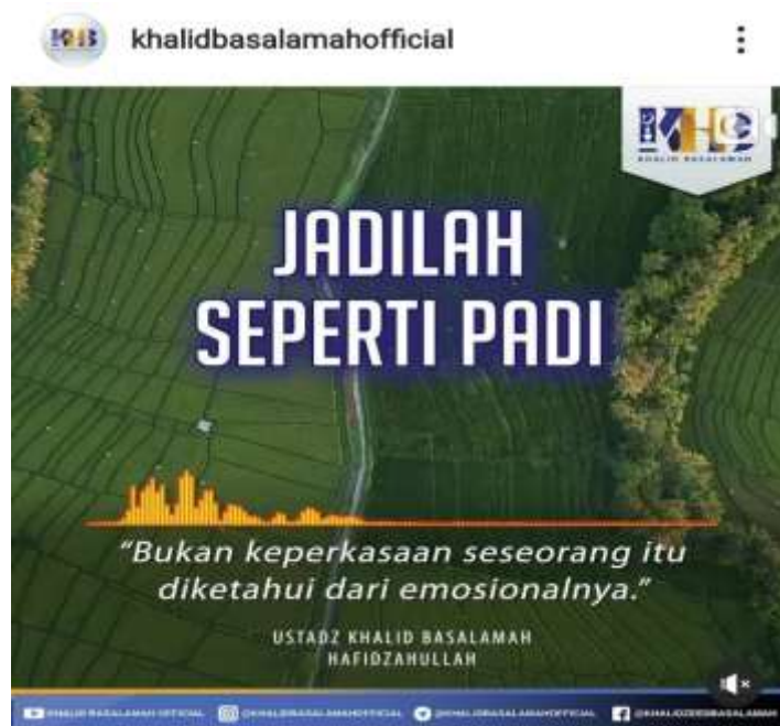
Gambar 4.5 Potongan Gambar dari Instagram @khalidbasalamahofficial

menyukai orang-orang yang sombong dan membangga-banggakan diri” 7 (QS. An Nisa : 36)