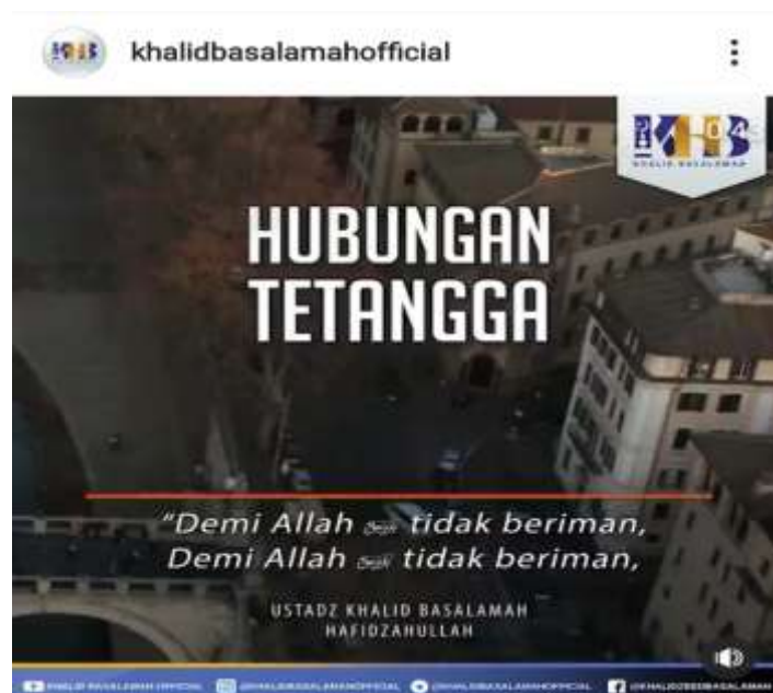
Gambar 4.4 Potongan Gambar dari Instagram @khalidbasalamahofficial