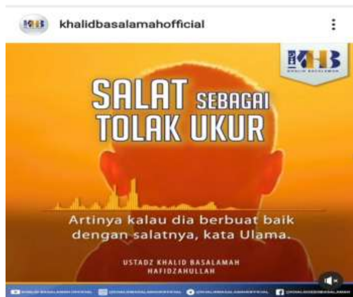
Gambar 4.3 Potongan Gambar dari Instagram @khalidbasalamahofficial

Artinya : “Hal pertama yang dihisab dari seorang hamba pada hari kiamat dari amalannya adalah shalat. Apabila shalatnya baik maka sungguh ia telah sukses dan selamat. Sebaliknya, apabila rusak maka sungguh ia telah gagal dan merugi.” (HR. Abu Daud )