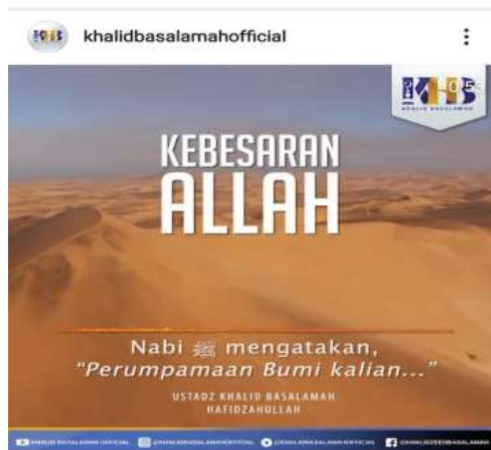
Gambar 4.3 Potongan Gambar dari Instagram @khalidbasalamahofficial

Allah Maha Melihat, Allah bukan Cuma bisa melihat yang dzahir. Tapi juga bisa melihat yang ghaib, melihat isi hati manusia. Allah Ta’la berfirman dalam Alquran surah Ali-Imron ayat 29 yang artinya “Katakanlah wahai Muhammad, sekalipun engkau semua sembunyikan apa-apa yang ada didalam hatimu ataupun engkau sekalian tampilkan, pasti diketahui juga oleh Allah.”