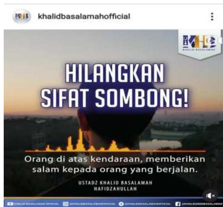
Gambar 4.7 Potongan Gambar dari Instagram @khalidbasalamahofficial

Al Hafidz Ibnu Hajar Rahimahullah berkata, “Hadits ini dijadikan dalil larangan terhadap seluruh macam perkataan pada saat khutbah, dan demikian itu pendapat mayoritas ulama terhadap orang yang mendengar khutbah.”