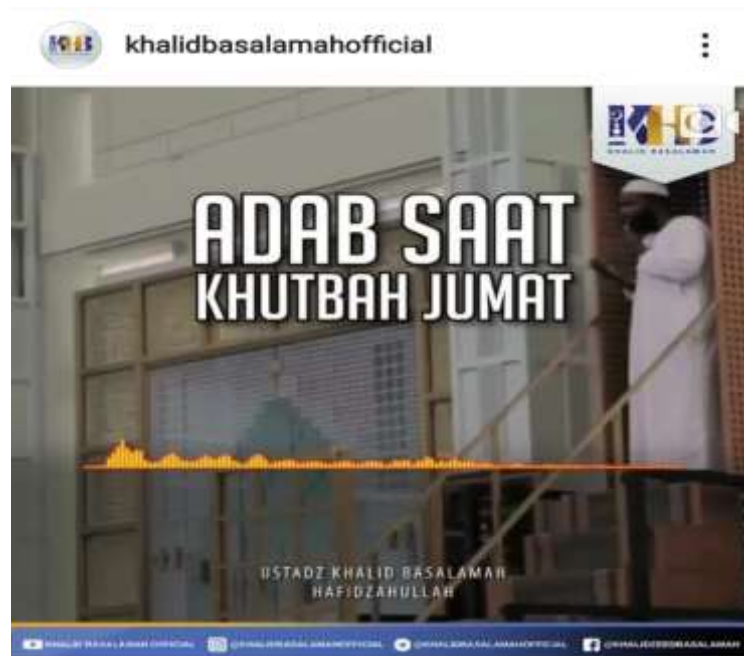
Gambar 4.6 Potongan Gambar dari Instagram @khalidbasalamahofficial

Oleh karena itu, sesama manusia harus bertawadhu agar tiap pribadi tidak saling membanggakan atau sombong. Karena sombong merupakan perbuatan tercela dan pada hakikatnya manusia memang tidak diperbolehkan sombong, sebab sesungguhnya mau sebaik dan sekuat apapun seseorang, tetap saja ia tidak akan mampu menembus langit yang menjulang.