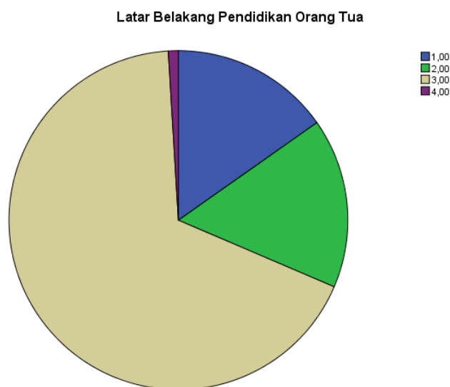
Gambar 4.1: Pie Chats Variabel Latar Belakang Pendidikan Orang Tua

Berdasarkan tabel kecenderungan tingkat pendidikan orang tua dapat digambarkan dalam pie charts sebagai berikut: