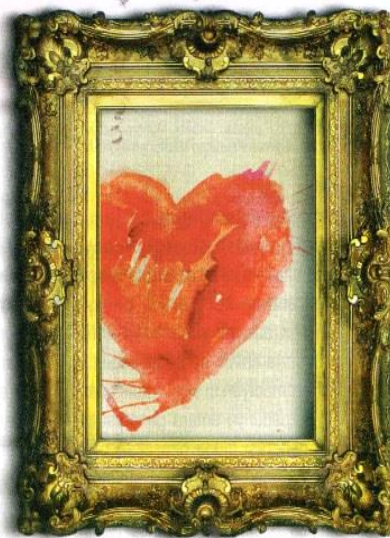
Digital Ilustrasi: bqw

Ayat tersebut menyebutkan bahwa salah satu ciri orang bertakwa adalah mampu menahan amarahnya. Sehingga, alangkah baiknya jika emosi berwujud amarah dimenej dengan berpedoman pada ajaran Rasulullah saw. Hadits shahih riwayat Ahmad menyebutkan,