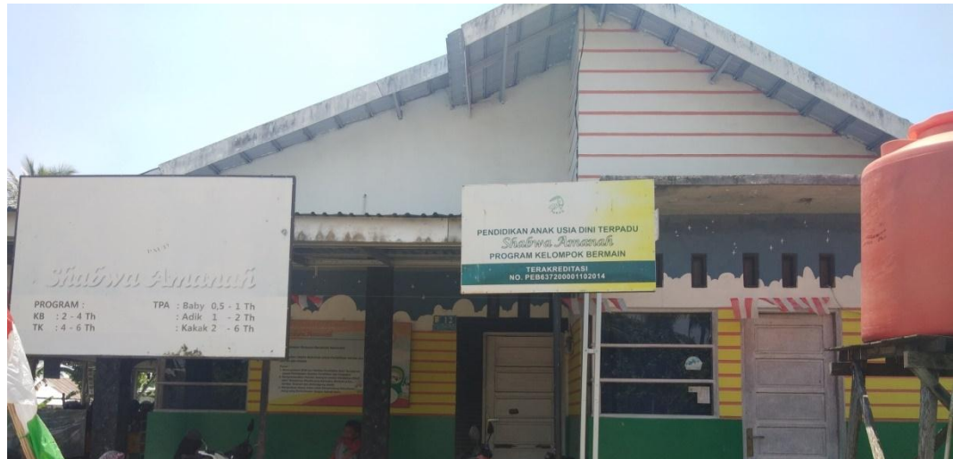
Gambar I (DLF.1.1) 37 PAUD Terpadu Shabwa Amanah Landasan Ulin Utara Kec. Liang Anggang Kota Banjarbaru.

orangtua bekerja dan ingin memberikan layanan pendidikan yang sesuai dengan tahapan perkembangan anak. (DLA.1) 36