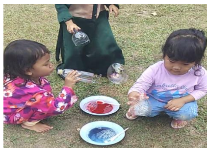
Gambar XI (DLF.2.14) 92 Anak perempuan bermain meniup balon

Setelah selesai lalu anak kemudian recalling tentang sub tema air dengan ibu HK bahwa yang diperlihatkan ibu HK itu adalah air dan ada beberapa kegunaan air baik digunakan untuk minum, mandi dan lain sebagainya sampai pukul 11.00 kemudian ibu mengajak anak membaca do'a setelah belajar dan kembali ke kelas masing-masing.(CLO.2.7.4) 91