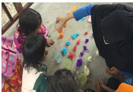
Gambar VII (DLF.2.8) 78 Anak perempuan membuat air berubah warna dengan kertas crap

Setelah selesai guru kemudian melakukan recalling tapi sebelumnya ibu HK menanyakan tentang perasaan anak hari ini, apakah mereka senang bermain disentra bahan alam? Anak perempuan pun menjawab bahwa mereka senang bermain disentra bahan alam lalu ibu HK mengulang sedikit tentang pelangi, bahwa apa yang telah dikenalkan ibu HK hari ini anak perempuan menjawab pelangi, apa saja warna pelangi? Ada yang menyebut merah hijau dan biru ada yang menyebut kuning dan lain-lain sampailah pukul 11.00 kemudian ibu mengajak anak membaca do'a setelah belajar dan kembali ke kelas masing-masing.(CLO.2.5.4) 77