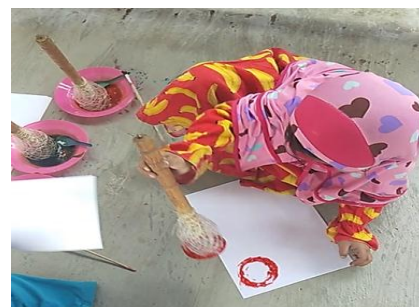
Gambar VIII (DLF.2.9) 79 Mengecap dengan menggunakan alat adonan kue