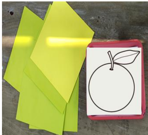
Gambar V (DLF.2.5) 66 Kolase buah jeruk