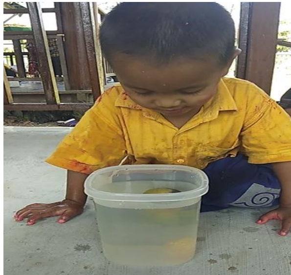
Gambar IV (DLF.2. 3) 60

Anak melakukan percobaan jeruk yang sudah dikupas dan yang belum dikupas saat dimasukkan kedalam air