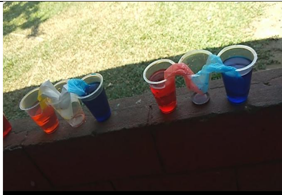
Gambar VI (DLF.2. 7) 72 Anak membuat tisu warna pelangi berjalan