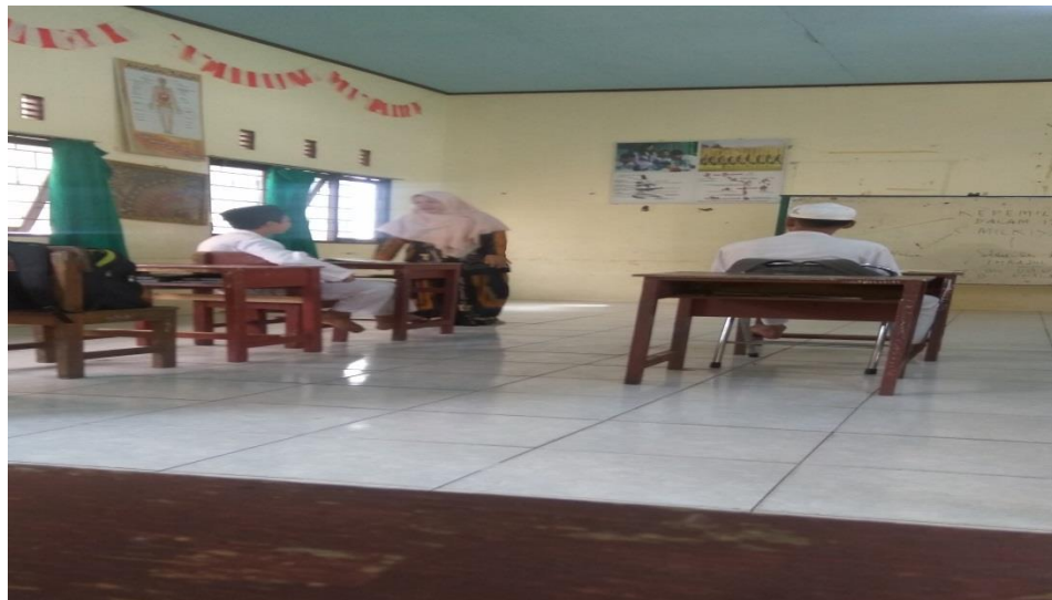
Guru menanyakan materi kepada siswa dan siswa menjawab