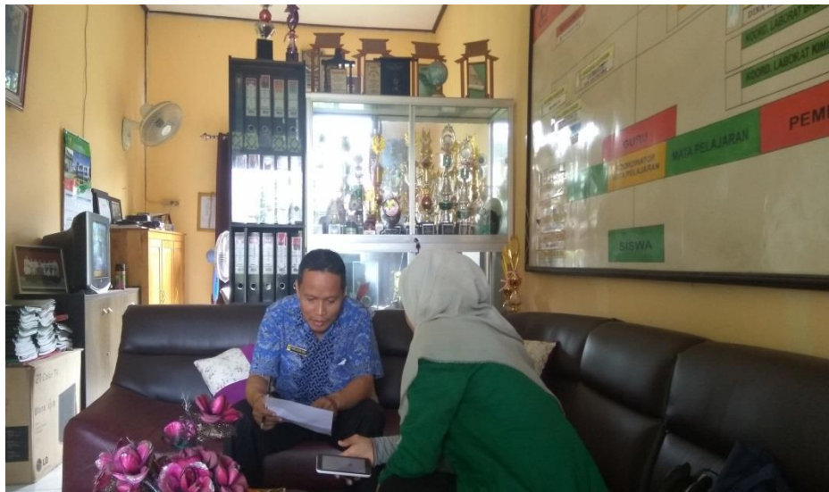
Kegiatan Wawancara peneliti dengan kepala Sekolah di Madrasah Aliyah SMIP 1946 Banjarmasin (Sabtu, 04 Oktober 2019)