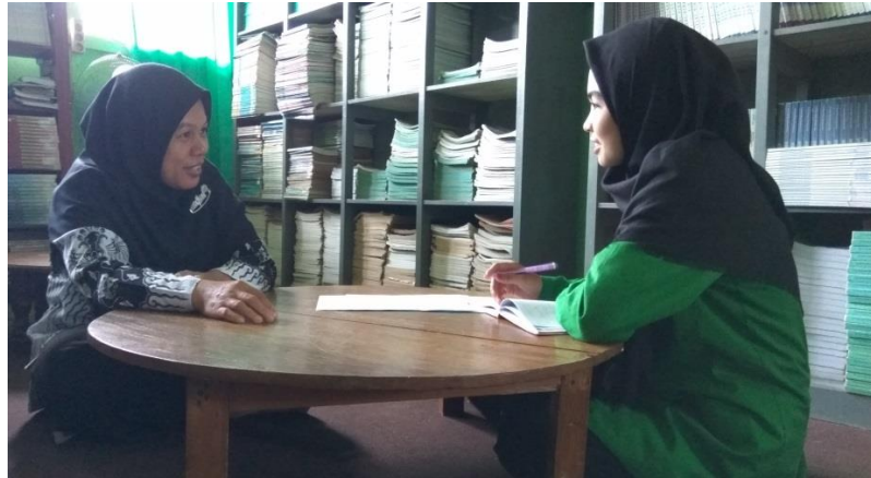
Kegiatan Wawancara peneliti dengan guru fiqih di Madrasah Aliyah SMIP 1946 Banjarmasin

Proses Kegiatan pembelajaran pertama dengan menggunakan strategi The Power Of Group pada materi Jihad