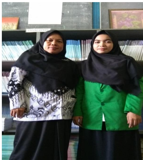
Peneliti dengan guru fiqih di Madrasah Aliyah SMIP 1946 Banjarmasin