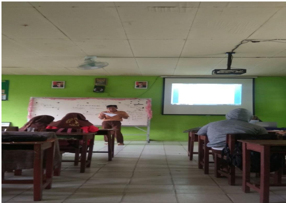
Siswa menyimpulkan materi pelajaran

(Dokumentasi pada hari sabtu tanggal 11 Januari 2020)