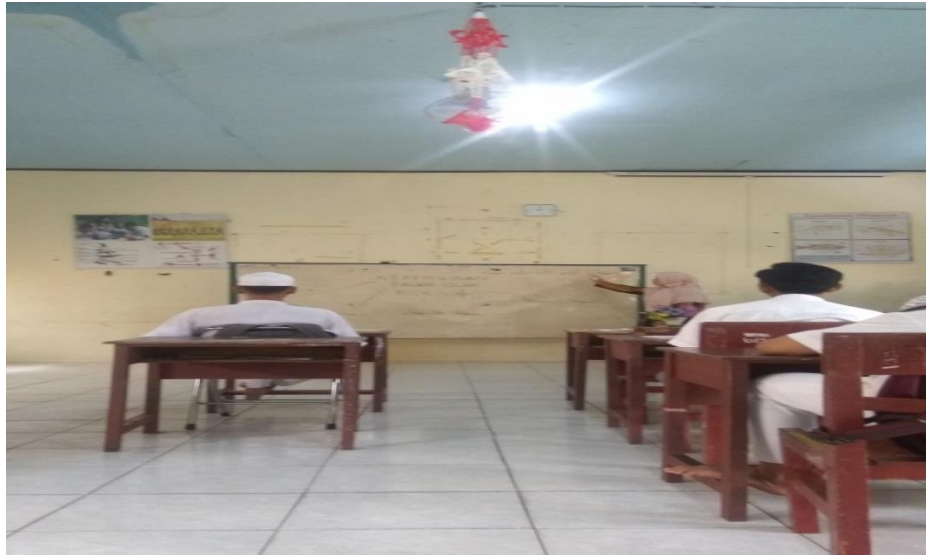
Kegiatan menyimak penjelasan dari guru melalui media papan tuli