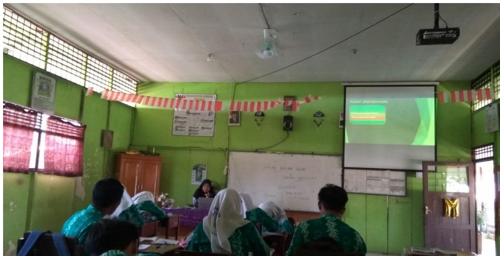
Guru menjelaskan materi di slide ppt dan siswa mengamati

Proses Kegiatan pembelajaran pertama dengan menggunakan strategi The Power Of Group pada materi Jihad