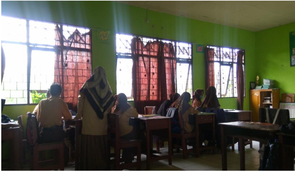
Peserta didik berdiskusi secara berkelompok untuk menjawab tugas sesuai petunjuk di lembar kerja siswa