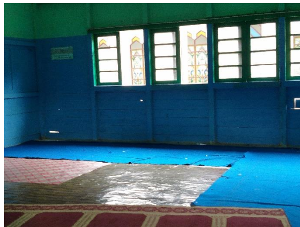
Musholla MTs SMIP 1946