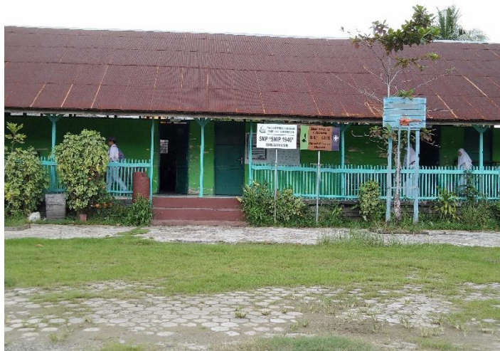
Bangunan SMP SMIP 1946