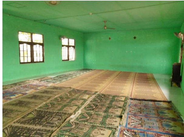
Musholla MA SMIP 1946