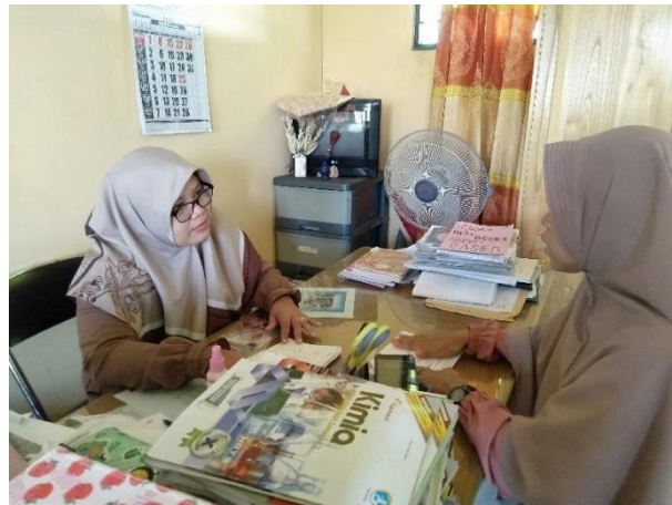
Wawancara Wakil kepala Madrasah MA SMIP 1946