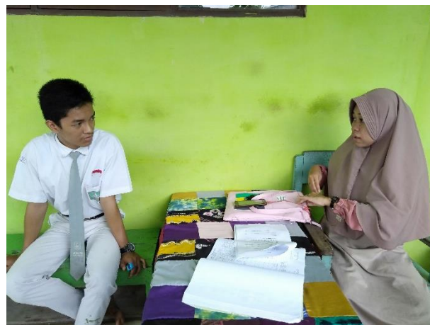
Wawancara salah satu siswa Yayasan SMIP 1946