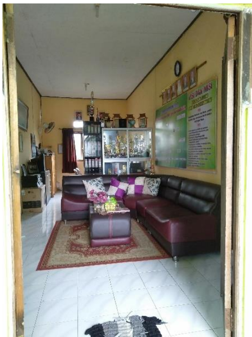
Ruang Kepala Madrasah