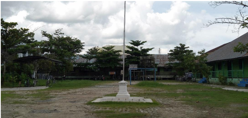
Lapangan Yayasan SMIP 1946