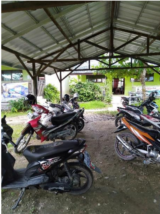
Parkiran Yayasan SMIP 1946