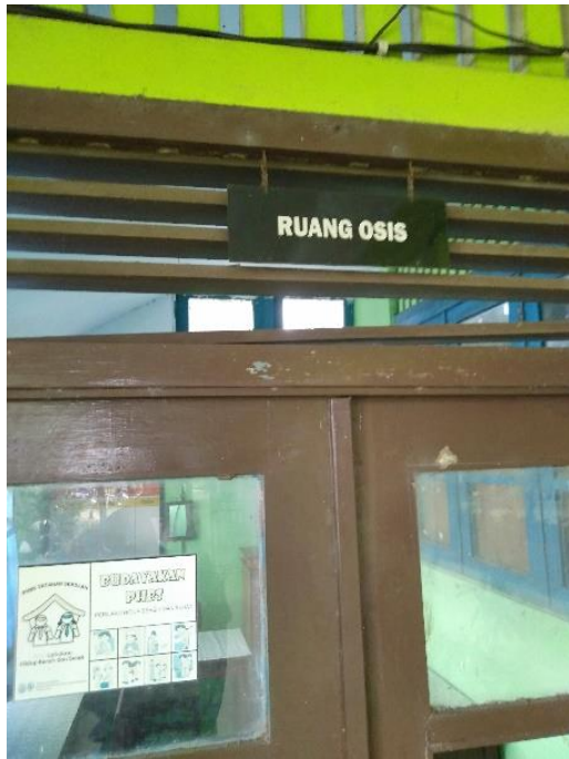
Ruang Osisi MA SMIP 1946