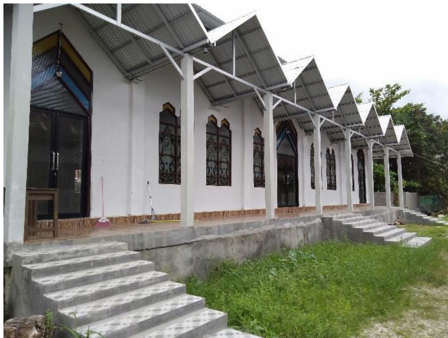
Aula Yayasan SMIP 1946