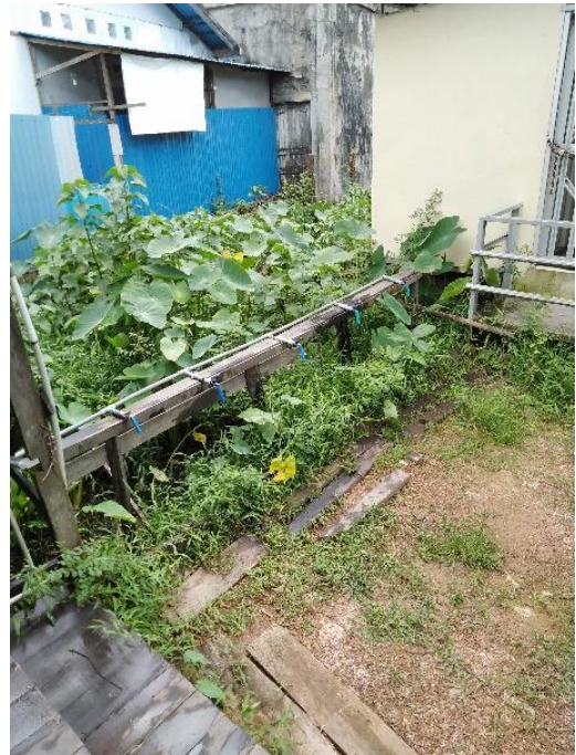
Tempat Wudhu Yayasan SMIP 1946