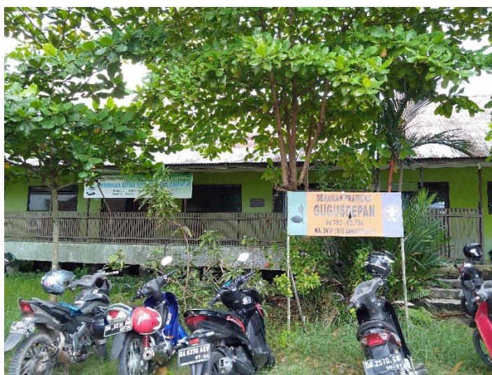
Bangunan MA SMIP 1946