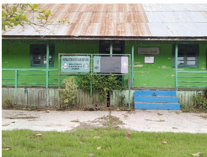
Bangunan MTs SMIP 1946