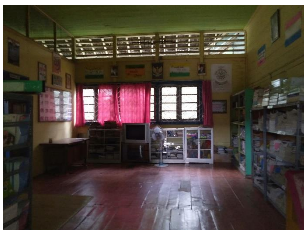
Perpustakaan MTs SMIP 1946