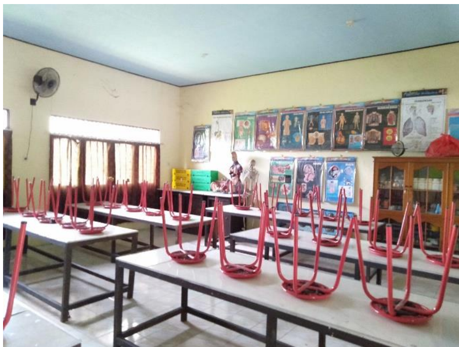
Laboratorium IPA MA SMIP 1946