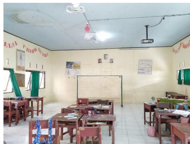
Kedaaan Ruang Kelas di Yayasan SMIP 1946