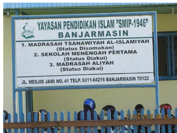
Plakat Yayasan SMIP 1946 Dari halaman Yayasan