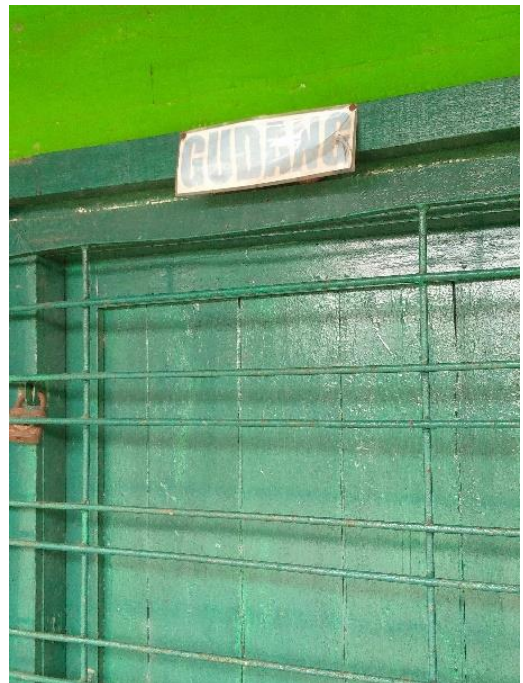
Gudang Yayasan SMIP 1946