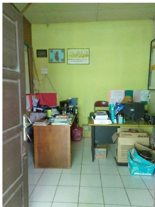
Ruang 1 atai Usaha