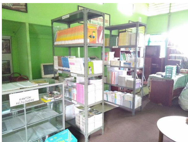
Perpustakaan MA SMIP 1946