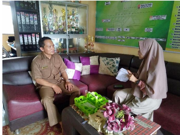
Wawancara Kepala Madrasah MA SMIP 1946