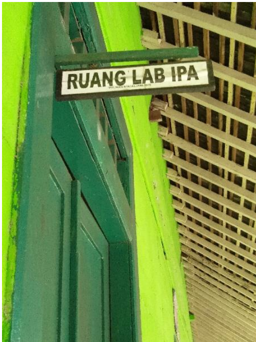
Laboratorium IPA MTs SMIP 1946