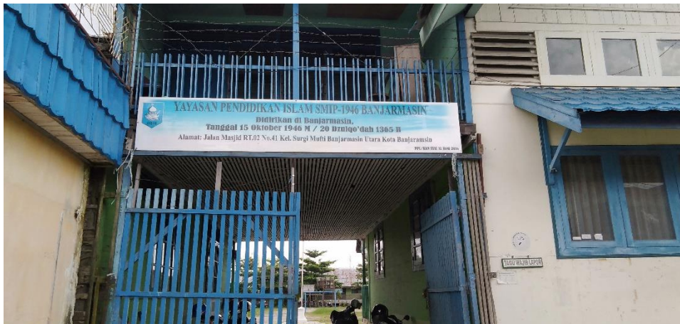
Halaman depan Yayasan SMIP 1946